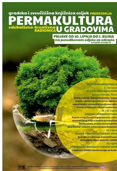
Slika 5. Najava radionice "Permakultura u gradovima" 88

bilja u malim prostorima (na balkonima, u malim betoniranim dvorištima i sličnim urbanim površinama), a kao praktični zadatak morali su zajednički izraditi mali