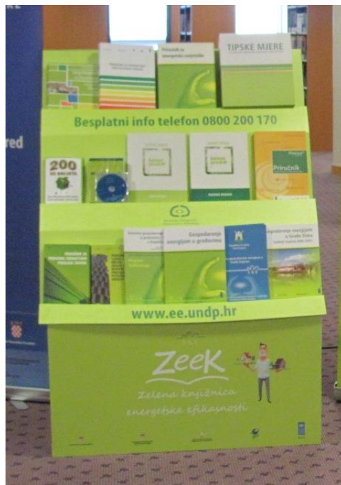
Slika 3. Polica Zelene knjižnice energetske efikasnosti 77

knjižnica, od školskih, visokoškolskih do narodnih diljem Hrvatske (Split, Rijeka, Osijek, Pula, Zadar, Karlovac,...). 76