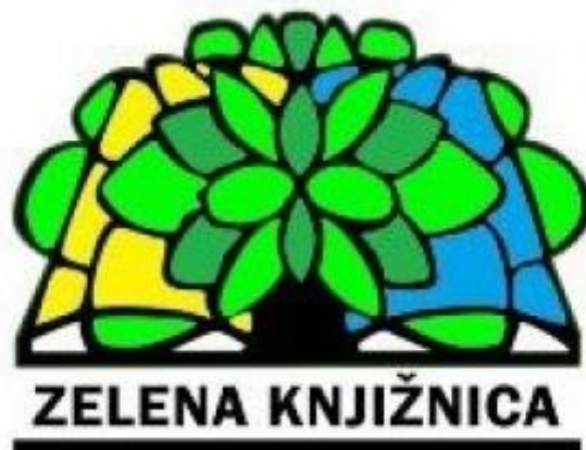
Slika 1: Logo projekta Društva bibliotekara Istre „Zelena knjižnica“ 67

Prateći svjetske trendove i hrvatske knjižnice su prepoznale važnost informiranja svojih korisnika i šire javnosti o ekološkim temama, no s programima i brojni aktivnostima su krenule tek desetak godina kasnije u odnosu na prve programe diljem svijeta.