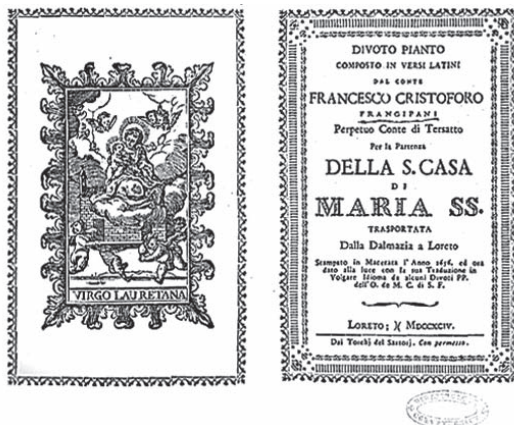
Sl. 1. Naslovnica drugoga izdanja latinske Elegije Frana Krste Frankopana Trsatskoga (Loreto, 1794) s početnom ilustracijom i pečatom Franjevačkoga samostana na Trsatu (sign. Trsat: RV-8*-36).