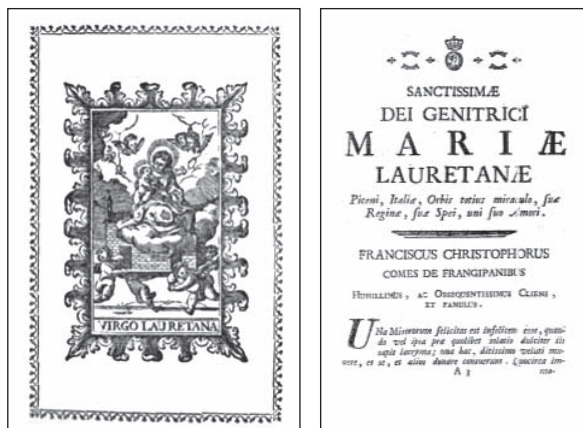
Sl. 4. Ilustracija VIRGO LAURETANA na početnoj stranici, koja prethodi naslovnici izdanja iz 1794. godine i prozna posveta na talijanskome jeziku iz primjerka Divoto pianto, koji se nalazi u Franjevačkom samostanu na Trsatu (sign. Trsat: RV-8*-36).

Inicijalna je ilustracija vješto odabrana, izvjesno je da je napravljena upravo za II. izdanje, na što upućuje ornamentalni okvir koji uokviruje i samu naslovnicu II. izdanja. Ta se ilustracija VIRGO LAURETANA nadovezuje na autorovu proznu posvetu Presvetoj Bogorodici Mariji Loretskoj ( Sanctissimae Dei genitrici Mariae Lauretanae / A Maria Vergine Lauretana ) i emblematiku 'duhovnih suza':