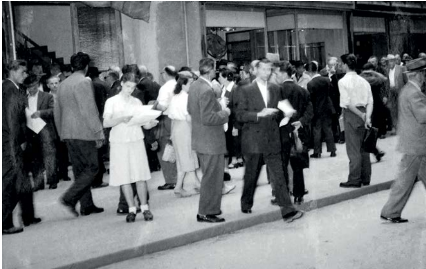
Prilog 1: Redovi ispred Američke čitaonice u Zagrebu na podjeli dnevnih radionovina Bilten