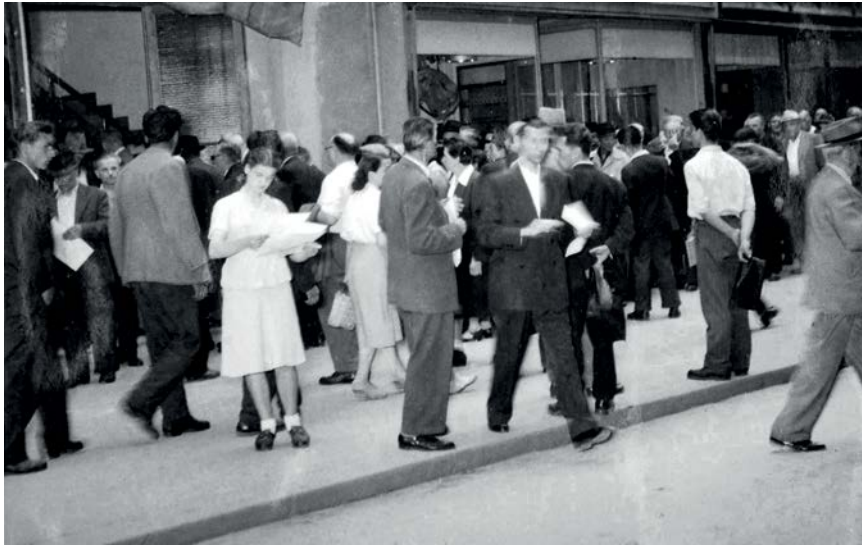
Prilog 1: Redovi ispred Američke čitaonice u Zagrebu na podjeli dnevnih radionovina Bilten ( Izvor: SAD – NACP – RG 59 – CDF 1950-1954, kut. 2472, fasc. 511.68/7-353, „Enclosure 3 in despatch 4 from the American Consulate Zagreb to the Department of State“, 3. srpnja 1953.)