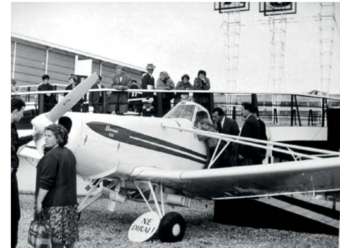
Prilog 4: Vojni zrakoplov za prskanje usjeva tvrtke Piper Aircraft Corporation na izložbi Intensive Farming 1964. na Zagrebačkom velesajmu.