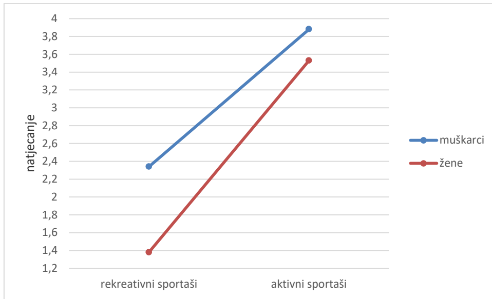
Slika 3. Motiv natjecanja s obzirom na spol i status sportaša

Motiv za natjecanjem izraženiji je kod aktivnih sportaša, pri čemu su muškarci i žene podjednako isticali ovaj motiv. Kod rekreativnih sportaša, motiv za natjecanjem izraženiji je kod muškaraca nego kod žena.