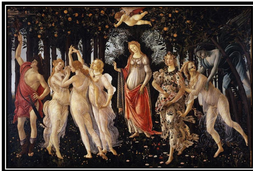
Figura 5: Sandro Botticelli, Primavera , 1477 - 1482.