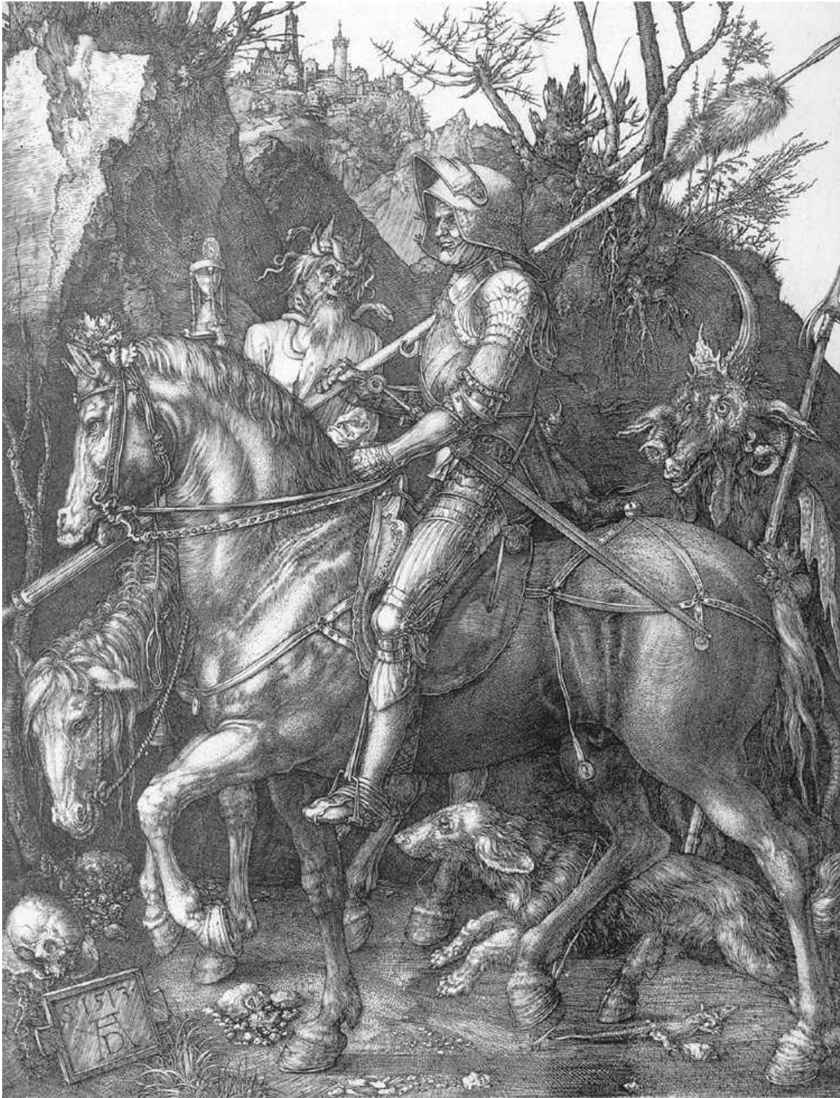
DÜRER, Albrecht.