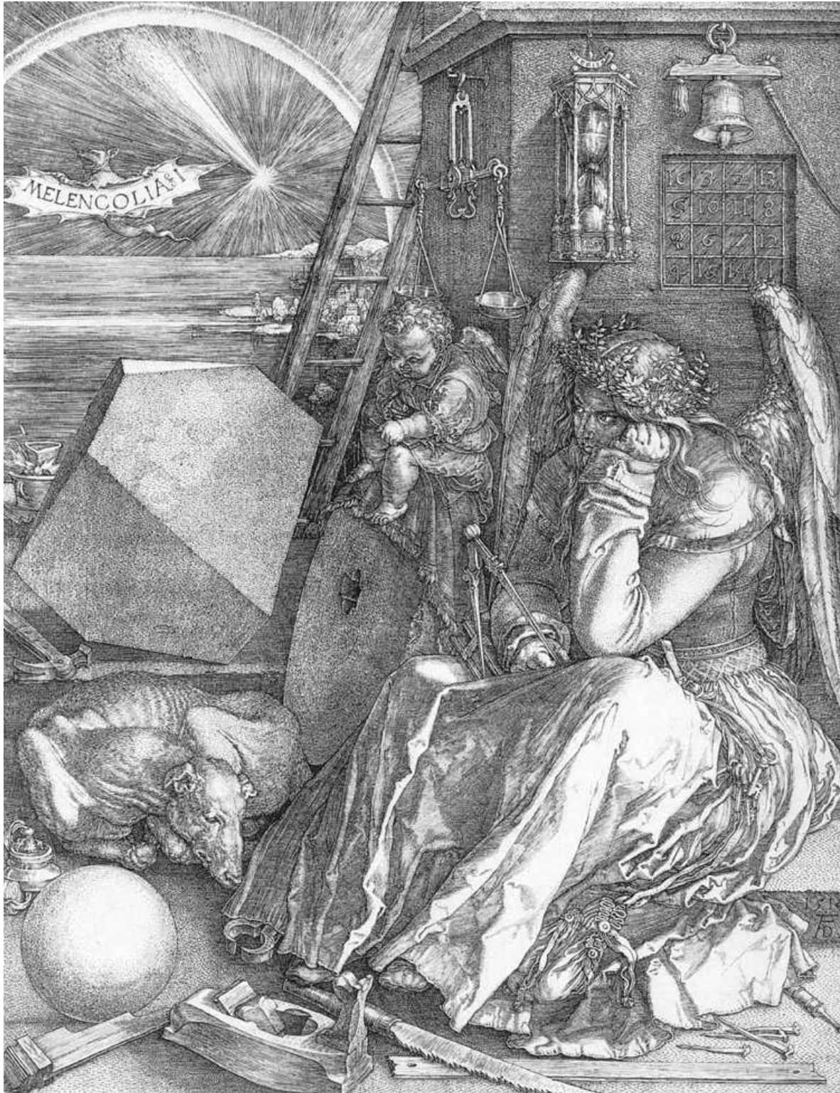
DÜRER, Albrecht.