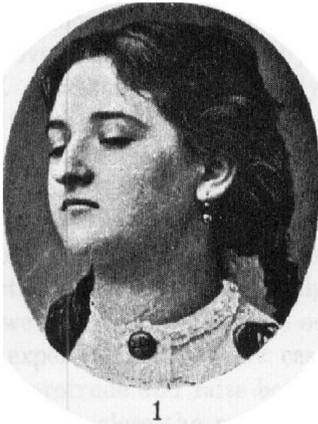
Slika 2.: Darwin, C., 1897, str. 269

Također za svaki izraz opisao je motorički aparat kojim se odvija određena emocija. Primjerice emocija ljutnje izražava se stiskanjem šaka koje se vrši tjelesnim mišićima. Strah ili ljutnja će se pak izraziti nakostriješenošću putem motoričkog aparata – kože. 11