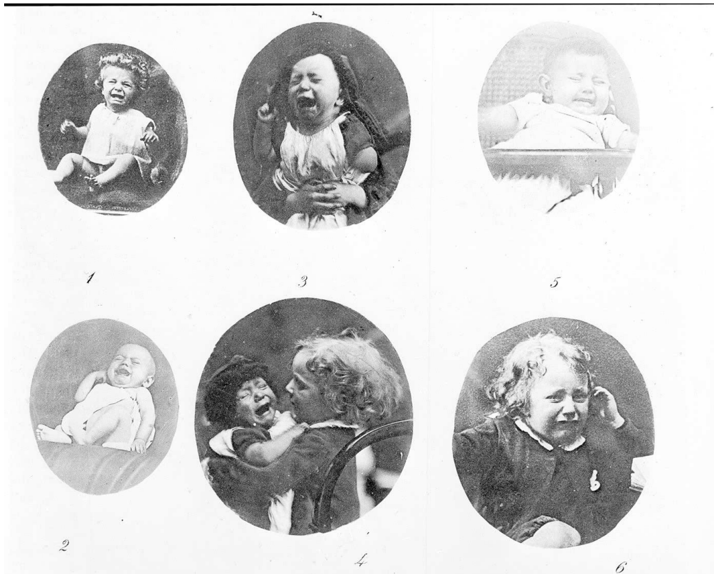
Slika 1: Preuzeto: Charles Darwin, The Expression of the Emotions in Man and Animals , New York: D. Appleton and Company, 1897, str. 146

Baš kao i mladunčad drugih životinja, djeca plaču kada žele hranu, trebaju pomoć ili na bilo koji način pate ili traže olakšanje. 10