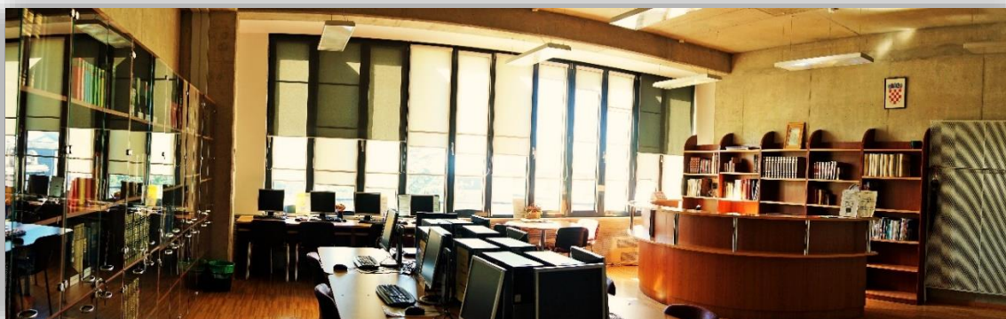
Slika 4. Knjižnica danas - posudbeni pult i čitaonica

Prostor Knjižnice raspoređen je na 460 m 2 , u suvremeno opremljenoj zgradi Filozofskog fakulteta. Ova površina obuhvaća čitaonicu, prostorije za smještaj fonda, spremište za arhivsku i ostalu građu te urede djelatnika. Uzimajući u obzir raznovrsnost studijskih programa koji se izvode na Fakultetu, knjižnični fond je multidisciplinaran, a izgrađuje se sukladno potrebama studija i znanstvenog rada, planski i u dogovoru s upravom Fakulteta. U Izvješću o radu Knjižnice iz 2017. godine zabilježeno je da fond čini 85.196 jedinica građe.