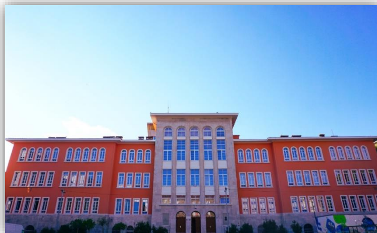
Slika 3. Zgrada Pedagoškog fakulteta u Rijeci, Ivana Klobučarića 1