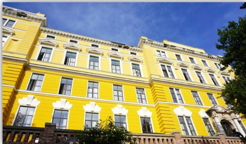
Slika 2. Zgrada Pedagoškog fakulteta u Rijeci, Omladinska 14

djeluje pri Filozofskom fakultetu u Rijeci. Knjižnica kontinuirano napreduje, pa je zabilježeno da je 1988. godine imala fond od 75.000 svezaka knjiga i 7.000 svezaka domaćih i stranih časopisa. Zabilježen je i statistički podatak da je pri studijskom radu u čitaonici te godine korišteno 45.000 knjiga. 41