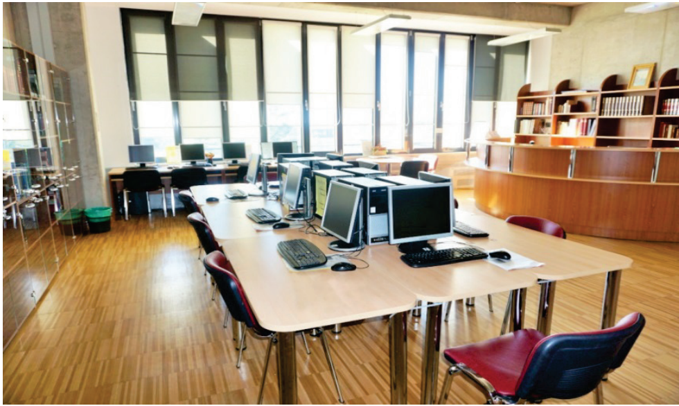
Slika 3. Prostor čitaonice

Edukacijski pristup korisniku primjenjuje se već od samog upisa, pri kojemu korisnik dobiva tiskani Informativni vodič i Edukaciju korisnika na CD-u. Uz to, Knjižnica organizira edukacijske radionice za studente prve godine svih studijskih grupa i ostale zainteresirane korisnike tijekom cijele akademske godine.