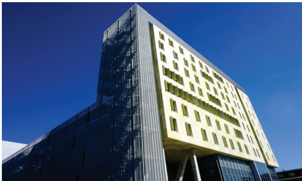
Slika 1. Zgrada Filozofskog fakulteta u Rijeci, Sveučilišna avenija 4

Knjižnice (slika 4 i 5) broji 85.196 jedinica građe 1 , a sastoji se od monografskih (76.391) i periodičnih publikacija (7.256), magistarskih i doktorskih radova (916) i elektroničke građe (633). Stvarno stanje fonda utvrđeno je akademske 2016./2017. godine, kada je okončana revizija cjelokupnog fonda od osnutka Knjižnice do kraja prosinca 2015. Revizija se, uključujući pripremu, provedbu i izradu zaključnih akata, provodila tijekom nekoliko godina, što je predstavljalo izuzetno zahtjevan poduhvat za sve djelatnike, osobito stoga što je Knjižnica za cijelo vrijeme provođenja revizije bila otvorena za korisnike. Uz klasični fond, važan informacijski izvor je i digitalna zbirka radova pohranjenih u institucijski repozitorij Dabar, u koji je do sada uneseno preko 1100 ocjenskih, stručnih i znanstvenih radova. Re-