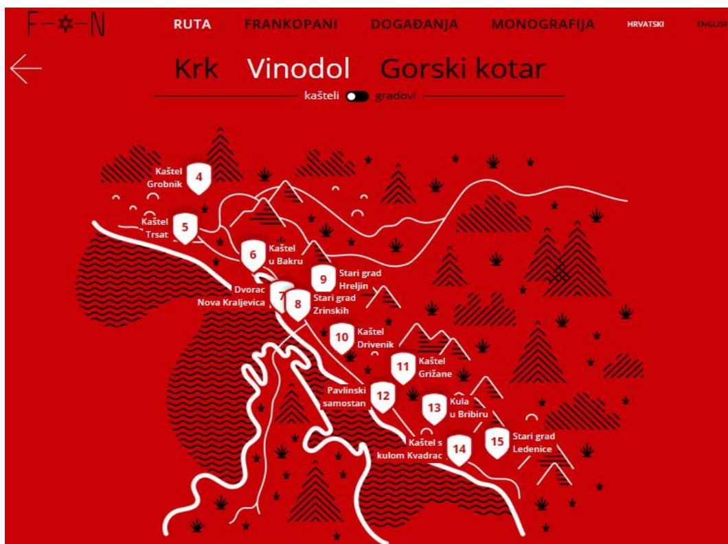
Slika 3: Prikaz ruta po regijama te kašteli i gradovi pojedinih regija

Na slici, u donjem desnom kutu, na karti Hrvatske označeno je na kojem dijelu se nalazi ova kulturno-turistička ruta, a kako bi se posjetitelji još lakše orijentirali, vidimo da je ovaj dio Primorsko-goranske županije podijeljen u tri regije: Krk, Vinodol i Gorski kotar. Svaka regija označena je zastavicom bijele boje i time je dobro vidljiva na crvenoj podlozi, a unutar zastavica koje simbolično označavaju cilj, mjesto koje treba posjetiti i „osvojiti“, nalaze se imena regija. Mapa je interaktivna, pa tako primjerice kada pokazivačem prođemo preko zastavice, ona „zavijori“. Brojevima od jedan do dvadeset označeni su frankopanski dvorci i sakralni objekti – dakle, radi se o sedamnaest kaštela i tri sakralna objekta. Kada kliknemo na neku od regija, otvara se nova stranica koju ću prikazati i analizirati sljedeću.