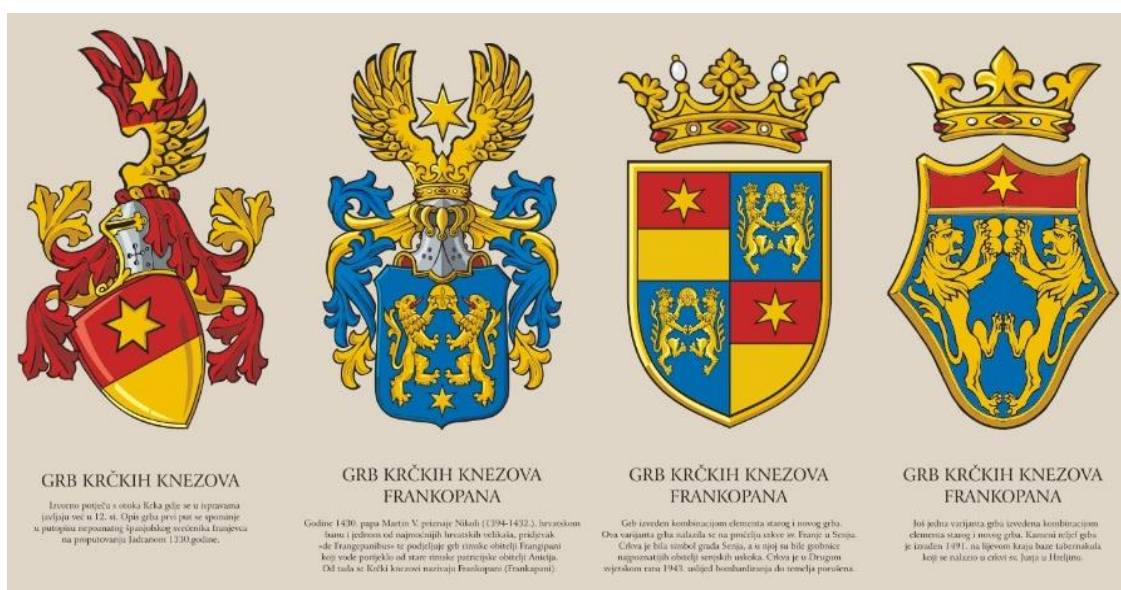
Slika 1. Frankopanski grbovi kroz povijest

Frankopani su se do 1430. godine nazivali knezovima Krčkim, a tada, pokušavajući u duhu vremena dokazati svoje porijeklo i povezanost s rimskom plemićkom porodicom Frangipani, uzeli su ime Frankopani. Točnije, Nikola IV. bio je prvi pripadnik roda koji se tako prozvao, a dotad su se Frankopani pojavljivali pod nazivom knezova krčkih. „Nikola se prvi put naziva Frankopanom u ispravi iz 1422. godine, a 1430. godine boravio je u Rimu, gdje mu je papa Martin V. potvrdio tobožnje rimsko podrijetlo. On je krčkim knezovima dodijelio novi grb: dva zlatna lava propinju se jedan prema drugome i lome komad kruha. Izvorni grb Krčkih bio je drukčiji: sastojao se od vodoravno prepolovljenoga srebrno-modrog štita sa zlatnom zvijezdom.“ (Holjevac 2005:80). Grb u kojem dominiraju dva lava u plavom štitu koji lome kruh je frangepanski grb, koji je nosila i mletačka obitelj Michieli, navodi Bertović (2018:16).