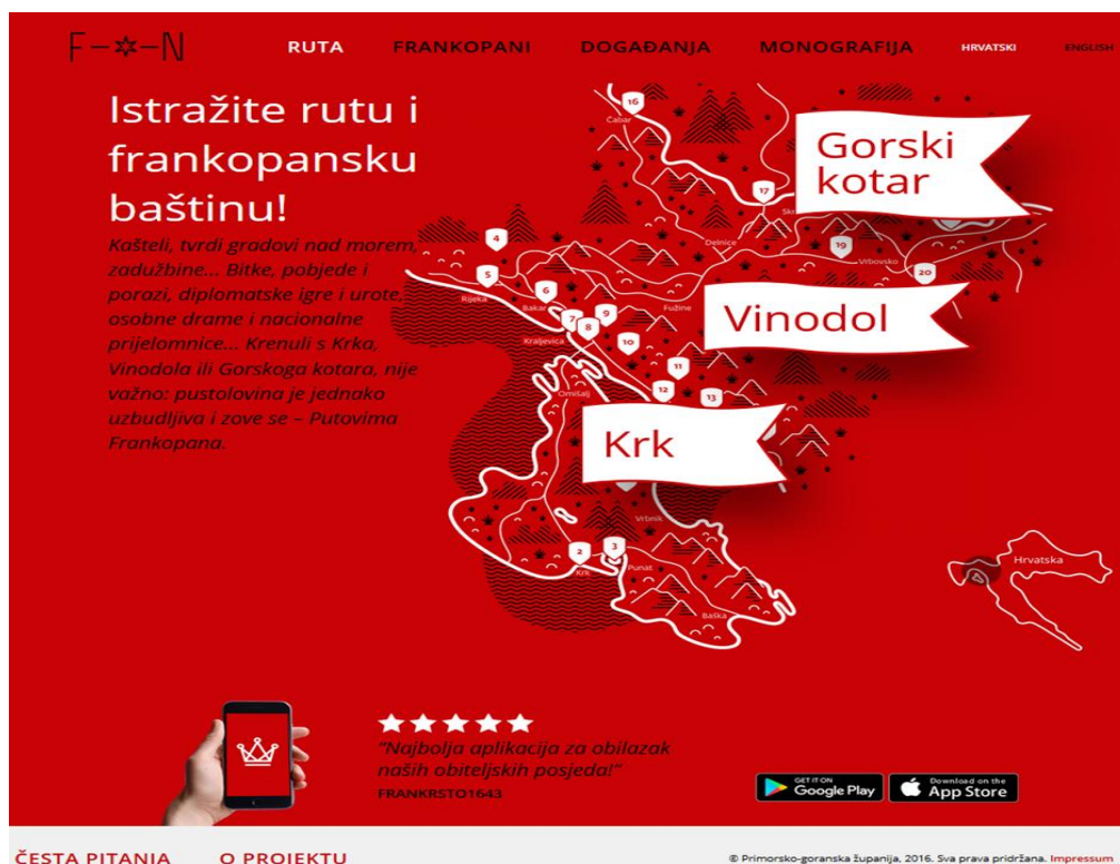
Slika 2. Prikaz kulturno-turističke rute na službenoj internetskoj stranici

Kako se riječ „ruta“ nalazi u nazivu projekta, u sklopu istog napravljena je ruta, odnosno mapirane su lokacije kaštela i sakralnih objekata kako bi se pružio i svojevrsni vizualni vodič potencijalnim posjetiteljima.