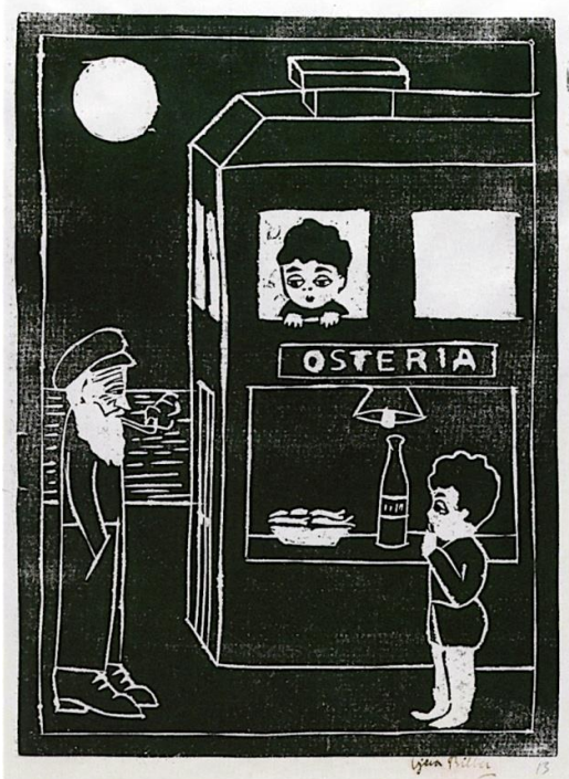
Slika 4. Vjera Biller, Osteria , 1921., linorez, 49.7 × 34.7 cm, Narodni muzej u Beogradu