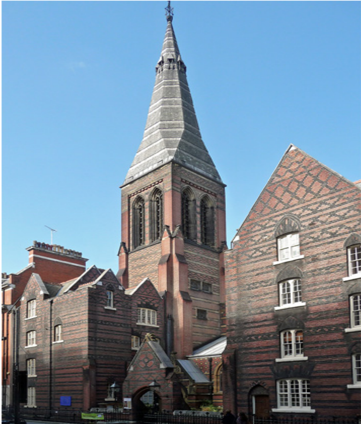
Slika 14: William Butterfield, Crkva Svih Svetih , 1850.-1859., London, Velika Britanija

William Butterfield, inspiriran doktrinama Augustusa Pugina. Crkva je dizajnirana 1850. godine, predstavljena kao „model crkve“, odnosno kao primjer sakralne viktorijanske građevine. Koristi „temporalnu polikromiranost“, postignuta korištenjem crne i crvene cigle. 1