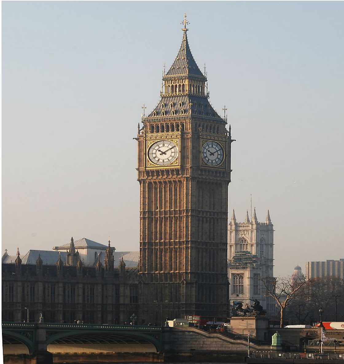
Slika 13: Sir Charles Barry, Toranj svetog Stjepana , (danas poznati kao Big Ben, od 2012. godine nazvan je Elizabetin toranj ), Westminsterska palača, 1840, London, Velika Britanija

suprotno od Barryevog ukusa za ranogotičkim elementima. Pugin je također dekorirao gotički interijer Westminsterske sale. 1