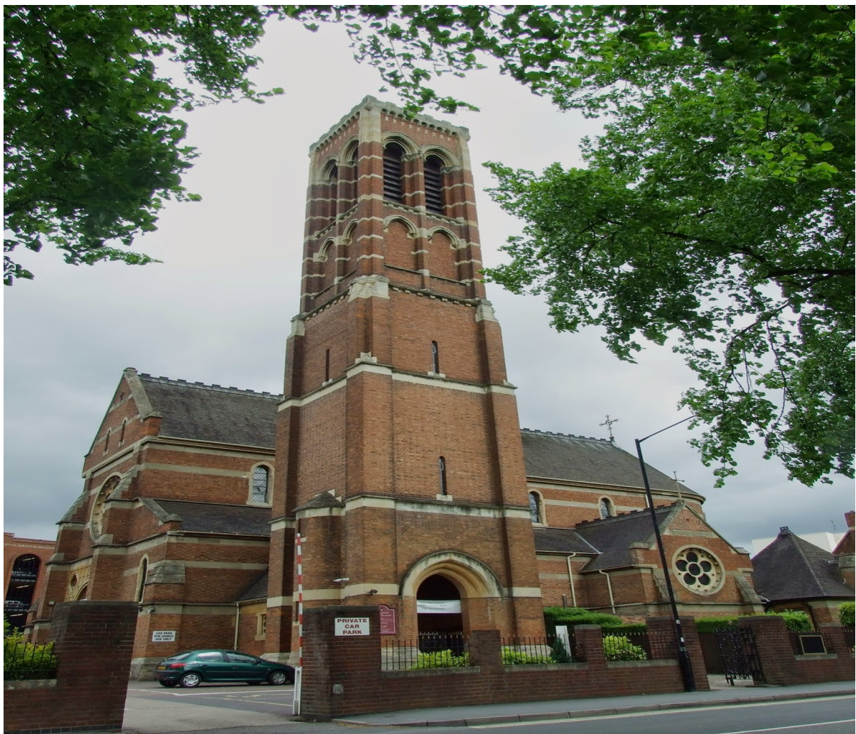
Slika 17: Henry Clutton, Crkva Svetog Petra , 1861.-1865., Leamington, Velika Britanija

toranjem koji se flankiraju u pročelje, a prati gotički model Genove. Efekt polikromiranosti je postignut ponovnim korištenjem crne i crvene cigle, poput crkve Svih Svetih. Zatim crkva svetog Petra, djelo arhitekta Henrya Cluttona, a crkva je nastala između 1861. i 1865.godine u Leamingtonu. 1 Clutton u svome djelu odustaje od karakterističnih artikulacija planiranja od Pugina – brodovi i apside se formiraju od jednog elementa, strogo bazilikalno u efektu, te šiljasti krov koji završava u polukupoli. Inspiracija potječe od francuske gotike, koju opisuje Viollet-le-Duc, začajan teoretičar umjetnosti iz 19.stoljeća u Francuskoj, a poput Ruskina i Pugina u Engleskoj, zalagao se za gotički revival u Francuskoj. 2