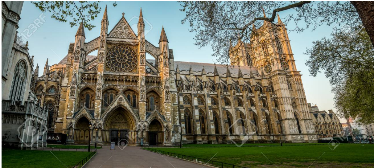
Slika 2: Westminsterska opatija, 960., London, Velika Britanija

Westminsterska opatija, tradicionalna Prema teoriji povijesti umjetnosti, za razliku od mnogih drugih neostilova koji se pojavljuju, neogotika se može podijeliti u dvije faze, koje se razlikuju prema različitim moralnim, intelektualnim i filozofskim aspektima, dok su prema umjetničkim i estetskim aspektima jednake. Te faze nazivaju se primitivna, odnosno rana faza, te viktorijanska gotika, odnosno zrela i ujedno kasna faza. 1 Gotički revival na jasan i reprezentativan način pobuđuje gotičke konstrukcijske, strukturalne i dekorativne principe, poput korištenja šiljastih lukova, naglašavanje vertikalnosti u interijeru i fasadi, veliki otvori s vitrajima, trijemovi, šiljasti krovovi, križno-rebrasti i zvijezdasti svodovi, dekorativna i strukturalna funkcija stupova i rakovice, dok elementi koji se ne pojavljuju su kontrafori, a novi element kojega neogotika uvodi jest dekorirani vijenac koji prati zonu elevacije, lukove i okvire prozora na pročelju, te nalikuje na skulpturalno oblikovanje u visokome reljefu.