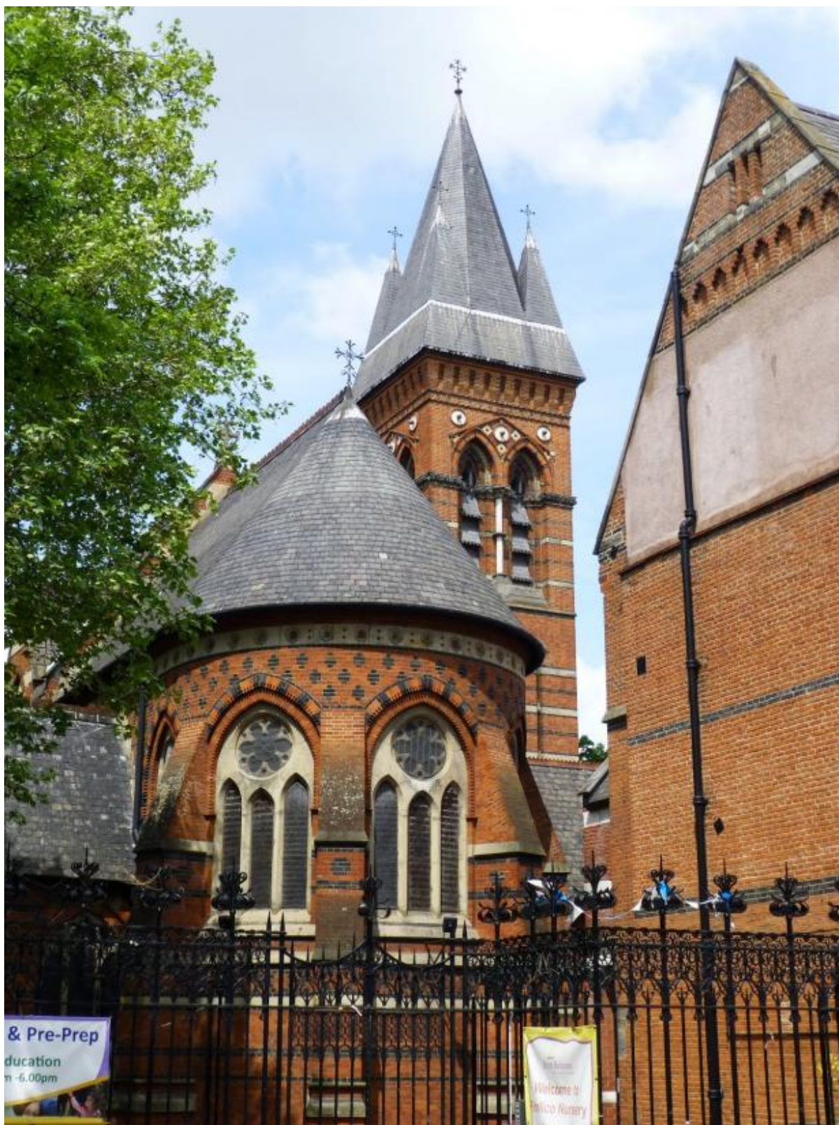
Slika 16: G.E. Street: Crkva svetog Jakova , 1858.-1861., London, Velika Britanija

1860ih godina, razvoj visoke viktorijanske gotike bio je konvergentan. G.E. Street, engleski arhitekt, dizajnirao je crkvu svetog Jakova u Londonu, između 1858. i 1861.godine. Sadrži polukružnu kapelu koja je dekorirana masivnim gotičkim prozorima, te