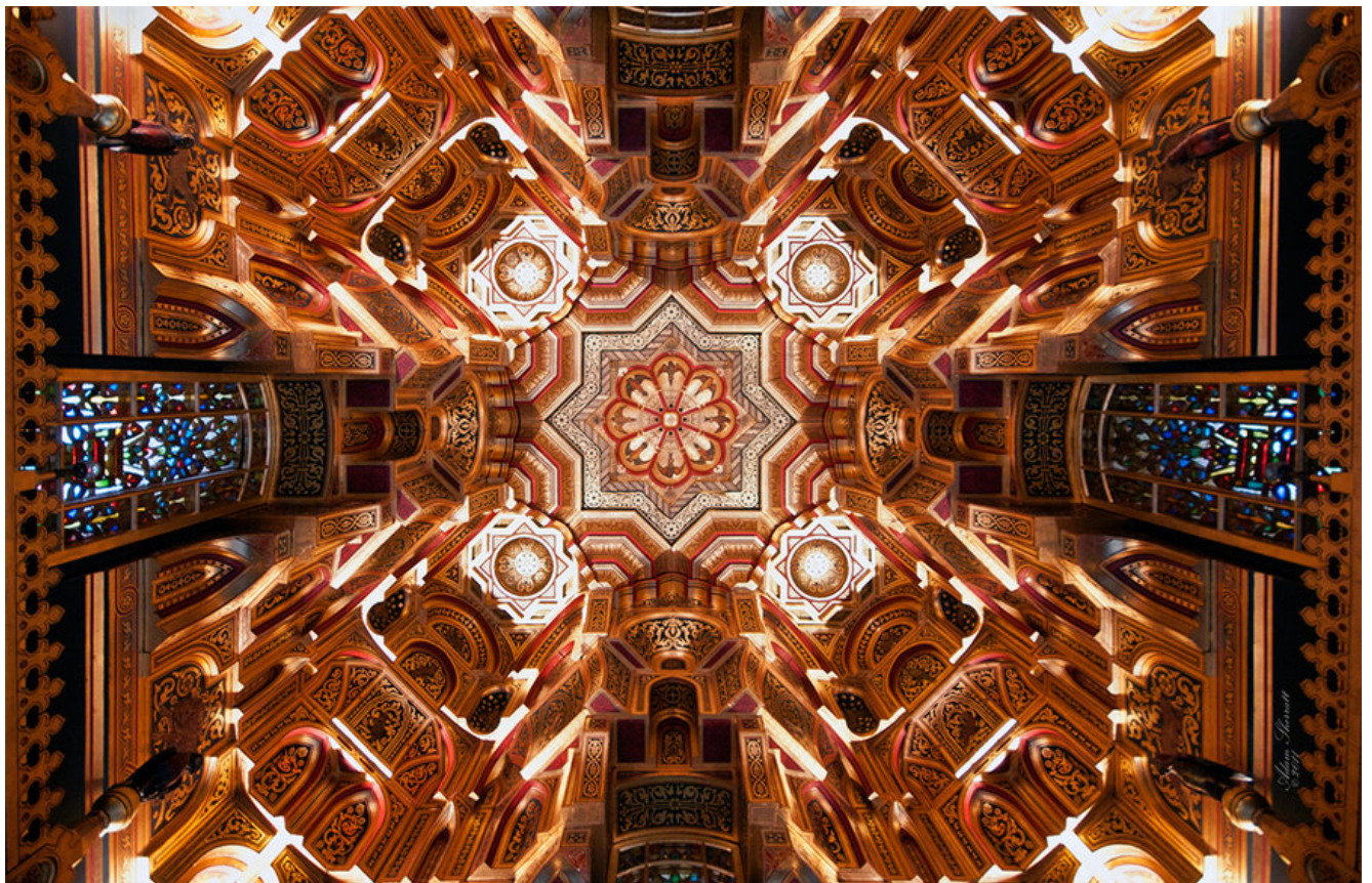
Slika 27: William Bruges, Strop Arapskog tornja , 1865.-1881., Dvorac Cardiff, Wales, Velika Britanija

aspekata. Prema tlocrtu su imale tipični raspored prostorija kakve su imale neke gotičke katedrale, a od namještaja jedino su im nedostajale oltarne pregrade i korske klupe. Što se tiče profalne arhitekture javne i privatne funkcije, bile su najšeće nepravilno, asimetrički postavljene, a dizajn interijera koristi elemente gotike koji se isprepliću sa modernijim, suvremenijim dekoracijama, stoga je više eklektičan u interijeru, s naglaskom na romantizam i piktoralni stil u Engleskoj, a obilježen je duhom koji je želio u interijeru ostvariti dojam srednjovjekovnog vremenskog razdoblja, s mračnijim, prigušenijim svjetlima, knjižnicama, otvorenim trijemovima, porticima, terasama, kasetama, drvenim dekorativnim konstrukcijama itd. 1 Gotički interijer tijekom 18. i 19. stoljeća paralelno će se pojavljivati sa neogotičkim arhitektonskim stilom tijekom 20. stoljeća u ostatku Europe i Amerike.