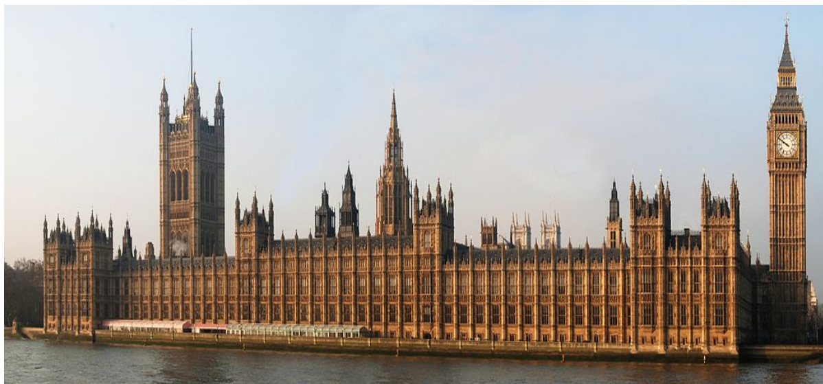
Slika 11: Sir Charles Barry, Westminsterska palača , 1836.-1840., London, Velika Britanija