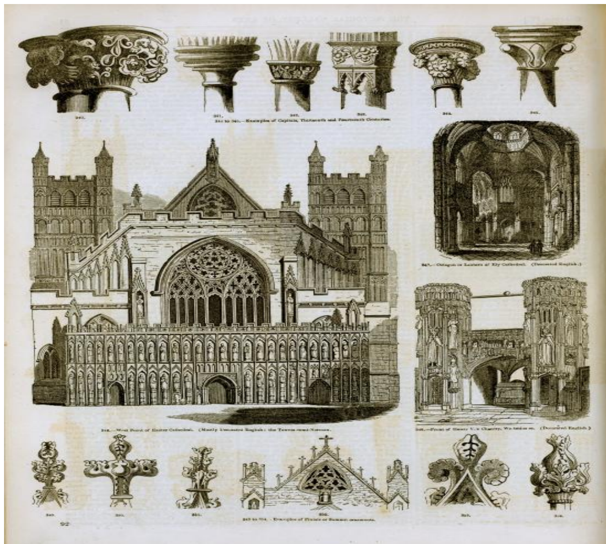
Slika 9: Charles Knight, Ilustracije iz knjige Pictorial Gallery of the Arts , 1858.

primijenjene za razdoblje srednjega vijeka. 1