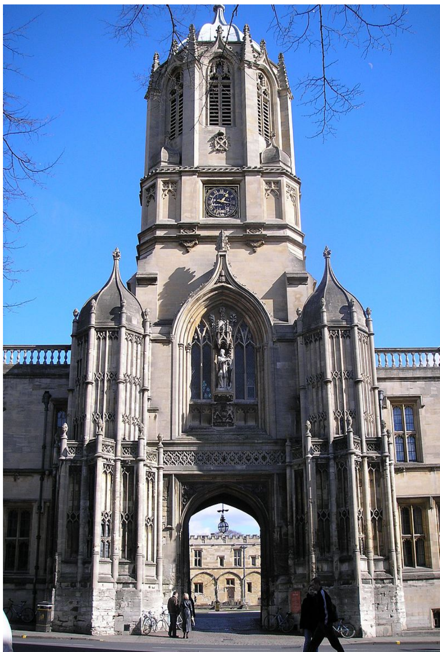
Slika 1: Sir Christopher Wren, Tom Tower , 1681 -1682., Sveučilište u Oxfordu, Velika Britanija