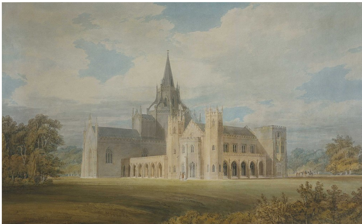
Slika 5: J.M.W. Turner, Fonthill Abbey sa jugozapada , 1799., tempera, Tate galerija, London, Velika Britanija