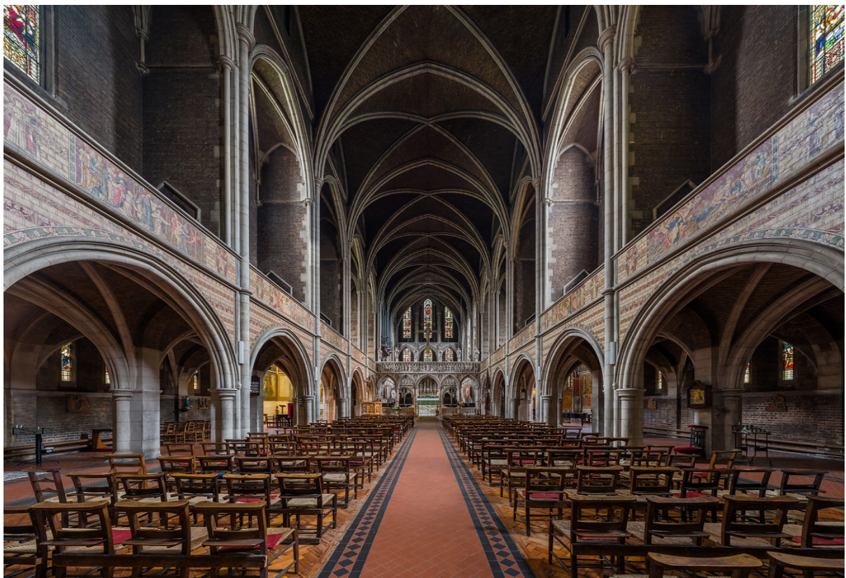
Slika 25: J.L.Pearson, Interijer crkve svete Augustine , 1870.-1880., Kilburn, Velika Britanija