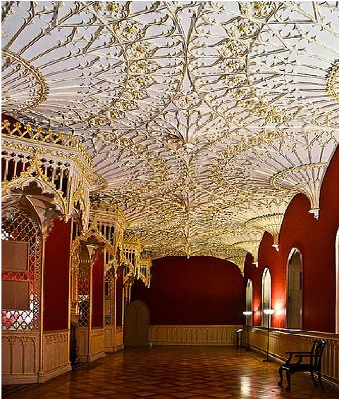
Slika 26: Horace Walpole, Interijer Strawberry hall , 1747.-1776., Twickenham, London, Velika Britanija

interijeru, dok su u Velikoj Britaniji rijedi. 1