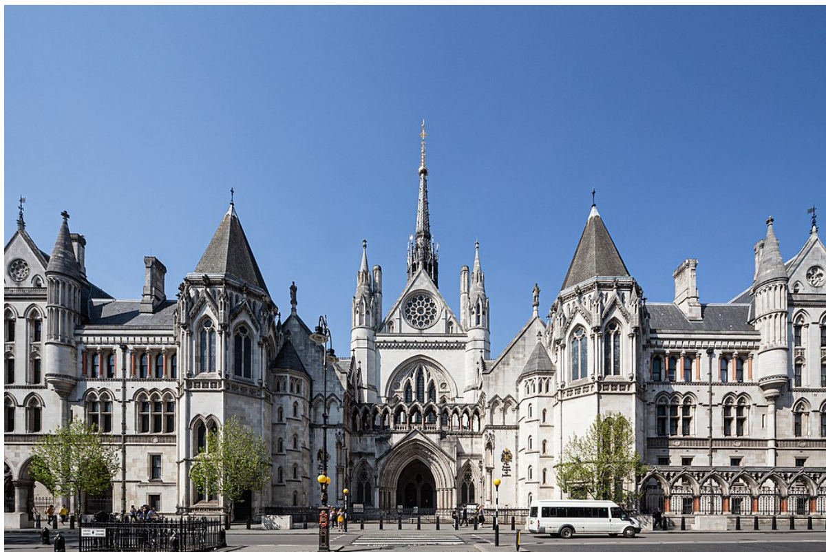
Slika 21: G.E.Street: Kraljevski dvor pravde , 1866.-1882., London, Velika Britanija

50ih godina 19.stoljeća, viktorijanska gotika je postala službenim stilom pri izgradnji sakralnih objekata u Velikoj Britaniji, te se smatrala uvaženom i prihvaćenom u svim arhitektonskim formama i funkcijama. Najzastupljeniji predstavnici jesu Scott i Street, koji su bili vodeći restauratori građevina u gotičkome stilu. Scott ih je restaurirao barem 800, a njegovi prvi radovi bili su Martyrs' Memorial u Oxfordu, Albert Memorial, Hyde Park i mnoge druge. Street, kojega je učio Scott, dizajnirao je oko 260 građevina, a predstavljene su sa dekorativnom polikromijom. 1 Značajna djela su crkva sv. Jakova, te Kraljevski dvori prave