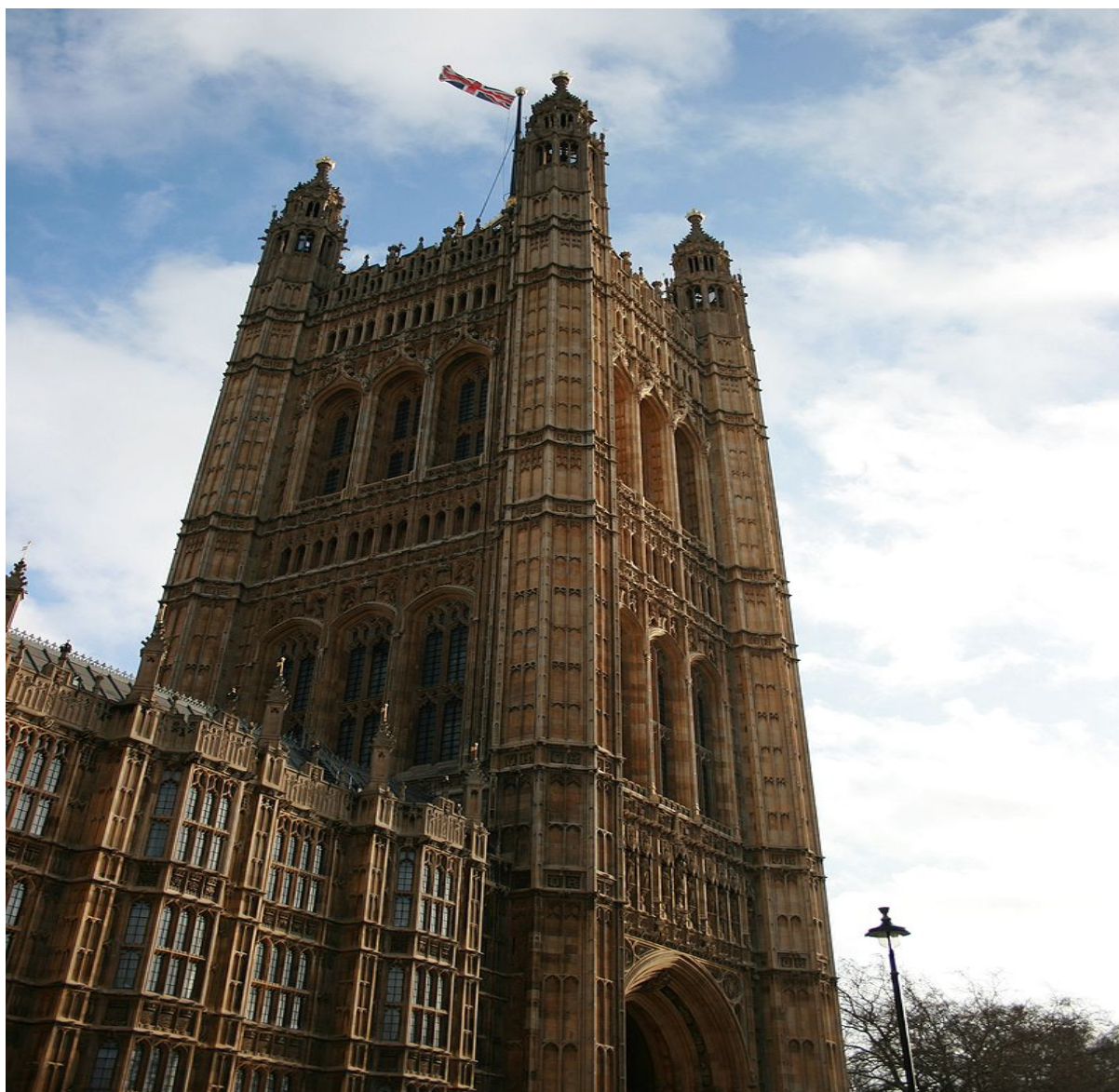
Slika 12: Sir Charles Barry, Viktorijin toranj , nakon 1840., Westminsterska palača, London, Velika Britanija

Odabir Barrya u izgradnji građevine nije slučajna – već je početkom 19. stoljeća eksperimentirao sa neogotičkim stilom u 9 građevina, među kojima su najpoznatije crkva Svetog Petra u Brightonu, Lingvistička škola kralja Edwarda u Birminghamu su jedne od najznačajnijih. Njegov plan Westminsterske palače je formalan, fasada je simetrična, a smještaj uz rijeku Temzu u Londonu probuđuje romantični, piktoralni stil, sa repetitivnih detaljima. Piktoralni efekt, pobuđivanje osjećaja i doživljaja za gotičkim postignuto je postavljanjem i proporcioniranjem dvaju tornjeva, među kojima jedan od njih je toranj svetog Stjepana, odnosno Big Ben toranj, te dodaje i Viktorijanski toranj.