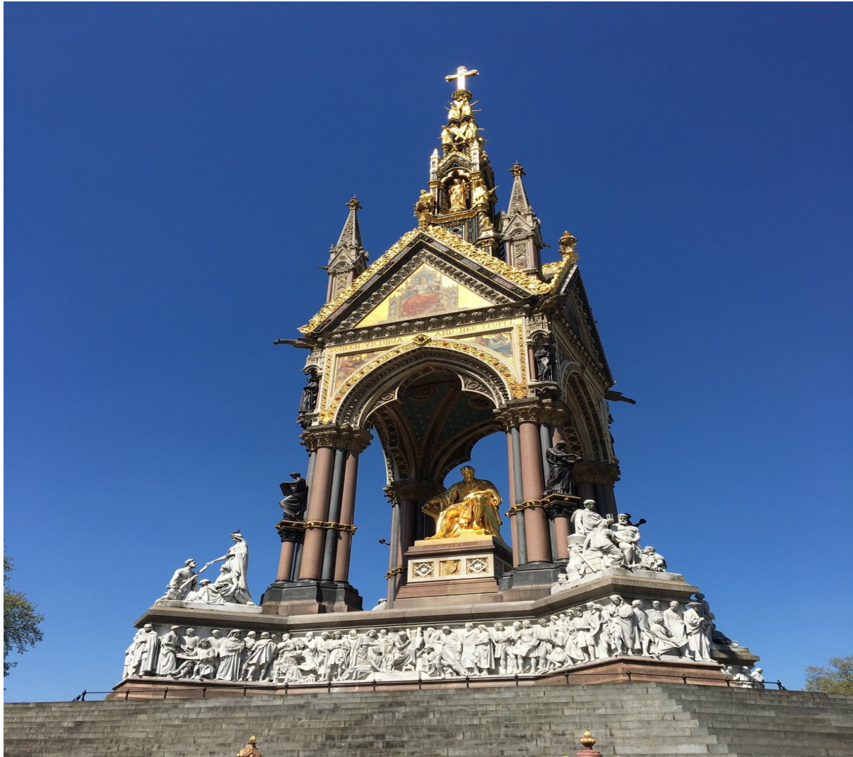
Slika 19: G.G. Scott, Albert Memorial , 1863.-1872., London, Velika Britanija