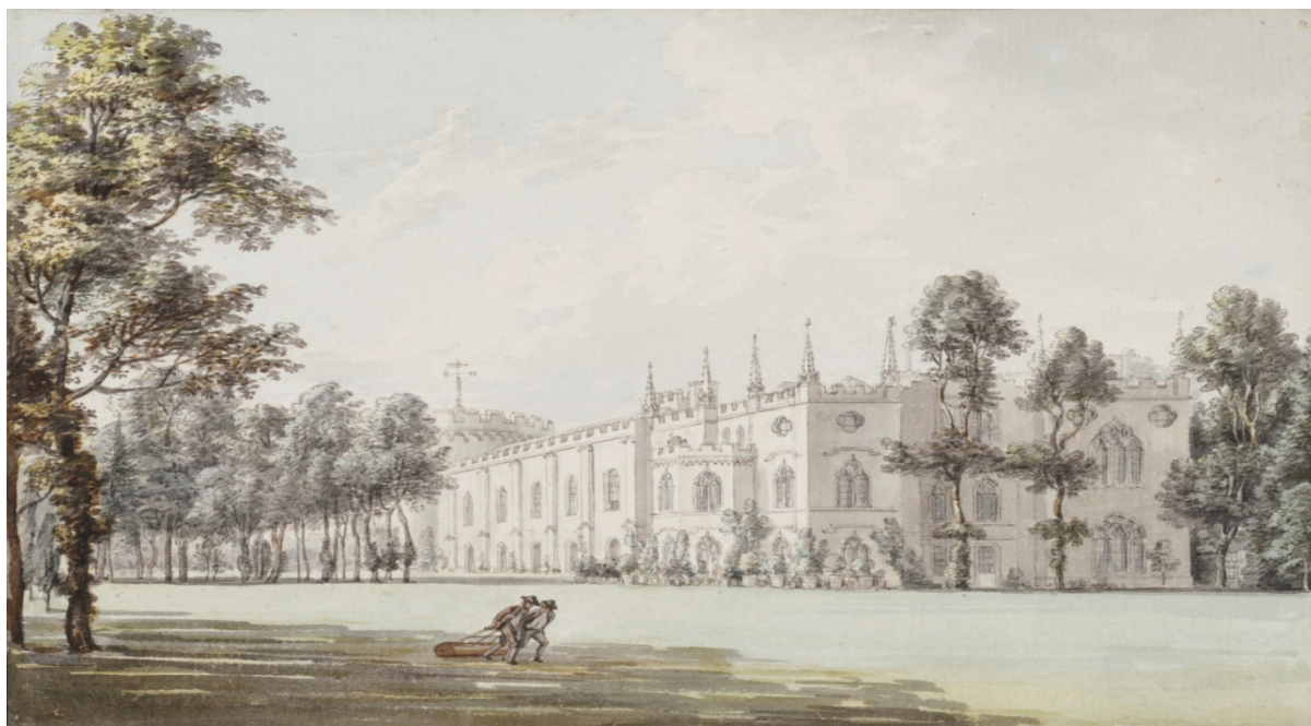
Slika 4: Paul Sandby, Strawberry Hill , 1796., Vodene boje, Victoria & Albert Museum, London, Velika Britanija

Primitivna faza gotike, odnosno rana faza neogotičke arhitekture pojavila se u 18.stoljeću a potrajati će do kraja stoljeća kada će viktorijanska gotika postati jedan od vodećih pokreta u arhitekturi koji će konkurirati sa neogrčkim stilom i ostalim neostilovima u Velikoj Britaniji. 1 Rana neogotička faza karakterizirana je više gotičkim elementima koji u svojoj prvobitnoj namjeni imaju isključivo dekorativnu funkciju, a ne u njihovim strukturalnim i konstruktivnim pristupima. Upravo radi toga razloga naziva je primitivnom gotikom. Obje spomenute građevine – Fonthill Abbey i Strawberry Hill crpe inspiraciju iz gotičkih novela Horacea Walpolea, stoga primitivna gotika svoj izvor nalazi u filozofskim pogledima na gotički stil. 2