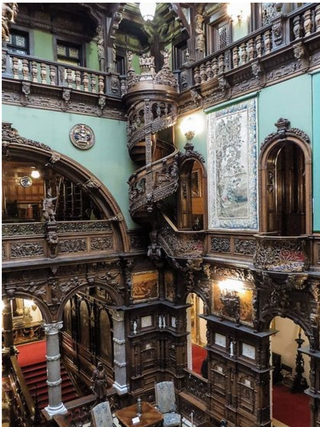
Slika 28: Jedan od primjera gotičkog interijera u stambenom prostoru