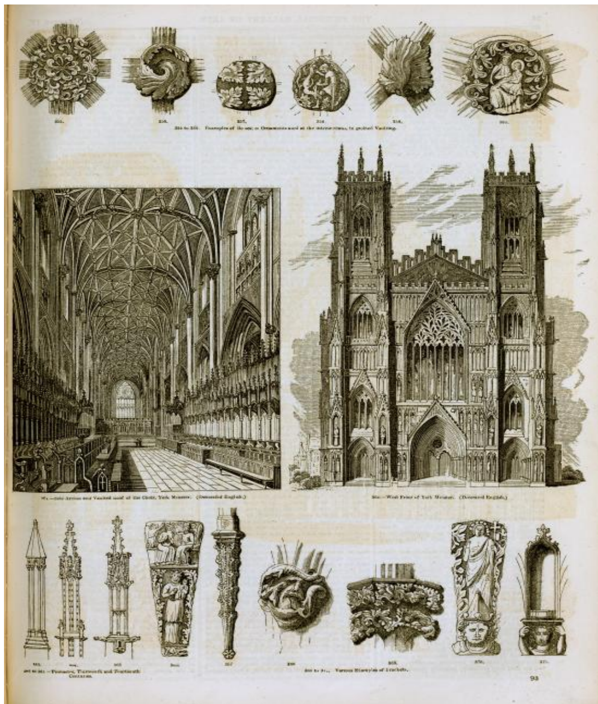
Slika 10: Charles Knight, Ilustracije iz knjige Pictorial Gallery of the Arts , 1858.

Radovi Pugina, kao i radovi ostalih arhitekata diljem Velike Britanije i Europe inspirirani su idejama još jedne ličnosti – Johna Ruskina. U njegovim djelima Sedam svijetiljki arhitekture , a kasnije i djelo Kamenja Venecije , inspiriran je arhitektonskim formama koje je vidio tijekom svojega putovanja u Italiji, partikularno u Veneciji. Ruskin tumači kako je gotička umjetnost najjača forma arhitekture s obzirom na „žrtvovanje“ svakog kamena u detaljiziranju svakog elementa u građevini. 1 Tumači kako je Duždeva palača u