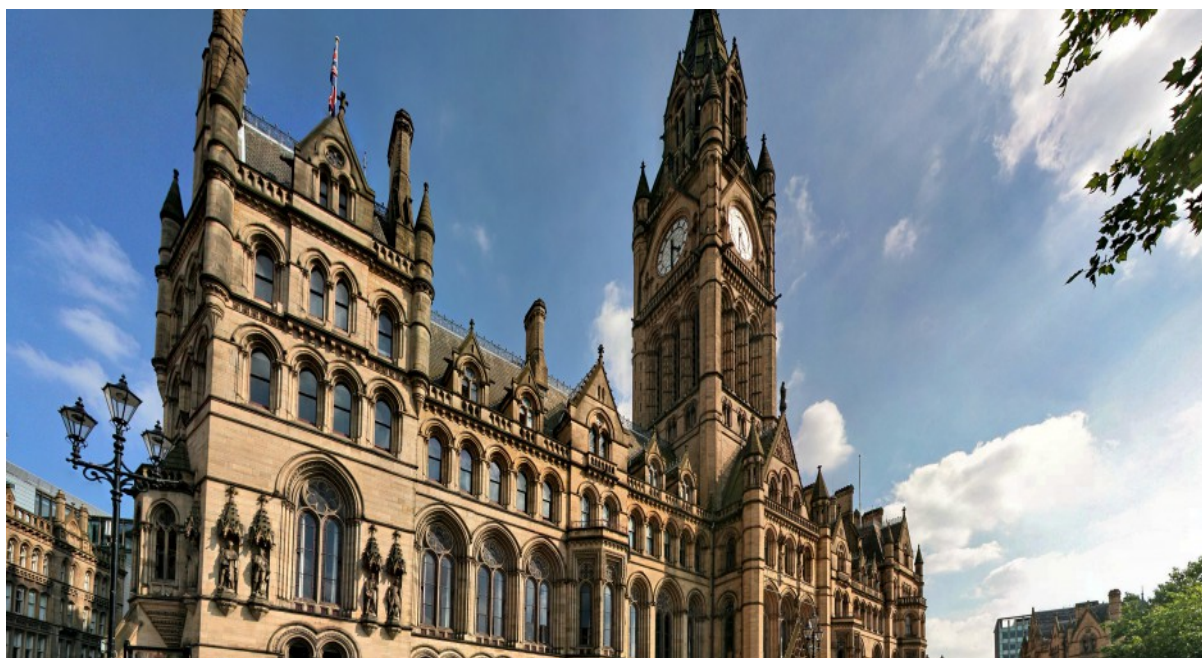
Slika 20: Alfred Waterhouse, Gradska vijećnica , 1869., Manchester, Velika Britanija