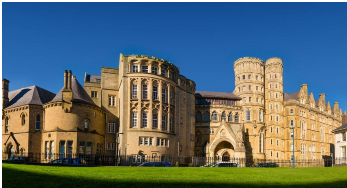
Slika 22: J.P.Seddon, Sveučilište u Aberystwythu , 1864., Aberystwyth, Wales, Velika Britanija