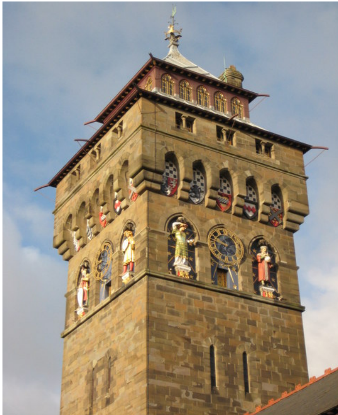
Slika 23: William Bruges, Satni toranj , 1865.-1881., Dvorac Cardiff, Wales, Velika Britanija

arhitekata Scotta i Streeta, a 80ih godina je prosljedila intenzivna industrijalizacija i izgradnja modernijih građevina s upotrebom modernijih materijala i s fokusom na više apstraktnije, internacionalnije oblike gradnje. 1 S intenzivnim eklekticismom u arhitekturi, gubi se konkretan, generalan pojam o arhitektonskome stilu, a viktorijanska gotika još će se primijeniti na Tower bridge u Londonu izgrađenim između 1886. i 1892. godine, no stil viktorijanske gotike će se koristiti u sljedećim godina više u stambene funkcije, u kojima će imati isključivo dekorativnu funkciju, a upotreba stupova, trijemova, šiljastih lukova biti će još u primjeni, dok ostali elementi gotike više će biti korišteni izvan Velike Britanije. Uspostavljanje boljih trgovačkih, ekonomskih i prometnih puteva sa Amerikom, koja je počela veoma gospodarski i politički se razvijati, počinje jače i naglašenije primjenjivati viktorijansku gotiku. Stoga, kada govorimo o razdoblju kasne neogotike, govorimo o neogotici izvan Velike Britanije. 2