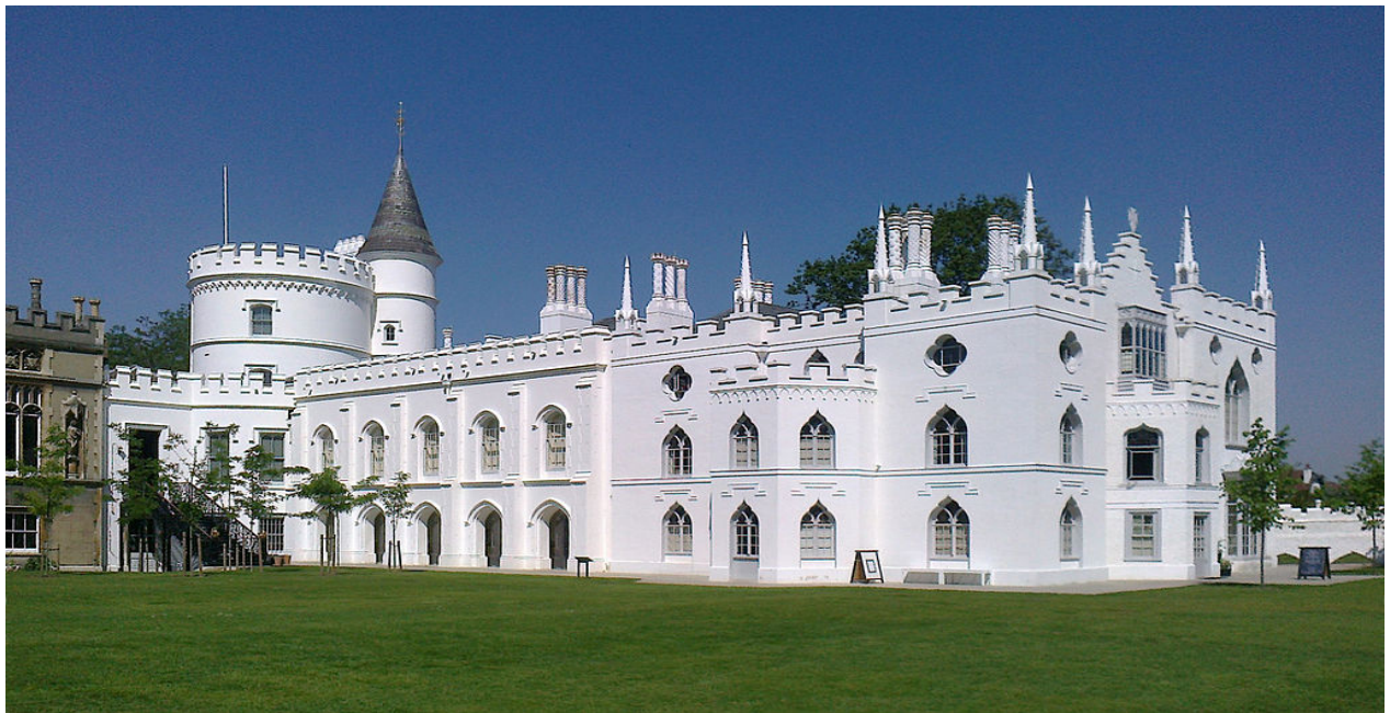
Slika 3: Horace Walpole, Strawberry Hill , 1747.-1776. Twickenham, London

Beckford vraća se natrag u Englesku, gdje je vlasnik Fonthill imanja kojega je naslijedio od oca. 1 Tamo pregrađuje i preuređuje građevinu masivnih zidova, a izgradnju i vođenje cjelokupnog plana konstrukcije predaje svome učitelju arhitekture Jamesu Wyatt, jednim od najuspješnijih arhitekata u kasnijem 18.stoljeću. No projekt gotičke građevine koja u svakome pogledu ima tipične karakteristike gotičke katedrale, poput masivnih arkada, zidova, naglašavanjem visine, šiljastih oštih rebara, uzrokovali su potpuni kolaps u strukturi i konstrukciji građevine u 19.stoljeću. Naime, Beckford je htio visoku građevinu i sa masivnim zidovima nalik onih iz talijanskih gotičkih crkava, s manjim šiljastim otvorima, a u unutrašnjosti s visokim arkadama koje nose izoštrene, izdužene lukove. Takav plan gradnje uzrokovao je strukturani imbalance još i uz korištenje drva štukiranoga na cement, te 1825. građevina se srušila, ostavivši jedino toranj Fontihill Abbeya. 2