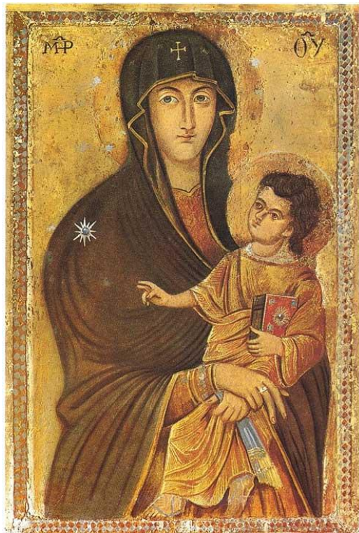
Slika 2. Prikaz ikone Salus Populi Romani