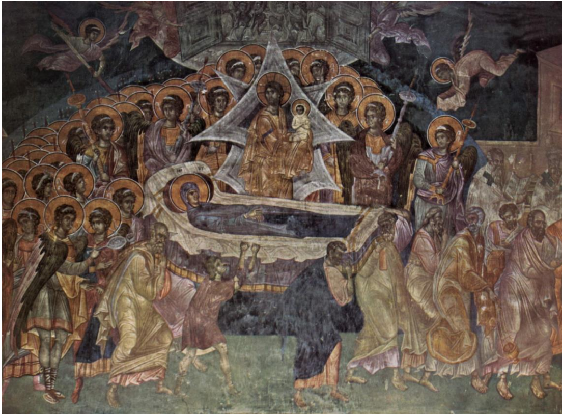
Slika 6. Prikaz Koimesisa u Manastiru Gračanica (Kosovo), 1321. g.