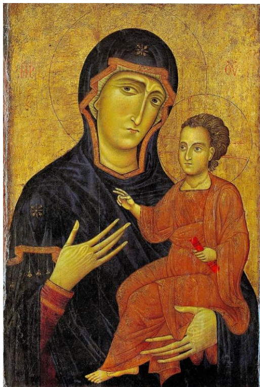
Slika 1. Primjer Hodegetrie

određenog prikaza, stvara vlastitu inačicu Marijina izgleda. Salus Populi Romani postaje rimska/zapadna varijanta originalne slike sv. Luke i postaje iznimno štovana. Istočna ikonografija bila je mjerodavna za Zapadnu sve do pada Carigrada, no unatoč tome ona stvara vlastite varijante marijanske ikonografije.