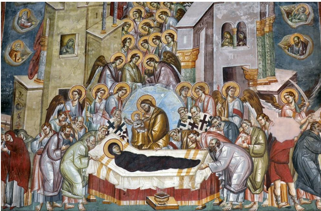
Slika 7. Prikaz Koimesisa u Crkvi sv. Bogorodice u Periveptosu (Ohrid), oko 1300.