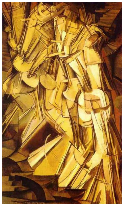
Slika 2.: Marcel Duchamp, Akt silazi niz stepenice br. 2., 1912., ulje na platnu, 147 cm x 89.2 cm, Philadelphia Museum of Art, Philadelphia