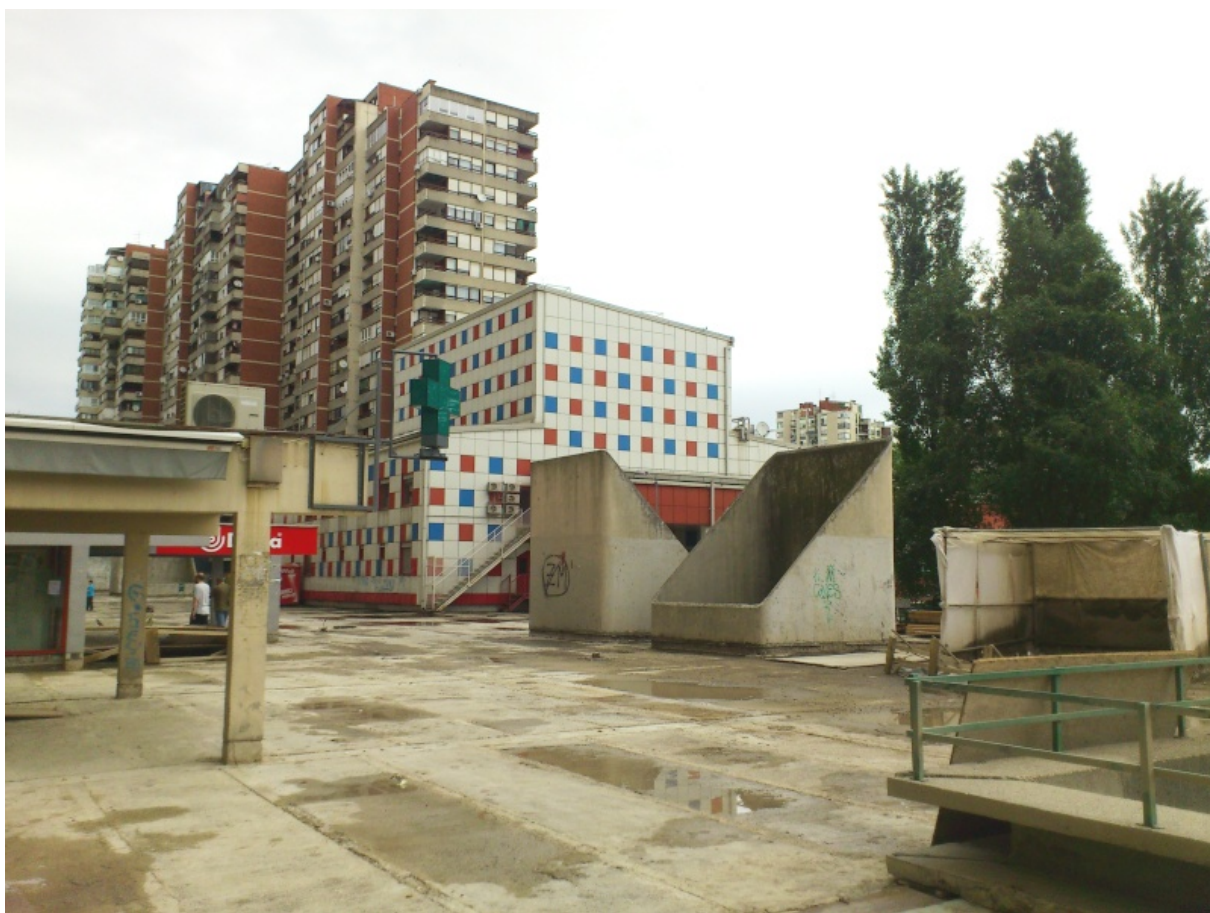
9. Današnje stanje