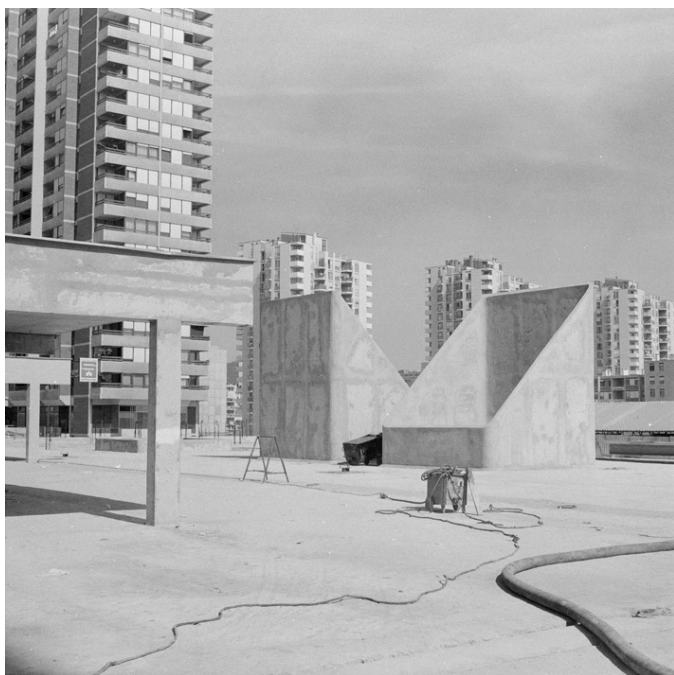
8. Pogled na otvore za ventilaciju podzemnih etaža, 1976. godina