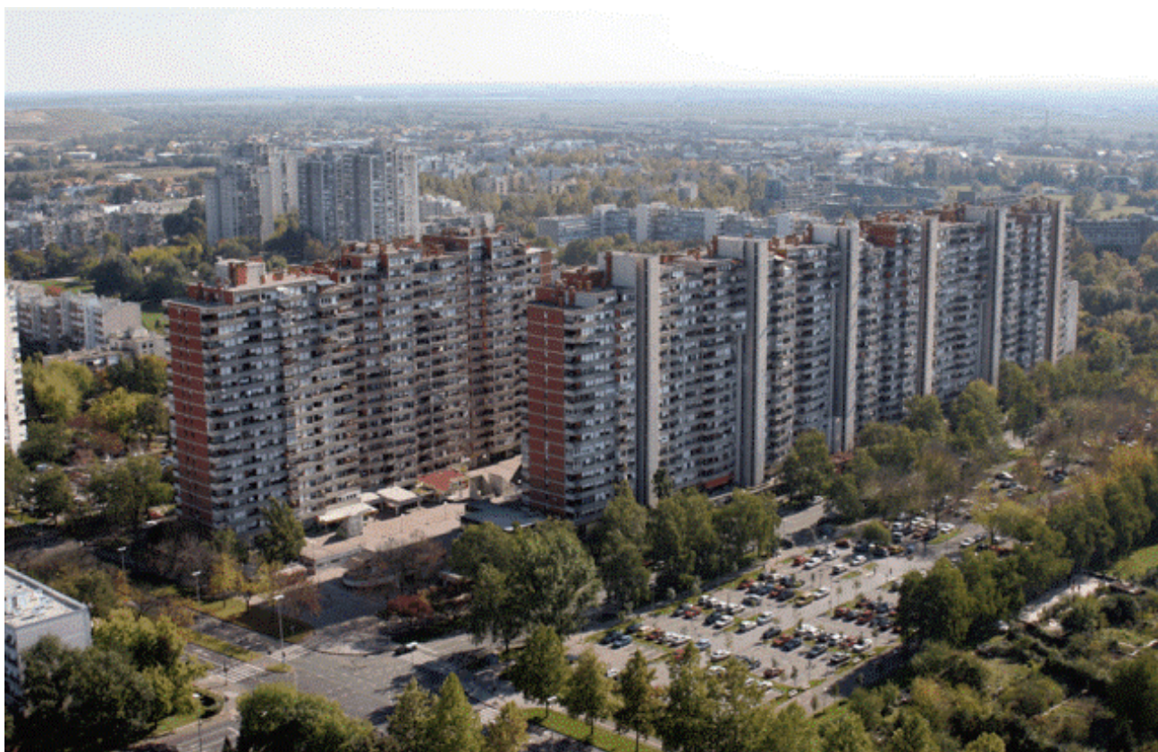
3. Zračni snimak Mamutice iz sjeveroistočnog smjera.