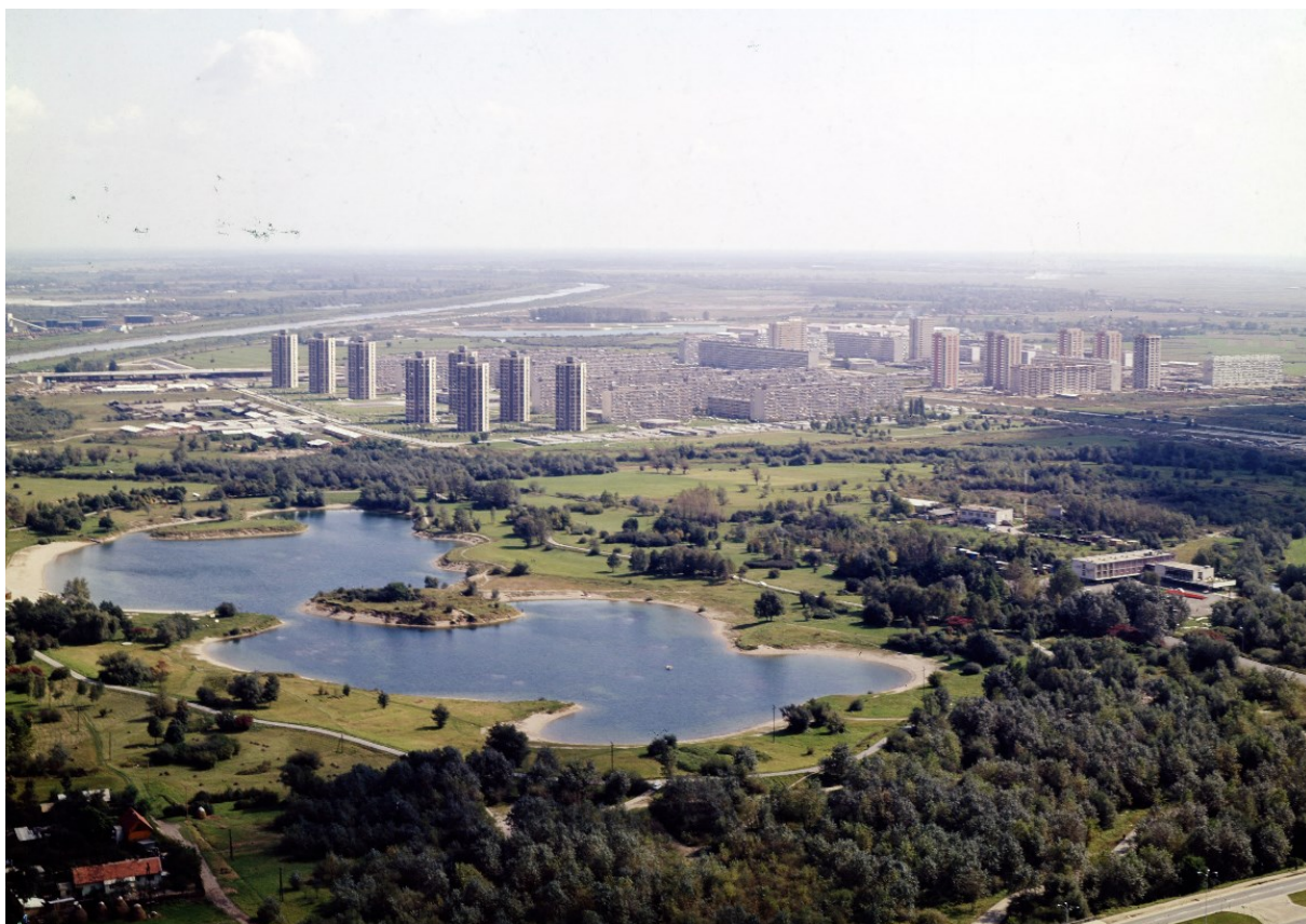
2. Pogled na istočni dio Novog Zagreba, 1960ih. godina s jezerom Bundek.