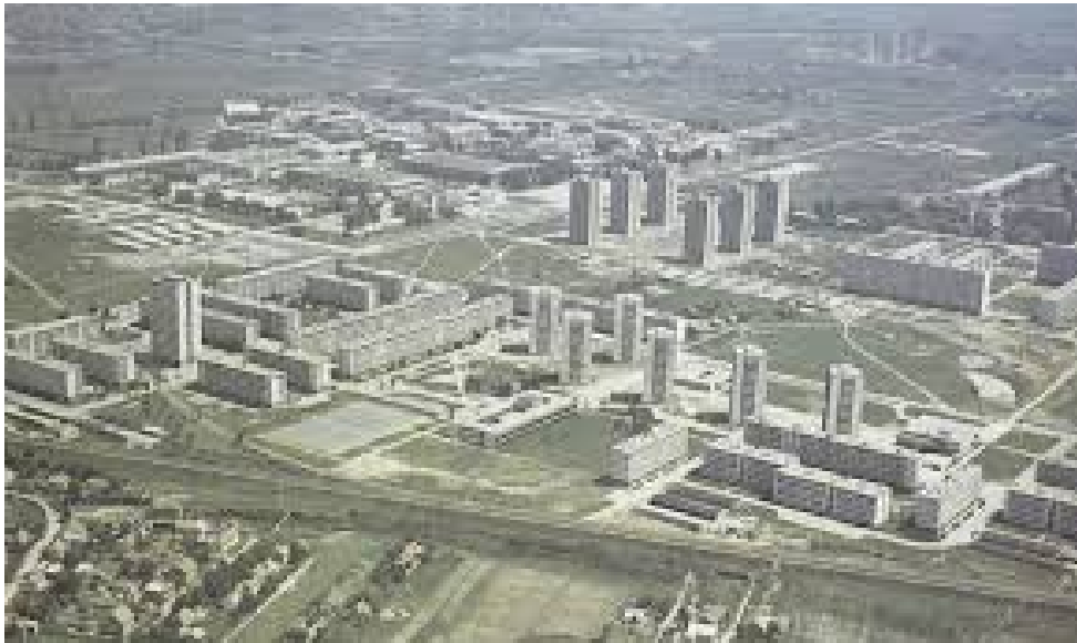
1. Trnsko – jedan od primjera novozagrebačkih mikrorajona, kraj 1960ih.g.