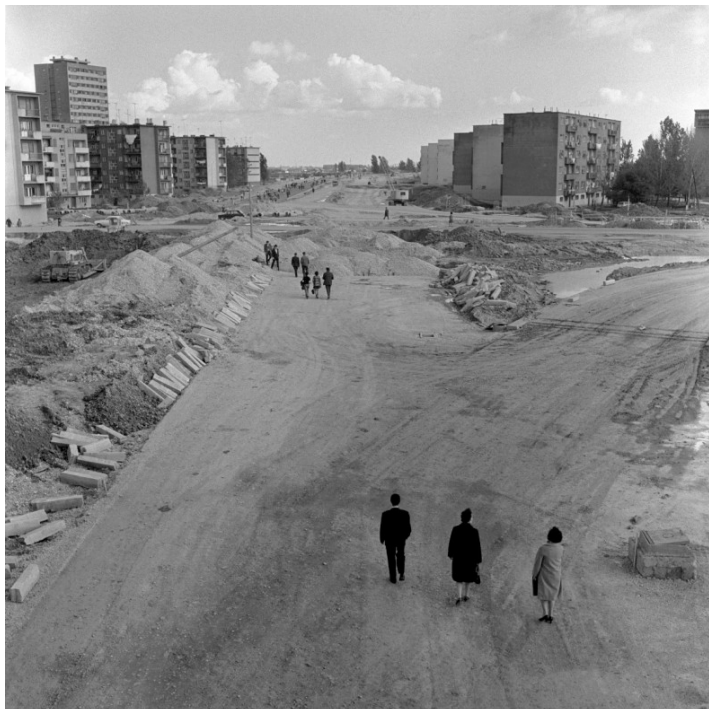
7. Travno 1974. godine , na početku izgradnje naselja.