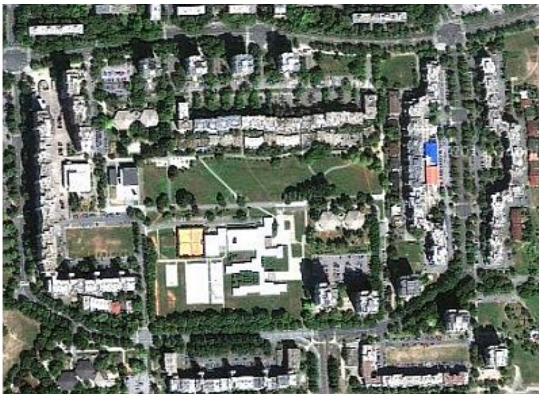
4. Tlocrt naselja Travno, na lijevoj strani fotografije se nalazi Mamutica.