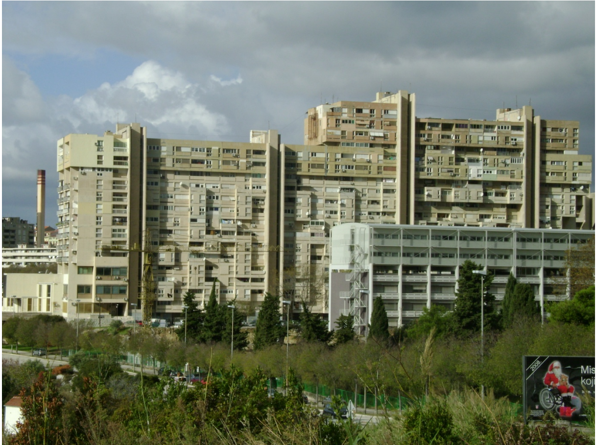
Stambena zgrada u ulici Ruđera Boškovića, „Krstarica“.