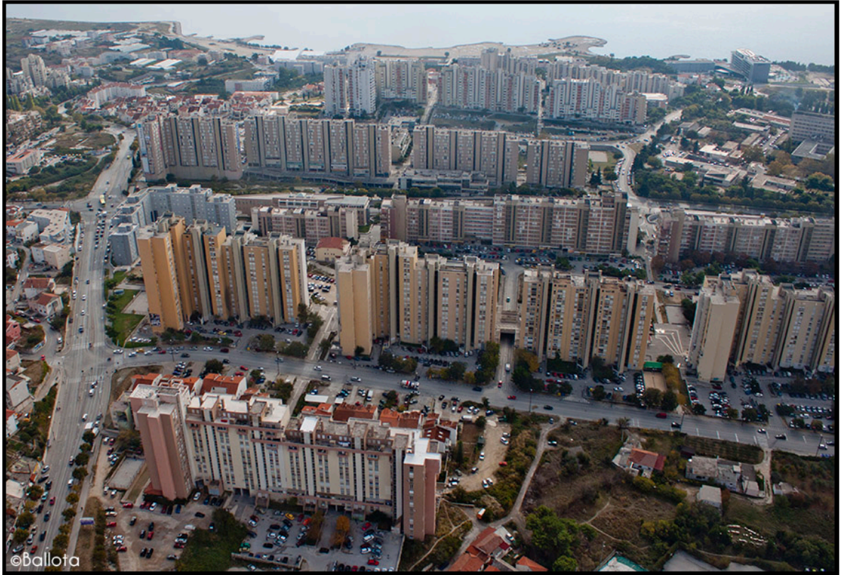
11. Split 3