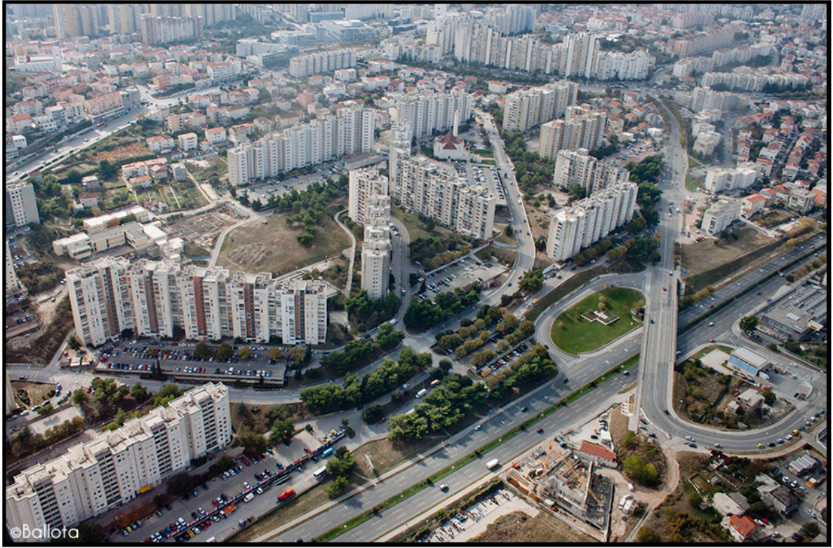
10. Pogled na Split 3