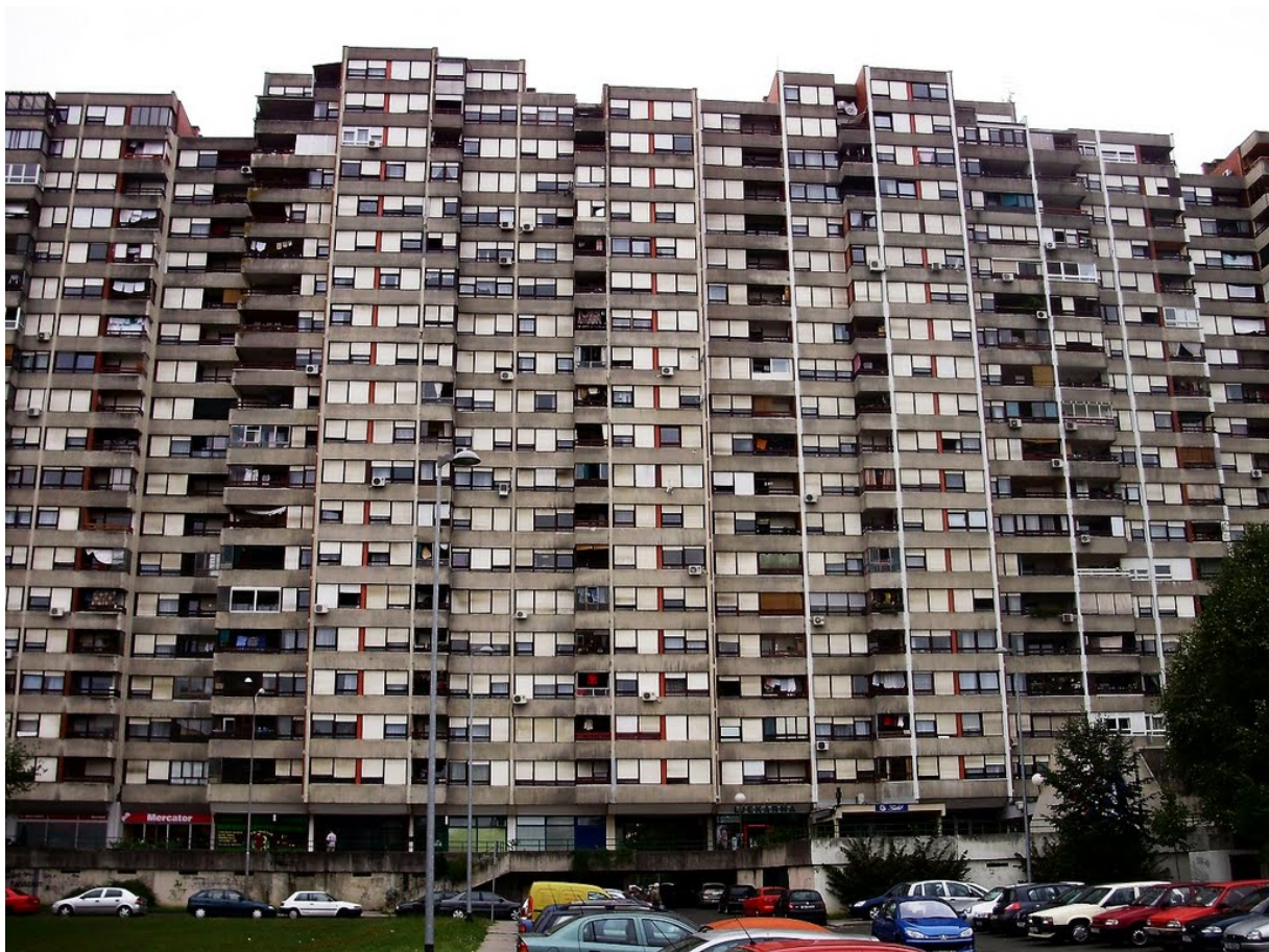
5. Pogled na pročelje u kojemu se vizualno spajaju dva odvojena bloka, na lijevoj strani fotografije.