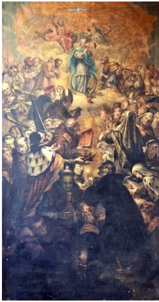
7. Giovanni Battista Augusti Pitteri, Bezgrešno začće sa Svetim Trojstvom i svetcima, crkva Svetog Frane, Zadar

Giovanni Battista Augusti Pitteri, The Immaculate Conception with the Holy Trinity and Saints , St Francis church in Zadar