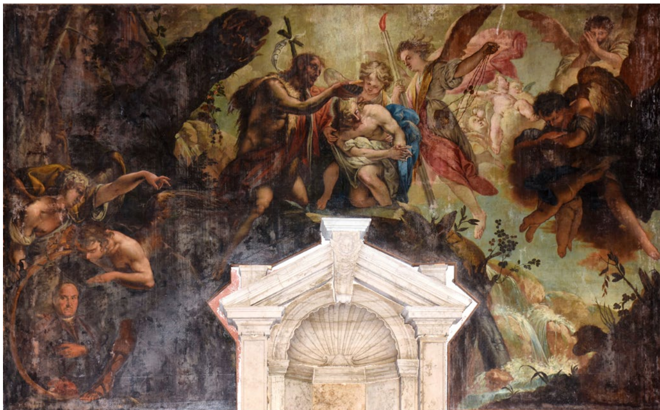
5. Giovanni Battista Augusti Pitteri, Krštenje Kristovo , San Martino, Burano