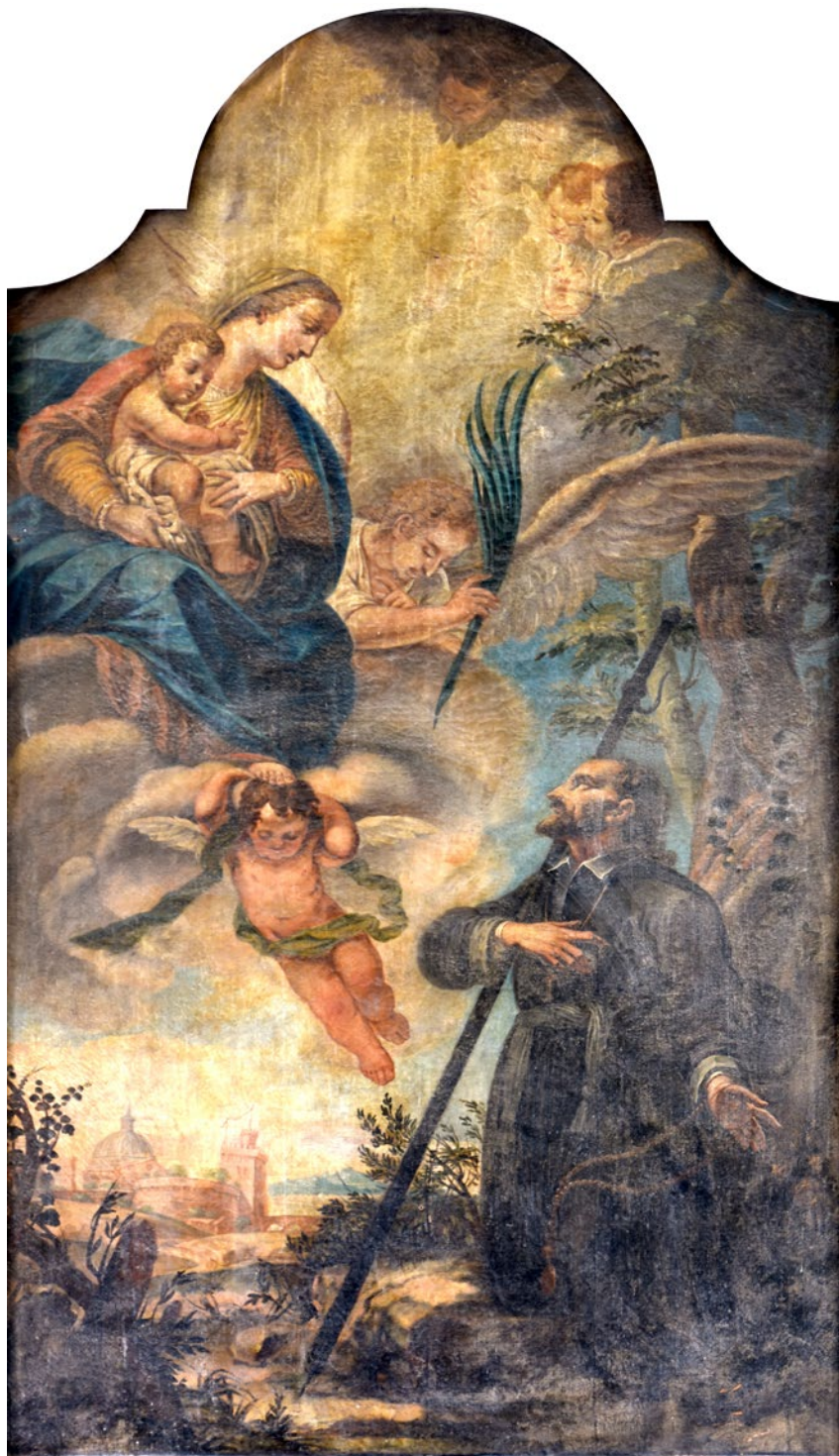
11. Giovanni Battista Augusti Pitteri, Bogorodica s Djetetom i svecem , Majka Božja od Porta, Bakar

imenjaku i zaštitniku na obiteljskom je imanju, tada pod Koparskom biskupijom, dao sagraditi trogirski biskup Jeronim Fonda 1746. godine. Taj je pothvat prelat uvijekovječio svojim grbom te posvetnim natpisom na pročelju (sl. 10). 57 Jeronim Fonda (Piran, 1686. – Trogir, 1754.) školovao se u Padovi, a 1709. zaređen je za svećenika Koparske biskupije. Postao je arhiđakon pulskog kaptola, a 1733. imenovan je ninskim biskupom sve do 1738. godine, kada je premješten na čelo Trogirske