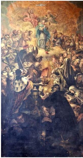
7. Giovanni Battista Augusti Pitteri, Bezgrešno začeće sa Svetim Trojstvom i svetcima , crkva Svetog Frane, Zadar

Giovanni Battista Augusti Pitteri, The Immaculate Conception with the Holy Trinity and Saints , St Francis church in Zadar