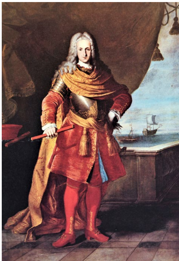
8. Fortunato Pasquetti (?), Portrait of Girolamo Querini , Palazzo Querini Stampalia, Venecija

Fortunato Pasquetti (?), Portrait of Girolamo Querini , Palazzo Querini Stampalia, Venice