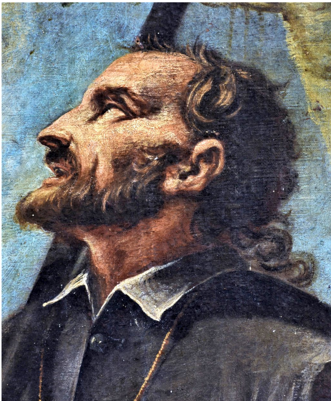
12. Giovanni Battista Augusti Pitteri, Bogorodica s Djetetom i svecem , Majka Božja od Porta, Bakar, detalj

Giovanni Battista Augusti Pitteri, Virgin Mary with the Child and a Saint , Our Lady of Porto, Bakar, detail