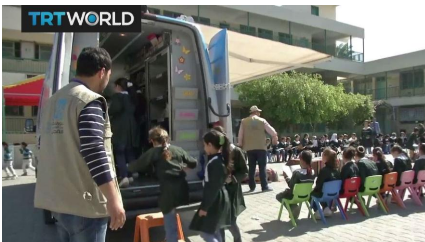
Slika 15. Pokretna knjižnica u Gazi

Rat između Izraela i Gaze uništio je ili oštetiio stotine škola u 2014. Mnogi od tih škola tek se trebaju obnoviti. Dječji centar u Gazi pokrenuo je vrijednu kampanju za poticanje navika čitanja među djecom. Prva pokretna knjižnica Gaze opskrbljena knjigama o najrazličitijim temama obilazi škole u raznim četvrtima kako bi udovoljila želji tamošnje djece za čitanjem. Cilj ovih