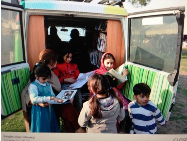
Slika 12. Pokretna knjižnica u Pakistanu.