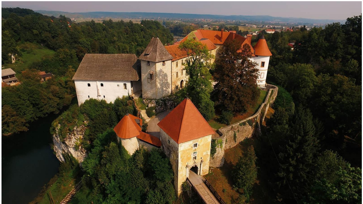
Slika 2. Stari grad u Ozlju

slavne slikarice nalazi se na groblju pokraj crkve sv. Vida u Ozlju. 9