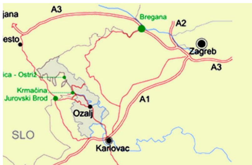
Slika 1. Geografski položaj Ozlja