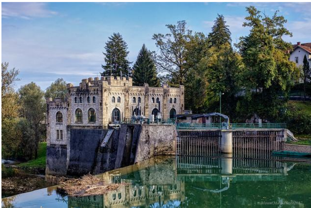
Slika 3. Hidroelektrana Munjara