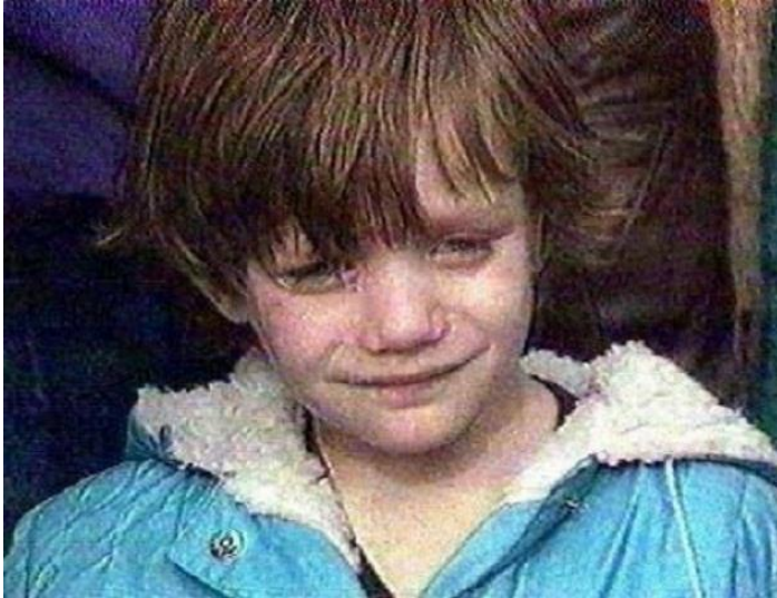
Slika 1. Vukovarska djevojčica u plavom kaputiću