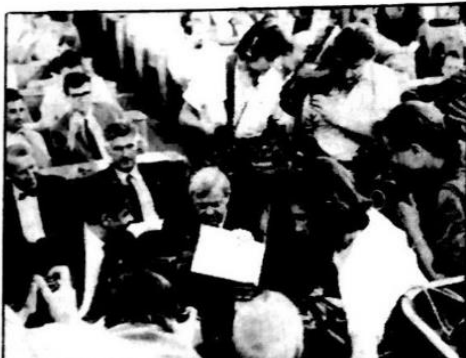
Sa sinoćnje svečane sjednice Skupštine Republike Slovenije – Milan Kučan i Ciril Zlobec na meti fotoreportera

„Samo ukoliko su Slovenci slobodni kao ljudi i kao narod, mogu dati svoj stvaralački doprinos i preuzeti svoj dio odgovornosti za demokraciju i mir u ovom dijelu svijeta“, rekao je Kučan. Prema njegovom mišljenju, nametnuto uređenje i nametnuti odnosi među narodima mogu voditi samo u ne-