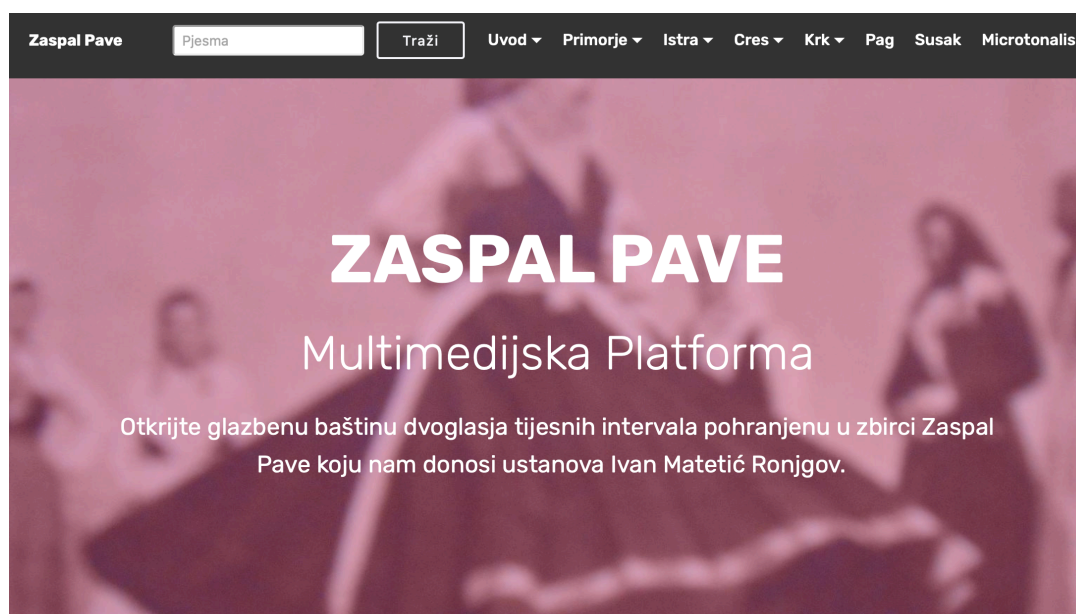
Slika 3. Izgled početne stranice platforme “Zaspal Pave”

Platforma se nalazi na permanentnoj URL adresi http://zaspal-pave.ustanova-imronjgov.hr . Na početnoj stranici u pozadini nalazi se fotografija istarskog narodnog plesa koja etnološki invocira i prati tematiku platforme.