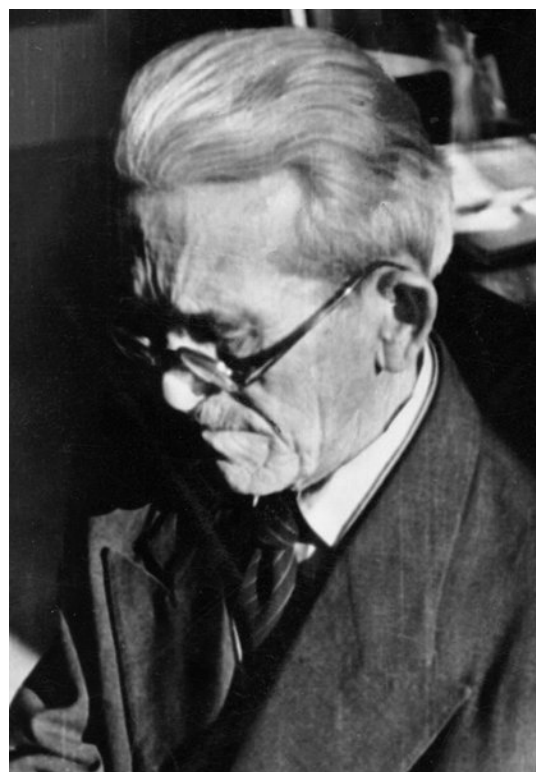
Slika 1. Ivan Matetić Ronjgov

Ivan Matetić Ronjgov rođen je 10. travnja 1880. godine u selu naziva Ronjgi (Prašelj, 1990: 14), koje se nalazi u primorsko - goranskoj županiji. Upravo po imenu sela dobio je nastavak na prezime "Ronjgov". Za vrijeme svog života okušao se u nekoliko poslova. Prvo je kratko vrijeme učio zanat u kovačnici, a potom odlazi u Kopar u učiteljsku školu (Prašelj, 1990: 14). Ondje je stekao temelj znanja koje će kasnije Ronjgov koristiti u svom radu. Već u Kopru prepoznat je njegov glazbeni talent od strane mnogih profesora koji su ga krenuli izučavati u smjeru narodne glazbe. U periodu od 1899. pa do 1912. Matetić djeluje kao učitelj u manjim mjestima, poput Žminja, Kanfanara, Klane i ostalih, a do 1919. počinje predavati u Opatiji, te svoju diplomu konačno stječe na Zagrebačkoj muzičkoj akademiji 1922. (Prašelj 1990: 14). Tijekom čitavog svog rada i obrazovanja Matetić je proučavao tradicionalnu glazbu Istre i Hrvatskog Primorja izučavajući njenu tonsku strukturu. Nakon mirovine, u razdoblju od 1938. do 1945. živio je u Beogradu, a 1946. vraća se u Rijeku gdje kraće vrijeme radio kao honorarni učitelj. Glazbena škola u Rijeci i danas nosi njegovo ime. Tijekom mirovine Matetić je velik dio vremena posvećivao izučavanju tradicionalne glazbe koja je bila glavni fokus gotovo čitavog njegovog života. Uz izučavanje, Matetić se posvetio i komponiranju te melografskom radu. Preminuo je 27. lipnja 1960. (Matetić Ronjgov, 1990: 14).