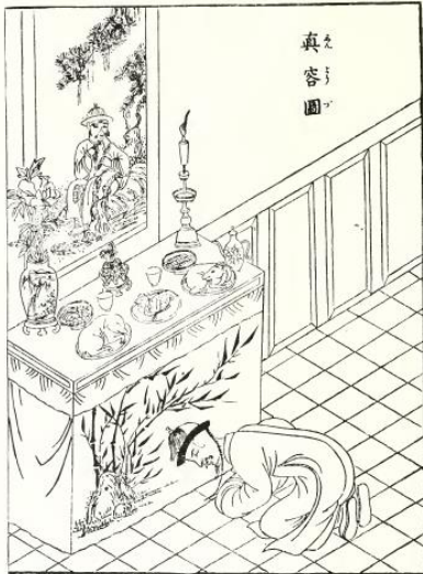
WORSHIPPING THE ANCESTOR OF THE FAMILY ON HIS MEMORIAL DAY. Slika 6. Primjer kućnog oltara predaka 64