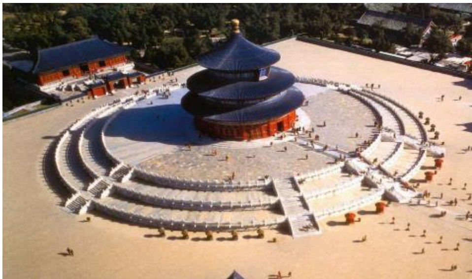
Slika 5. Hram Neba, Peking, Kina 57

U ovome slučaju, kao vladar se najčešće spominje Shangdi 53 kojega se, u vrijeme dinastije Shang (o. 1776. pr. Kr. – o. 1050. pr Kr.) smatralo začetnikom (prvim pretkom) dinastije. Pošto je bio prvi predak, i to predak dinastije, ljudi su ga štovali te eventualno pretvorili u neku vrstu vrhovnog božanstva (kao što na zapadu postoji npr. Zeus). Tijekom dinastije Zhou (o. 1050. pr. Kr. – o. 256. pr. Kr) javlja se naziv Tian 54 koji predstavlja isto, vrhovno božanstvo 55 . Iz ovoga već možemo i zaključiti, da xiao nije ograničen isključivo na žive ljude – tu se pojavljuje ritual štovanja predaka 56 .