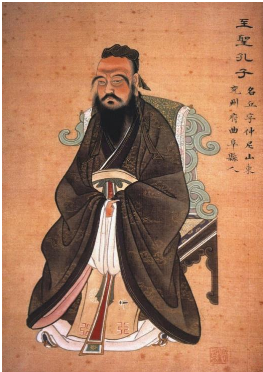
Slika 3. Konfucije 15

vodila uspješnu vanjsku politiku. Svoj je smisao utvrdio u zadaći da pomaže u izgradnji ljudskog poretka u svijetu – smatra da je humanost zajednička odgovornost za stabilno stanje zajednice 14 .