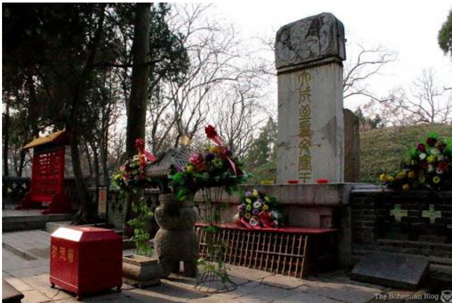
Slika 4. Konfucijev grob 17

Iz ovoga citata vidimo da se već prije početka nove ere Konfucija smatralo nekom vrstom svetog i uzvišenog. Ljudi su ga štovali gotovo kao božanstvo te je, naposljetku, u 20.st time i proglašen.