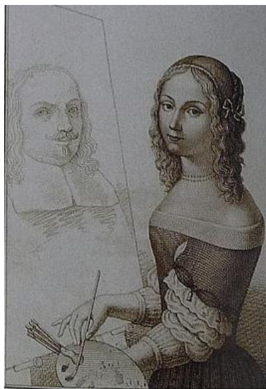
Slika 14. Luigi Martelli, 19. st. prema Elisabetta Sirani, Autoportret na kojem slika oca , Hercolani galerija, Bologna

gotovo 200 slika. 44 Na Autoportretu na kojem slika oca (vidi Slika 14 ) zamjećuju se kist, platno i paleta čime ukazuje na svoju profesiju i ulogu koju kao pojedinac zauzima u društvu.