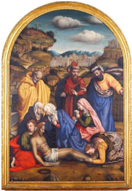
Slika 3. Plautilla Nelli, Oplakivanje Krista , 1550., 288 x 192 cm, Museo Nazionale di San Marco

Norme su dio života Plautille Nelli koja zbog života u samostanu ne nailazi na neodobravanje društva, no u prikazima je inovativna u tome što uvodi ikonografske elemente koji se ne prepoznaju na djelima njezinih muških kolega. Ostvarenom karijerom u pretežno muškoj klimi profesije pokazuje kako se ipak poštivanjem normi i manjim intervencijama na temelju vlastitih shvaćanja u društvu 16. stoljeća emancipira u uspješnu umjetnicu.