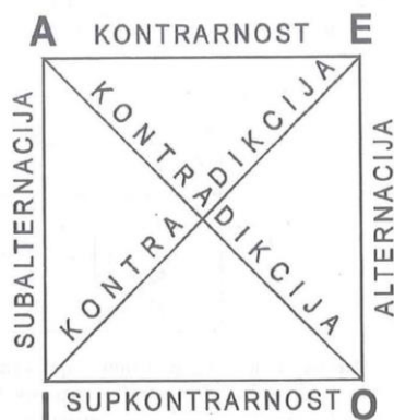
Grafički prikaz logičkog kvadrata preuzet iz Petrović (2011. str. 57)

A i E sud (razlikuju se po kvaliteti) su u odnosu kontrarnosti, što znači da istovremeno ne mogu oba biti istinita, ali mogu istovremeno biti neistinita. I i O sud (razlikuju se po kvantiteti) su u odnosu subkontrarnosti, što znači da oba istovremeno mogu biti istinita, ali nije moguće da su oba istovremeno lažna. Sudovi A i I i sudovi E i O su u odnosu subalternacije (razlikuju se po kvantiteti). A i E (univerzalni sudovi) su subalternirajući sudovi, a sudovi I i O (partikularni) su subalternirani sudovi. Ako je subalternirajući sud istinit, subalternirani sud također mora biti istinit, ali obratno ne vrijedi nužno. Sudovi A i O i sudovi E i I su u odnosu kontradikcije. Odnos kontradikcije je bitan i interesantan za daljnju raspravu o negaciji. Za detaljnije objašnjenje logičkog kvadrata vidjeti: Petrović (2011.), Kovač (2010.).