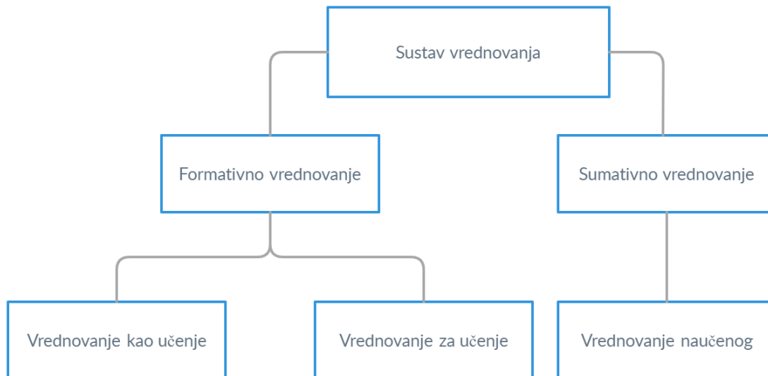
Slika 1. Sustav vrednovanja

U Ujedinjenom Kraljevstvu i SAD-u provedena su brojna istraživanja o unaprjeđenju formativnog vrednovanja, odnosno vrednovanja za učenje. Mnoga od njih spomenuta u ovom radu, objavljena su u časopisu Assessment in Education: Principles, Policy & Practice 1 . U hrvatski obrazovni sustav taj je koncept implementiran po uzoru na prakse u inozemstvu, stoga pristupi vrednovanje kao učenje, vrednovanje za učenje te vrednovanje naučenog i njihovi mogući modeli nisu dostatno teorijski razrađeni u hrvatskoj dokimološkoj literaturi. Osim toga, učinkovitost predloženog koncepta vrednovanja u hrvatskom školstvu nije ispitana, s obzirom na to da je Školom za život tek implementiran. Važno je napomenuti da ti pristupi vrednovanju podrazumijevaju mnoge metode vrednovanja koje su u nastavnoj praksi već poznate. Smještanjem tih metoda pod zajedničke nazivnike upotrebljavajući navedena tri termina, omogućeno je veće usmjerenje i poticaj na formativno vrednovanje i alternativne oblike vrednovanja, a to doprinosi osvješćivanju povezanosti procesa vrednovanja, učenja i poučavanja.