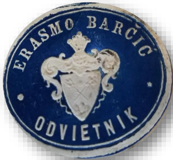
Fotografija 1. Odvjetnički žig Erazma Barčića, Hrvatski državni arhiv, Rijeka

Thierryja, koji je zastupnik imetka po stečaju, zanatlije Stefana Pasquana s Podvežice. 17 Također, nekolicina spisa koja je dostupna u Državnom Arhivu Rijeka, HR-DAR-406, jedinica 249 omogućila nam je da poblize upoznamo odvjetnika Barčića, odnosno da dobijemo pregled odvjetničkog posla kojim se bavio u Rijeci. Iz spomenutih spisa vidljivo je da je Erazmo Barčić često zastupao stranke u slučajevima nasljedstva, dugovanja i međusobnim sporovima pojedinaca gdje su bile prisutne najčešće optužbe za klevetu. 18