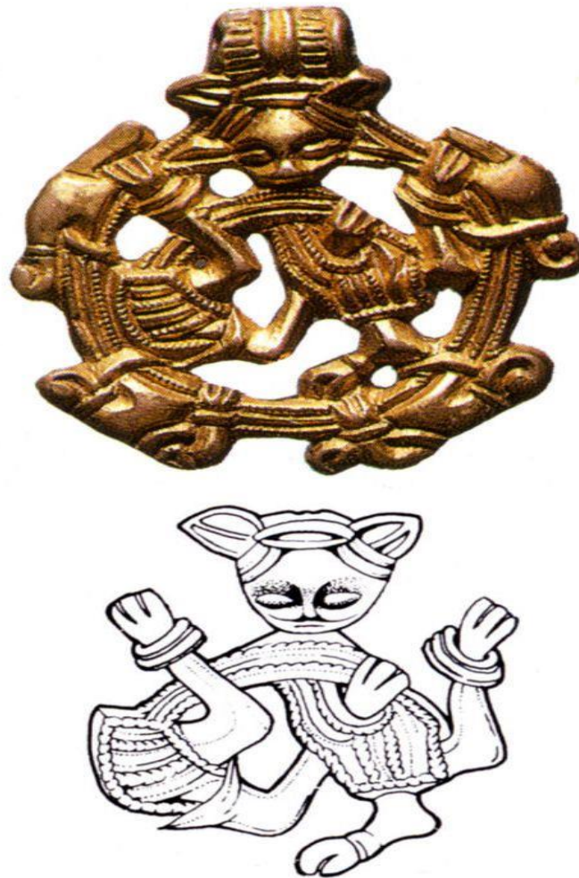
Slika 3. Prikaz životinjskog motiva, tzv. hvatajuće zvijeri u Borskom stilu

Usporedno s razvojem umjetničkih stilova, nastajale su i lokalne varijacije, primjerice na otoku Gotlandu, gdje je u umjetničkom izražavanju prevladavala slikovna umjetnost na kamenu. Jedan od memorijalnih kamena pronađenih u Gotlandu, prikazuje poginulog ratnika koji jaše prema Vallhali. Tipičan prikaz figuralne umjetnosti koja je najzastupljenija na otoku Gotlandu, je kamen iz Lärbroa s prikazom gotlandske aristokracije. U vrijeme nastanka ovog memorijalnog kamena njegova svrha je bila prikazati uobičajeni amblem aristokracije – brod, odnosno, osnovna smisao je bila dočarati herojsku smrt na bojištu i putovanje prema Valhali. 156