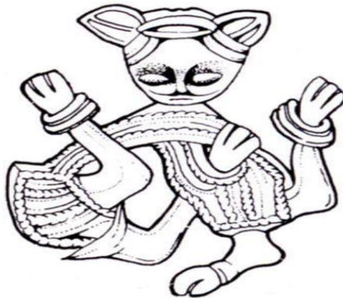
Slika 3. Prikaz životinjskog motiva, tzv. hvatajuće zvijeri u Borskom stilu

Usporedno s razvojem umjetničkih stilova, nastajale su i lokalne varijacije, primjerice na otoku Gotlandu, gdje je u umjetničkom izražavanju prevladavala slikovna umjetnost na kamenu. Jedan od memorijalnih kamena pronađenih u Gotlandu, prikazuje poginulog ratnika koji jaše prema Vallhali. Tipičan prikaz figuralne umjetnosti koja je najzastupljenija na otoku Gotlandu, je kamen iz Lärbroa s prikazom gotlandske aristokracije. U vrijeme nastanka ovog memorijalnog kamena njegova svrha je bila prikazati uobičajeni amblem aristokracije – brod, odnosno, osnovna smisao je bila dočarati herojsku smrt na bojištu i putovanje prema Valhali. 156