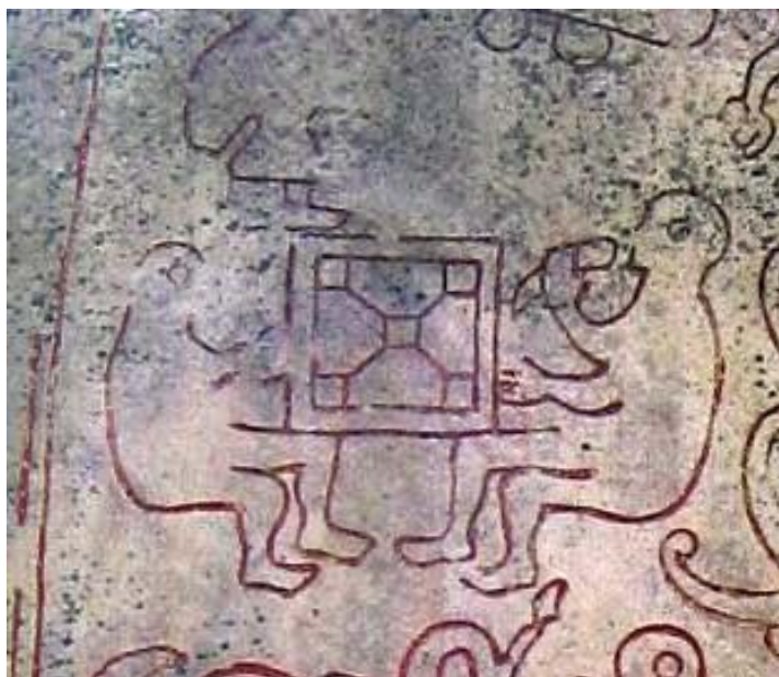
Slika 2. Prikaz dvojice muškaraca koji igraju igru na ploči, moguće hnefatafl (runski kamen iz Ockelboa, Švedska)