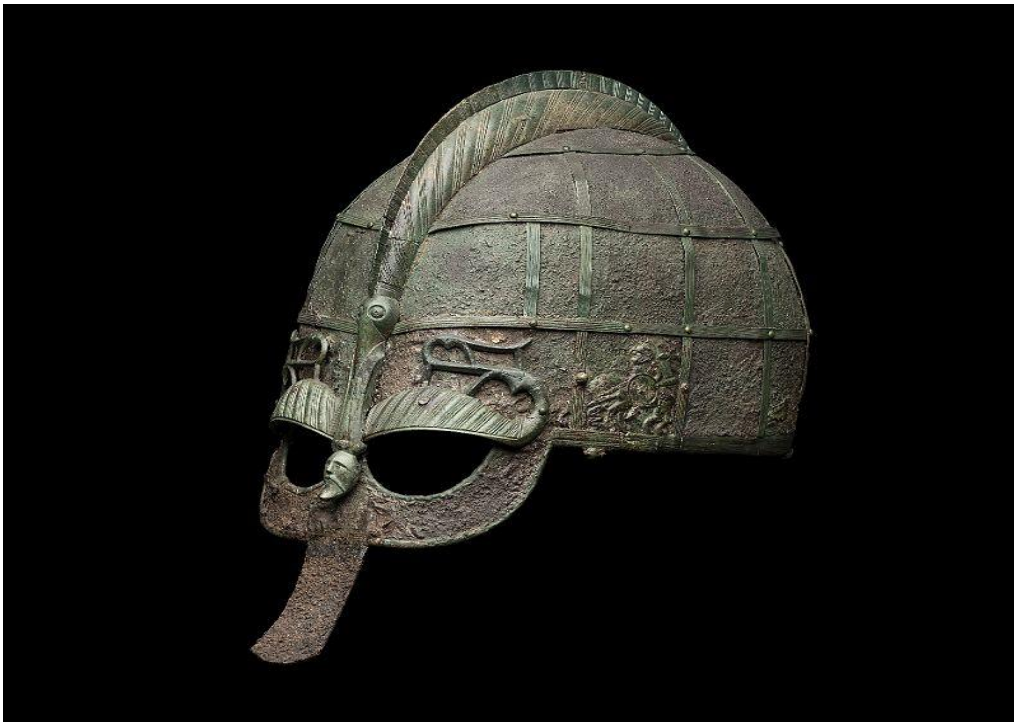
Slika 1. Željezna ratnička kaciga iz 7. stoljeća s brončanim ukrasima pronađena u grobu u Vendelu

Početak vikinškog doba nije bio obilježen naglim prelaskom na novi način života. Dapače, Vikinzi su već generacijama harali i trgovali, no ono što se promijenilo 793. godine, napadom na Lindisfarne, je učestalost tih napada. 13 Ovo je privuklo pažnju ostatka Europe, koji je tada na Sjever počeo gledati kao na zemlju barbara. Za samu Skandinaviju osvajački pohodi su bili od velike važnosti, ne samo zbog bogatstva koje su Vikinzi donosili pri povratku u domovinu, nego i zbog opticaja novca, točnije kovanica i srebra. Vikinški pohodi i trgovina krznom utjecali su na razvoj trgovinskih aktivnosti i gradskih središta poput Hedebyja i Birke. 14 S nastajanjem gradova i jačanjem moći vladara mijenjaju se hijerarhijski odnosi u društvu.