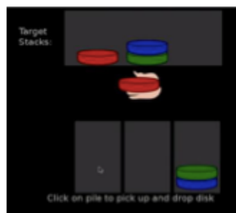
b) Podizanje diska