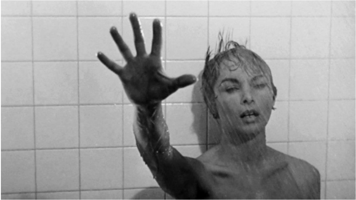
Slika 7. Kultna scena pod tušem, originalna Hitchcockova verzija (1960.)