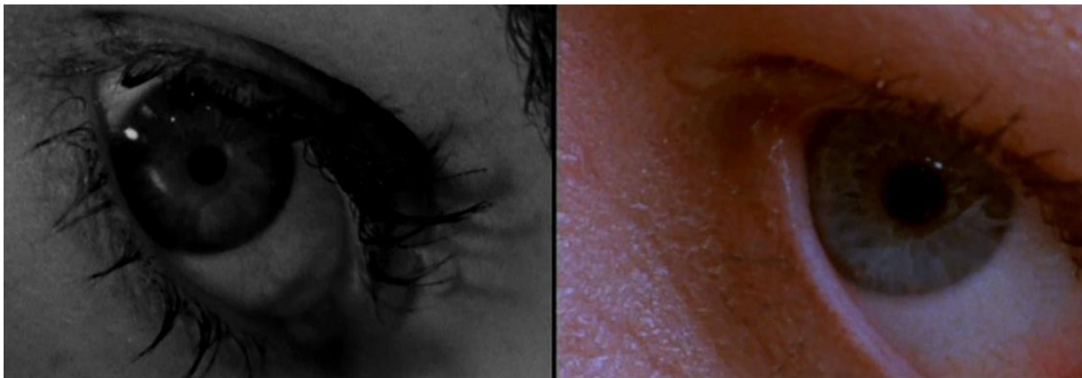
Slika 10. Kadar iz Psychia (1960.) / kadar iz Psychia (1998.)