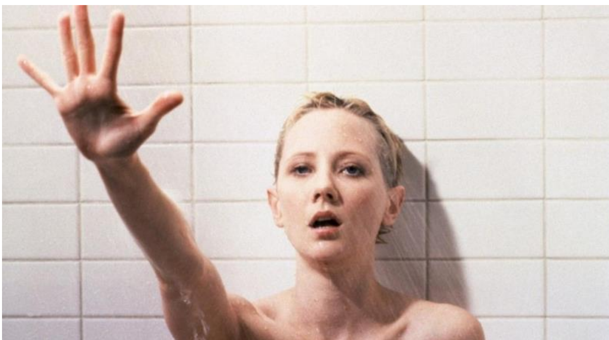
Slika 8. Rekonstrukcija scene pod tušem u prerađenoj verziji Psycha (1998.)