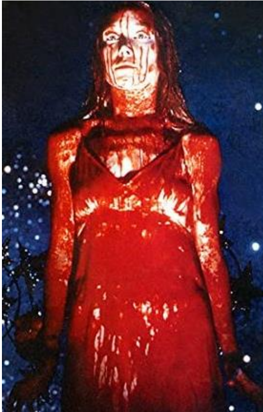
Slika 3. Sissy Spacek kao Carrie (1976.)