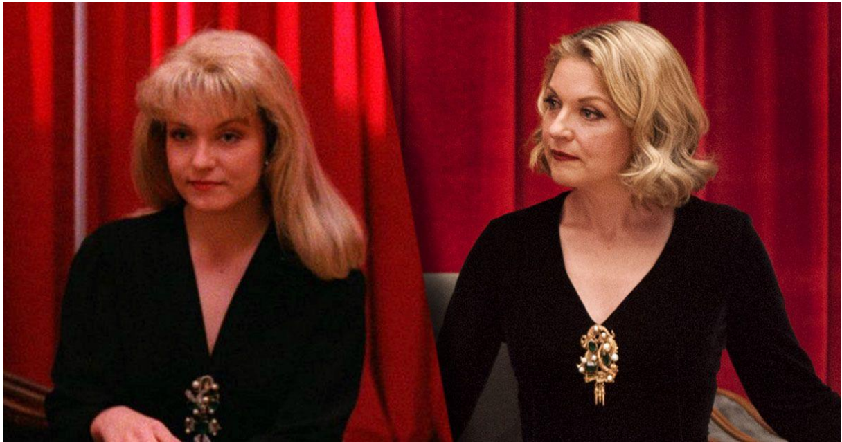
Slika 1. Laura Palmer Twin Peaks (1990.)/Laura Palmer Twin Peaks The Return (2017.)