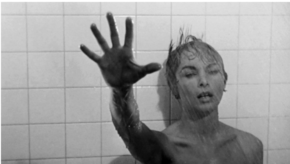
Slika 7. Kultna scena pod tušem, originalna Hitchcockova verzija (1960.)