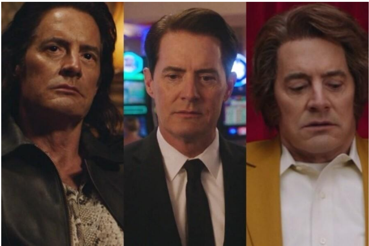
Slika 2. Tri varijante agenta Coopera