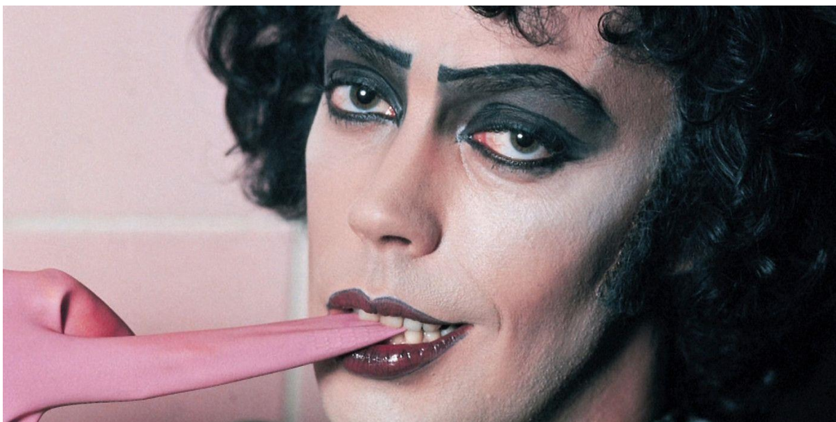
Slika 5. Tim Curry u ulozi dr. Frank-N-Furtera