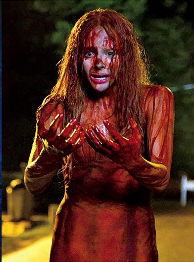
Slika 4. Chloe Grace Moretz kao Carrie (2013.)