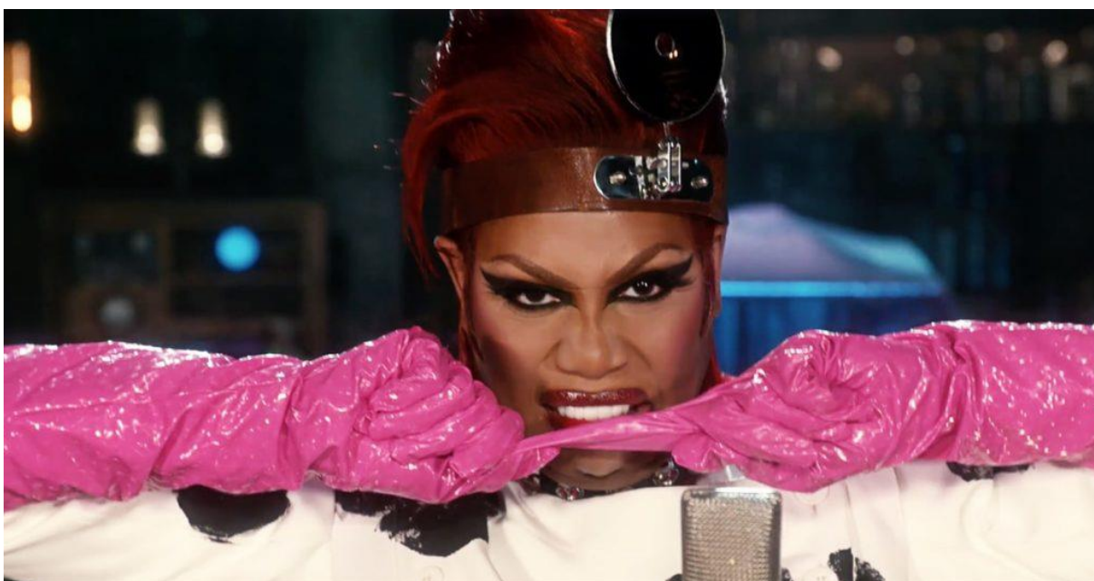
Slika 6. Laverna Cox u ulozi dr. Frank-N-Furtera