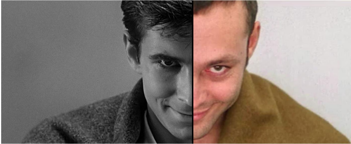
Slika 9. Anthony Perkins kao Norman Bates (1960.)