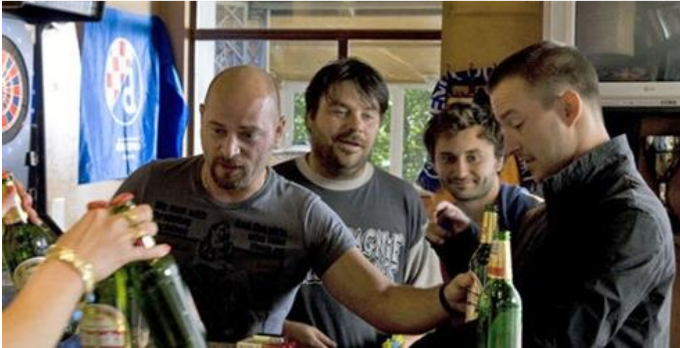
Slika 1 Glavni likovi Metastaza