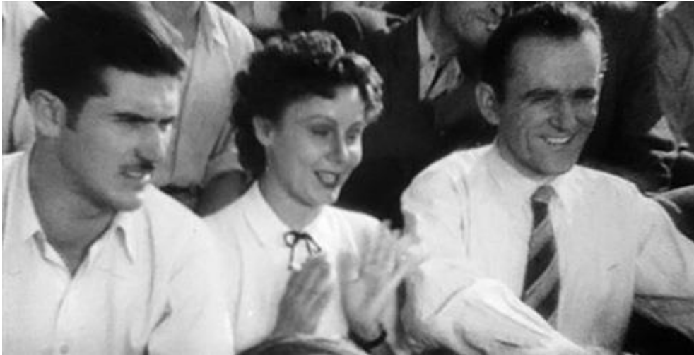
Slika 3 Glavni likovi iz Plavi 9