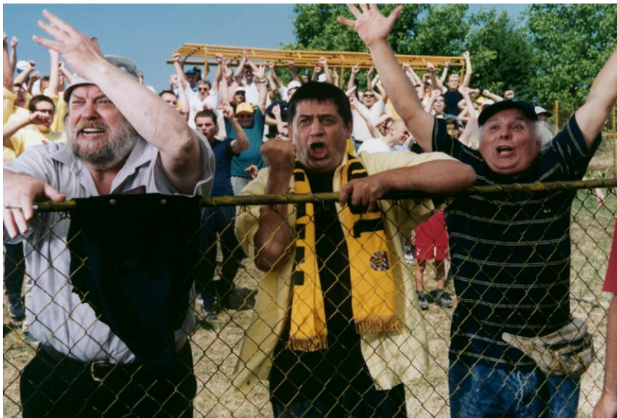
Slika 4 Prizor navijanja iz Filma Ajmo Žuti

Kao što je moguće povući paralele između radnji između Metastaza i ZG80 , tako je moguće podvući i sličnosti između filmova Plavi 9 i Ajmo Žuti . Sličnosti se pronalaze između Iveka i Zdravka ( Plavi 9 ), kao i tajkuna i Tončija (iako se ovdje može usporediti Tončija s nogometnom zvijezdom koja je došla igrati za Žute s obzirom na to da su Fabrisove osobine preraspodijeljene na više likova) te na kraju i paralela između ženskih likova Matilde i Nene. I u tim odnosima na kraju se Ivek i Matilda zaljube nakon što Matilda shvati da je Halapija (novi strijelac kojeg u filmu glumi Darko Janeš) čovjek pun ispraznih i hvalisavih priča, a Ivek neiskvareni romantik koji nikada nije digao ruke od Žutih usprkos tome što je bilo teško boriti se protiv tajkuna koji je mogao upravljati smjerom razvoja kluba radi kapitala koji mu je omogućio takvu moć. Upravo u tom sukobu se očituje društvena uloga nogometa u ovome filmu. Društvena uloga nogometa u filmu Ajmo Žuti prikazuje da treba puno više od jednog pojedinca da se razbije kolektiv koji je prije bio na snazi. Film dokazuje da čak i ako do toga dođe, zajednica se može i zna oduprijeti tim težnjama i izbaciti pojedince koji u njoj ne pripadaju, iako ne bez sukoba i teške borbe koju vodi protagonist.