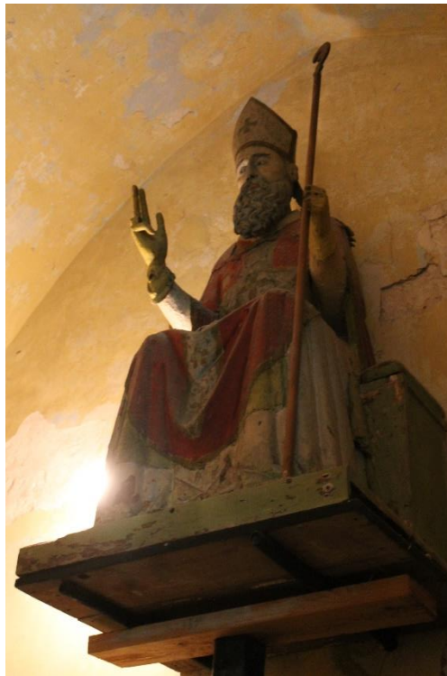
Slika 13. Kip sv. Gaudencija, 15. st., crkva sv. Gaudencija, Osor

Skulptura sv. Gaudencija smještena je u istoimenoj crkvi sv. Gaudencija u Osoru. 67 Danas je skulptura izvan liturgijske funkcije, ali je zadržana u svetištu i nalazi se iza kasnobaroknog oltara s oltarnom palom sv. Gaudencija iz 19. stoljeća. 68