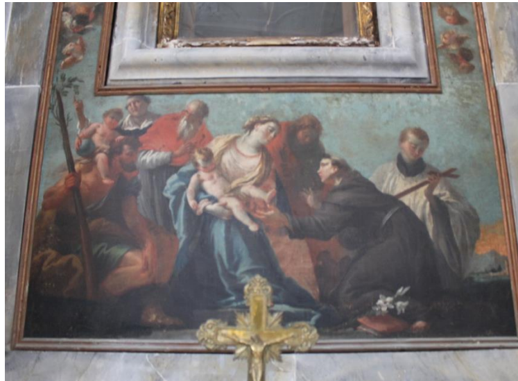
Slika 27. Bogorodica s Djetetom, sv. Kristoforom, sv. Vincenzom Ferrerijem, sv. Jeronimom, sv. Antunom Padovanskim, sv. Alojzijem Gonzagom i sv. Ivanom Evanđelistom, Gioanni Scajari, 18. st., crkva sv. Križa, Rab

Oltarna pala nalazi se na oltaru u crkvi sv. Križa u Rabu. Riječ je o pali portante, tj. oltarnoj slici koja je služila kao okvir „čudotvornom“ raspelu koje se nekada nalazilo u sredini oltara. Datira se u sedmo desetljeće 18. stoljeća i pripisuje se Giovanniju Scajariju. 86