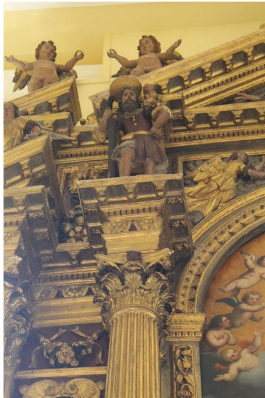
Slika 26. Kip sv. Kristofora, početak 17. st., crkva sv. Justine, Rab

Na drvenom manirističkom oltaru u crkvi sv. Justine u Rabu, desno od oltarne pale, nalazi se kip sv. Kristofora. Oltar s kipovima datira se u početak 17. stoljeća. Arhitektura oltara je pozlaćena, a kipovi su obojeni. 85