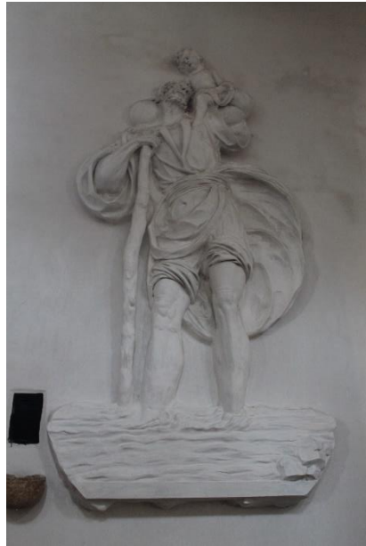
Slika 22. Štukatura sv. Kristofora, Giacomo i Clemente Sommazzi, 1798., župna crkva Uznesenja Blažene Djevice Marije, Rab

Štukatura sv. Kristofora izvedena je 1798. godine na novom stropu rapske exkatedrale. Strop su izveli štukateri iz Ticina Giacomo i Clemente Sommazzi. Strop je uklonjen u purifikacijskom konzervatorskom zahvatu potkraj šezdesetih godina i danas je smješten na zidu u desnom brodu katedrale. 81