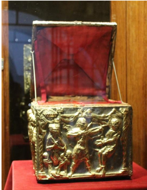
Slika 3. Relikvijar sv. Kristofora., župna crkva Uznesenja Blažene Djevice Marije, Rab

Relikvijar s glavom sv. Kristofora nalazi se u Rapskoj exkatedrali. Relikvijar je teško datirati zbog različitih stilskih izgleda. 51 Domijan ga datira u drugu polovicu 12. stoljeća i smatra da bi relikvijar mogao biti proizvod domaćih radionica. 52