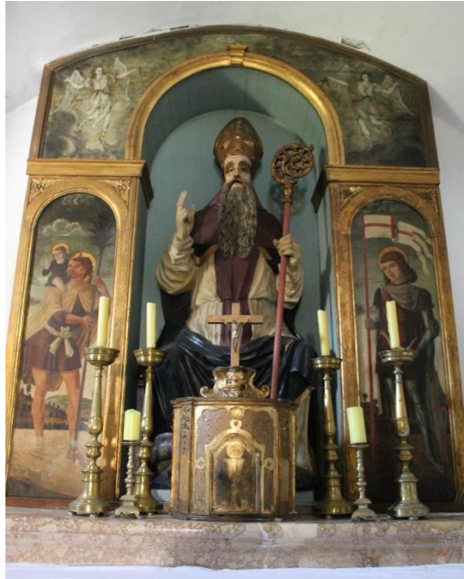
Slika 23. Sv. Kristofor, Juan Buscheta, 15.st., crkva sv. Antona Opata, Rab

Na glavnom oltaru u svetištu crkve sv. Antona Opata u Rabu nalazi se sjedeća monumentalna figura renesanskih osobina sv. Antuna Opata. Lijevo i desno od skulpture nalaze se dvije figure, sv. Kristofora i sv. Tudora, slikane na dasci. Slike na dasci pripisuju se Juanu Buscheta i datiraju u 15. stoljeće. 82