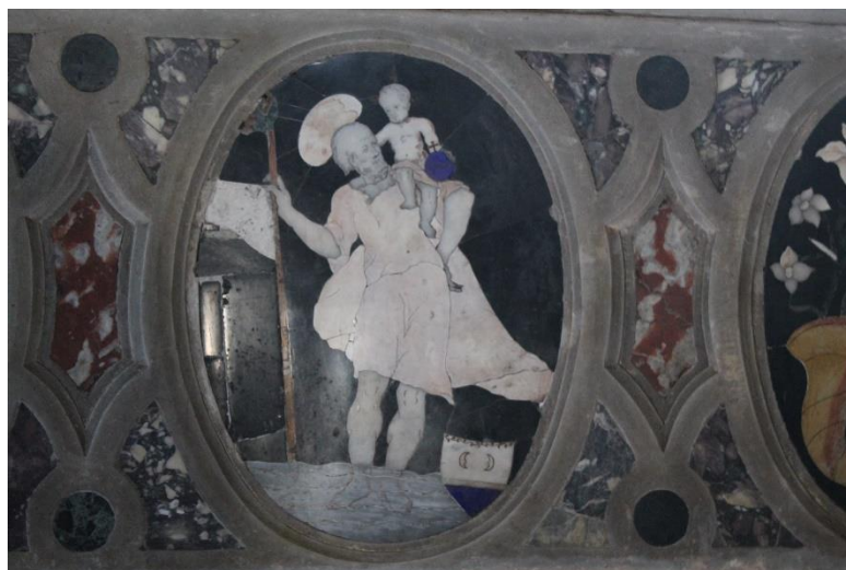
Slika 20. Sv. Kristofor, druga polovica 17. st., župna crkva Uznesenja Blažene Djevice Marije, Rab

Na antependiju glavnog oltara rapske exkatedrale, u višebojnim mramornim intarzijama, nalazi se prikaz sv. Kristofora iz druge polovice 17. stoljeća. 79