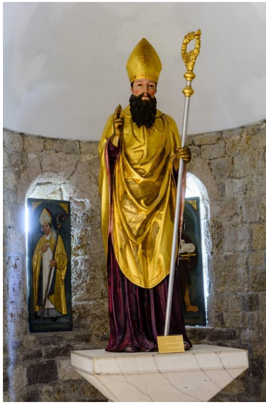
Slika 4. Kip sv. Kvirina, druga polovica 15. st., muzejski postav crkve sv. Kvirina, Krk

Skulptura sv. Kvirina nalazi se unutar muzejskog postava crkve sv. Kvirina. Stilskom analizom skulptura se povezuje s umjetnošću venecijanskog quattrocenta .