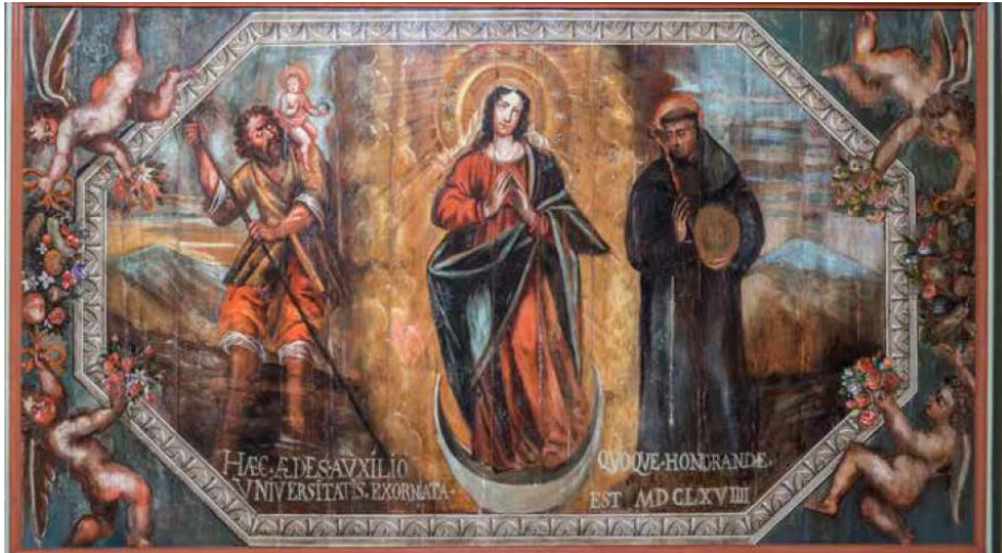
Slika 29. Bogorodica Bezgrješnog Začeca sa sv. Kristoforom i sv. Bernardinom, Mate Otoni Napoli, 1669., crkva sv. Bernardina, Kampor, Rab

Drveni strop u crkvi sv. Bernardina u Kamporu oslikan je s dvadeset i sedam slika. Slikar Mate Otoni Napoli oslikao je tabulat 1669. godine. Na najvećem polju naslikana je Imakulata. S jedne je strane prikaz sv. Kristofora s Djetetom, a s druge sv. Bernardina. 88