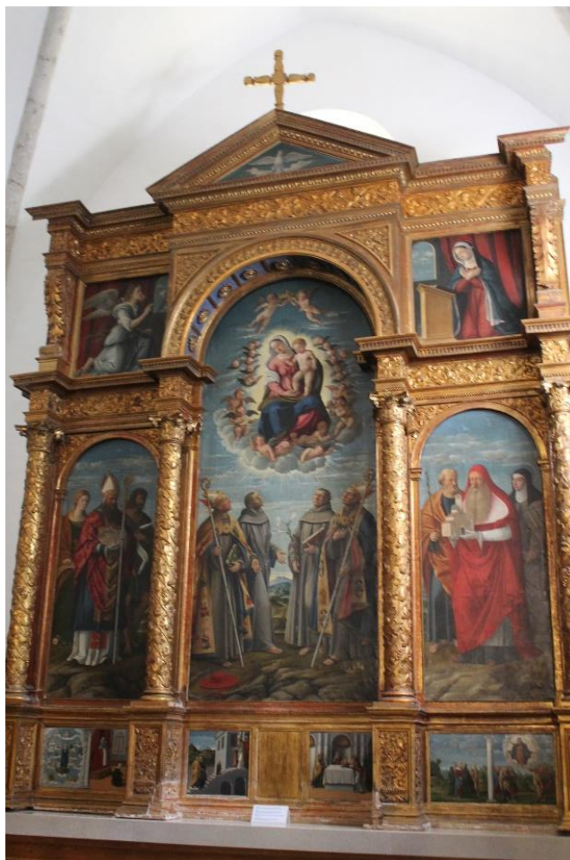
Slika 8. Poliptih Bogorodice s Djetetom i svecima, Girolamo da Santa Croce, 16. stoljeće, Franjevačka crkva Navještenja Marijina, Košljun, Krk

Poliptih koji je izradio Girolamo da Santa Croce nalazi se na glavnom oltaru crkve franjevačkog samostanu na Košljunu. Naručen je 1535. godine, a novac za njegovu nabavu iskorišten je iz ostavštine Katarine udane Dandolo, kćeri posljednjega krčkog kneza Ivana VII. Frankopana. 61