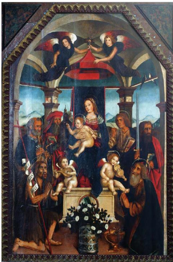
Slika 19. Sacra Conversazione, početak 16.st., župna crkva sv. Trojstva, Baška, Krk

Pala se nalazi u Baški na otoku Krku u sjevernoj lađi u župnoj crkvi Sv. Trojstva na oltaru sv. Ivana Krstitelja. Izvorno je krasila glavni oltar stare bašćanske župne crkve sv. Ivana Krstitelja. Premještena je nakon što je u 18. stoljeću sagrađena nova župna crkva. 76 Prema Gordani Soboti Matejčić autor bašćanske pale je slikar Juan Boschetus. Autorica, nadalje, smatra da je bašćanska slika nastala početkom 16. stoljeća kada je bilo preuređeno svetište stare župne crkve. Točnije, datira ju oko 1517. godine, koja je upisana na nadgrobnoj ploči Nikole Žuvanića u prezbiteriju, za kojeg je moguće da je prednjačio u financiranju izrade pale, zajedno s bratovštinom koja se je brinula o oltaru. 77