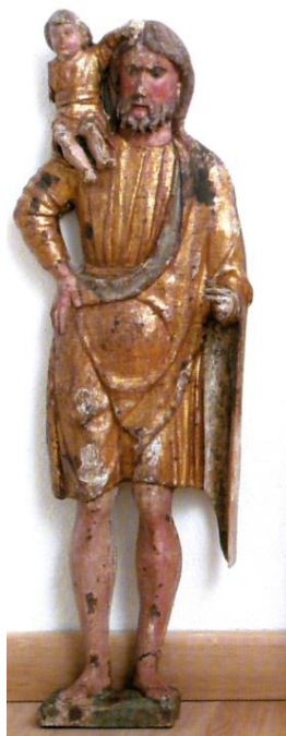
Slika 32. Triptih (sv. Kristofor, Bogorodica s Djetetom, sv. Sebastijan), druga polovica 15. st., župni ured, Beli, Cres

Danas se polikromirani drveni triptih nalazi u župnom uredu u Belom na otoku Cresu, a izvorno je bio smješten u kapeli Gospe Lurdske uz župnu crkvu Prikazanja Bogorodice u Hramu u Belom. Središnji reljef prikazuje Bogorodicu s Djetetom, a bočne figure prikazuju sv. Kristofora i sv. Sebastijana. 91