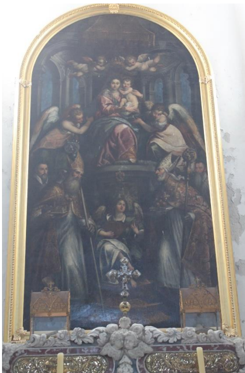
Slika 12. Bogorodica s Djetetom, sv. Gaudencijem i sv. Nikolom s donatorima, Andrea Vicentino, druga polovica 16. st., župna crkva Uznesenja Blažene Djevice Marije, Osor, Cres

Oltarna pala nalazi se na glavnom oltaru u exkatedrali Uznesenja Blažene Djevice Marije u Osoru. Palu je oslikao Andrea Vicentino u drugoj polovici 16. stoljeća. 66