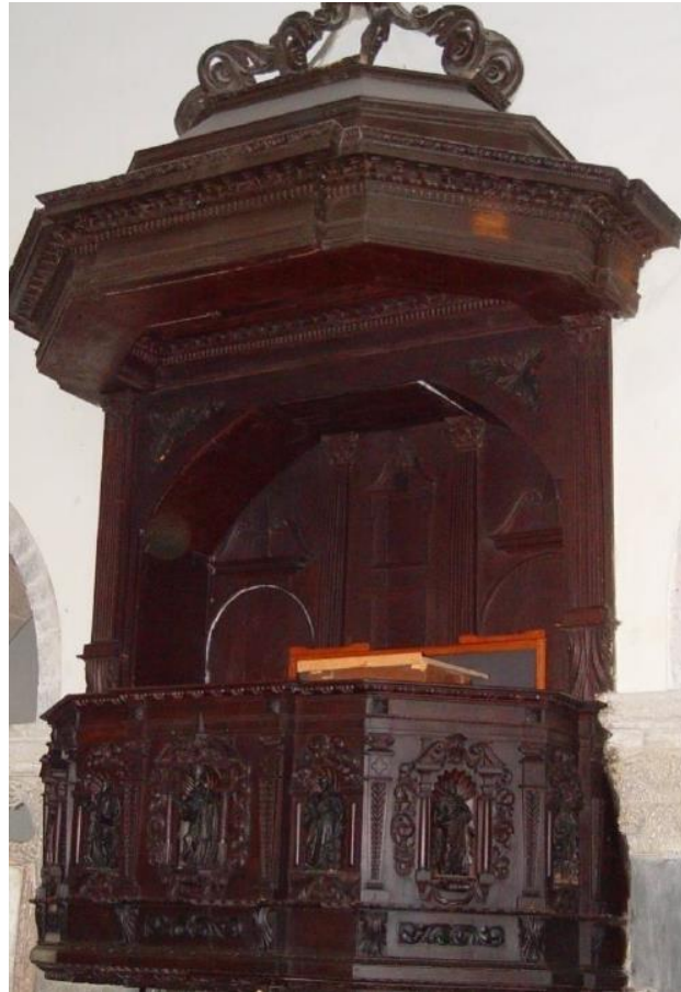
Slika 10. Propovjedaonica, Mihovil Zierer, 1704. godine, katedrala Uznesenja Blažene Djevice Marije, Krk

Propovjedaonica koju je 1704. godine izradio Mihovil Zierer nalazi se pred apsidom u prezbiteriju sa sjeverne strane katedrale. Ograda propovjedaonica ima sedam strana, a u svakoj niši smješten je jedan kip. Postavljena su četiri evanđelista i tri crkvena oca. Evanđelisti se prepoznaju po svojim atributima, sv. Luka po volu, sv. Ivan po orlu, sv. Marko po lavu i sv. Matej po anđelu. Tri crkvena oca teško je prepoznati. Jedan od njih mogao bi biti sv. Kvirin jer je prikazan kao biskup, s mitrom na glavi i odjeven u biskupski ornat. 64