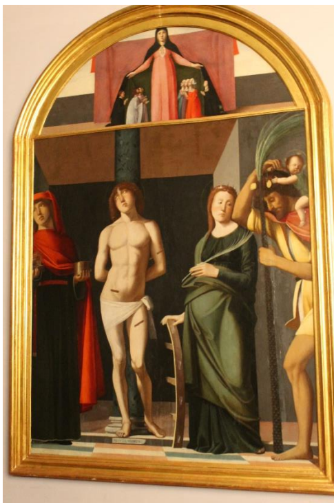
Slika 31. Bogorodica zaštitnica, sv. Sebastijan i sveci, Alvise Vivarini, 1486., župni ured, Cres

Oltarna je pala danas smještena u župnom uredu u Cresu. Ne zna se pouzdano gdje se slika izvorno nalazila. Smatra se da je možda podrijetlom iz zborne crkve Marije Snježne. 90 Palu je naslikao Alvise Vivarini 1486. godine.