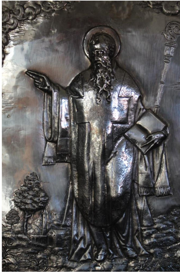
Slika 6. Srebrni reljef sv. Kvirina, 16. stoljeće, Katedrala Uznesenja Blažene Djevice Marije, Krk

Sv. Kvirin prikazan je na jednom od srebrnih reljefa iz 16. stoljeća. Reljef se nalazi u Krčkoj katedrali.