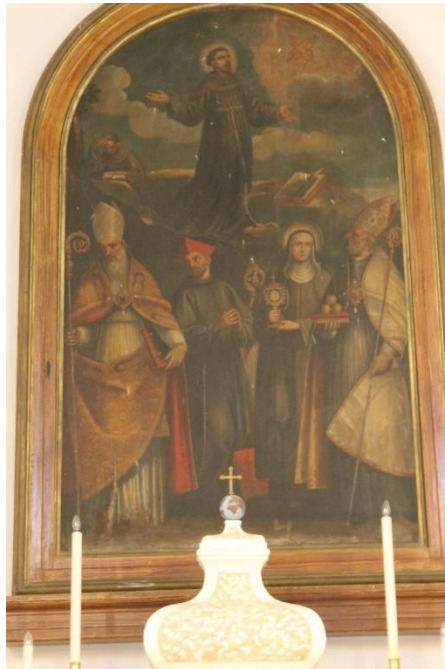
Slika 15. Sv. Franjo, sv. Gaudencije, sv. Bonaventura, sv. Klara, sv. Nikola, Baldassare d`Anna, kraj 16. stoljeća, Franjevački samostan, Nerezine, Lošinj

Oltarna se slika nalazi na glavnom oltaru franjevačke crkve u Nerezinama. Autor pale je Baldassare d`Anna koji ju je naslikao krajem 16. stoljeća. Prikazan je sv. Franjo koji u molitvi prima Kristove rane. U donjem dijelu, u punoj visini, prikazani su slijeva nadesno: sv. Gaudencije, sv. Bonaventura, sv. Klara i sv. Nikola. 72