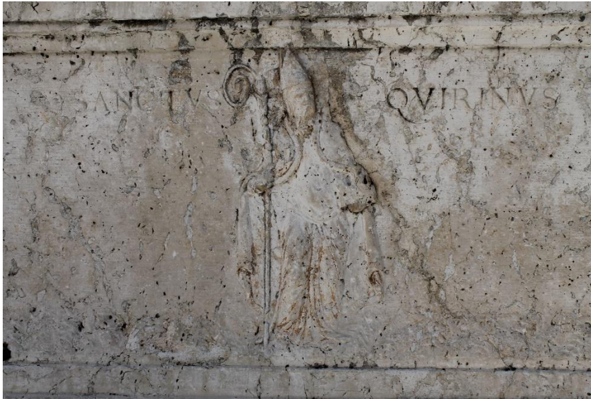
Slika 7. Kruna cisterne providura Angela Gradeniga, 1558., Krk

Šesterostrana kruna cisterne izrađena je 1558. godine u vrijeme providura Angela Gredeniga. Sadrži šest reljefa. Na tri duže ploče nalaze se prikazi krilatog lava sv. Marka, sv. Kvirina i grb Angela Gradeniga s inicijalima providura. Jedna od kraćih ploča sadržava natpis, a dvije varijacije ukrasnog motiva festona. 59