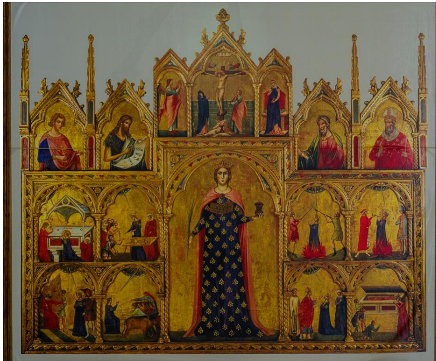
Slika 18. Poliptih sv. Lucije, oko 1350., Biskupija, Krk

Poliptih sv. Lucije danas se nalazi u biskupiji u Krku, a izvorno je resio glavni oltar crkve u Jurandvoru pokraj Baške. Djelo se prvi put spominje u rukopisu pastoralnih vizitacija iz 1617. godine. Danas se djelo pripisuje slikaru Paolu Venezianu i njegovoj radionici te se datira oko 1350. godine 75