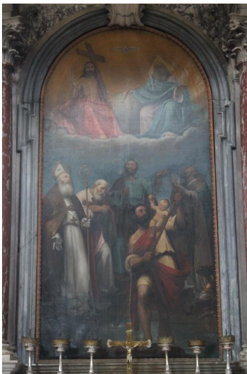
Slika 17. Sv. Gaudencije, sv. Kvirin, sv. Kristofor, sv. Martin i sv. Josip, 19. stoljeće, župna crkva Male Gospe, Mali Lošinj

Oltarna pala iz 19. stoljeća nalazi se na drugom oltaru sjevernog zida u župnoj crkvi Male Gospe u Malom Lošinj. Na pali je prikazan zaštitnik Krčke biskupije sv. Kvirin i suzaštitnici sv. Gaudencije i sv. Kristofor. Sadržan je i prikaz starog zaštitnika Malog Lošinja sv. Martina i zaštitnika opće crkve sv. Josipa. 74