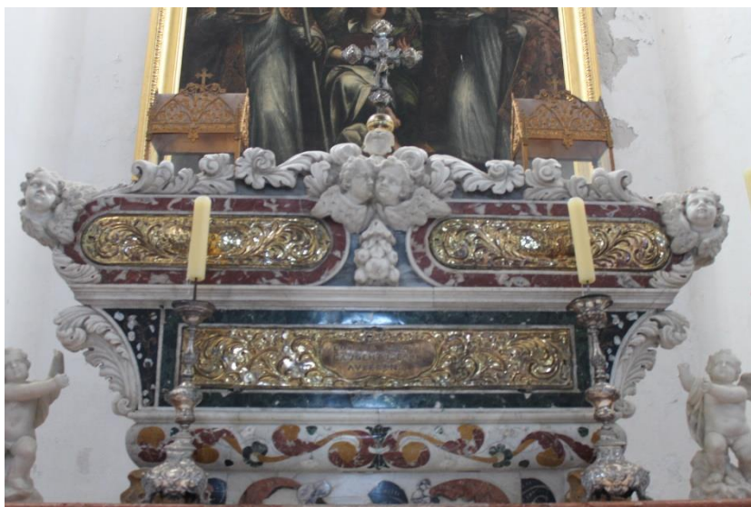
Foto 2. Sarkofag sv. Gaudencija, župna crkva Uznesenja Blažene Djevice Marije, Osor, Cres

Tijelo sv. Gaudencija čuva se u mramornom sarkofagu na glavnome oltaru u exkatedralnoj crkvi Uznesenja Blažene Djevice Marije u Osoru. Mramorni kovčeg dao je sagraditi biskup Šimun Gaudencije 1713. godine.