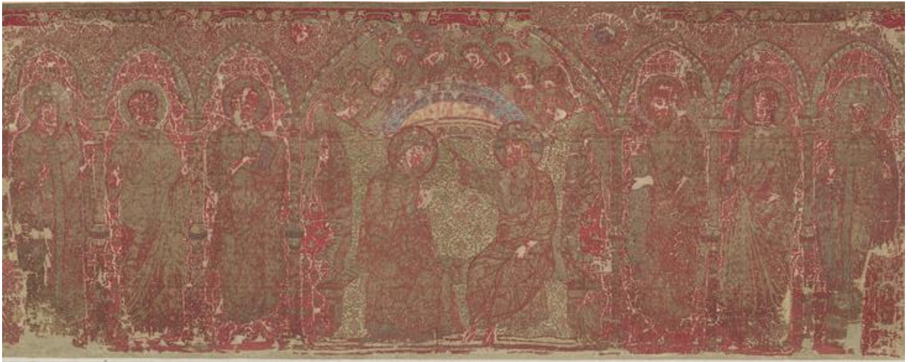
Slika 11. Antependij, Paolo Veneziano, 14. stoljeće, Victoria and Albert Museum, London

Antependij s figuralnim vezom naručen je u 14. stoljeću za Katedralu Marijina Uznesenja u Krku. Antependij je izvezen prema nacrtu Paola Veneziana. U sakristiji katedrale nalazio se do kraja trećeg desetljeća 20. stoljeća, a od 1964. čuva se u Victoria and Albert Museum u Londonu.