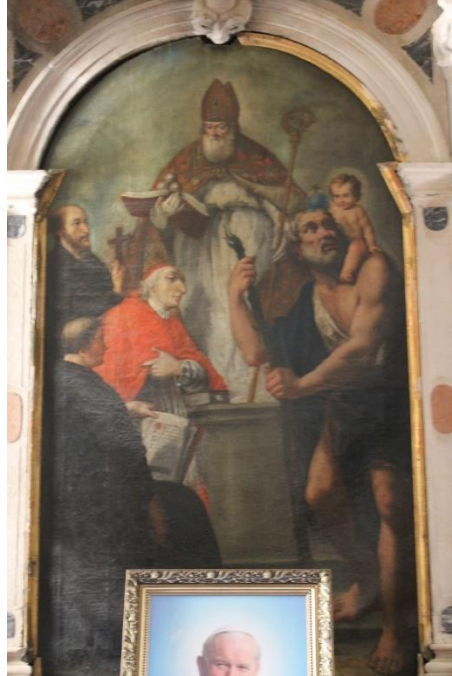
Slika 33. Sv. Nikola sa sv. Kristoforom, sv. Gaetanom iz Thiene, sv. Karlom Boromejskim i nepoznatim svecem, 18. st., Katedrala Uznesenja Blažene Djevice Marije, Krk

Oltarna pala s prikazom sv. Nikole sa sv. Kristoforom, sv. Gaetanom iz Thiene, sv. Karlom Boromejskim i nepoznatim svecem nalazi se na oltaru u kapeli sv. Nikole u Katedrali Uznesenja Blažene Djevice Marije u Krku. Autor pale je nepoznat, a datira ju se u posljednju trećinu 18. stoljeća. 94