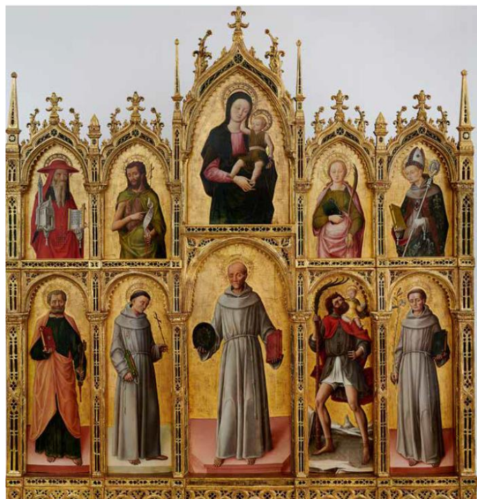
Slika 28. Poliptih sv. Bernardina, Antonio i Bartolomeo Vivarini, 1458., crkva sv. Bernardina, Kampor, Rab

Poliptih sv. Bernardina nalazi se u crkvi sv. Bernardina u Kamporu na otoku Rabu. Izradili su ga Antonio i Bartolomeo Vivarini 1458. godine.