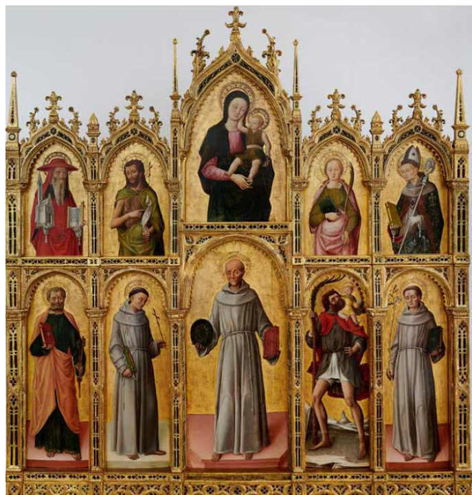
Slika 28. Poliptih sv. Bernardina, Antonio i Bartolomeo Vivarini, 1458., crkva sv. Bernardina, Kampor, Rab

Poliptih sv. Bernardina nalazi se u crkvi sv. Bernardina u Kamporu na otoku Rabu. Izradili su ga Antonio i Bartolomeo Vivarini 1458. godine.