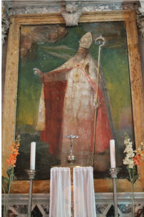
Slika 14. Oltarna pala sv. Gaudencija, F. Caracristi, 1868. godine, crkva sv. Gaudencije, Osor, Cres

Na glavnom oltaru u crkvi sv. Gaudencija u Osoru nalazi se oltarna pala s prikazom sv. Gaudencija. Oltarnu palu izradio je F. Caracristi 1868. godine. 71