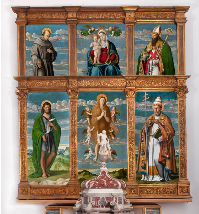
Slika 9. Sv. Marija Magdalena, sv. Ivan Krstitelj, sv. Grgur, Bogorodica s Djetetom, sv. Franjo, sv. Kvirin, 16. st., Franjevački samostan, Porat, Krk

Poliptih je smješten na glavnom oltaru sv. Marije Magdalene u franjevačkom samostanu u Portu na otoku Krku. Poliptih se povezuje s venecijanskom radionicom Girolama da Santacrocea.