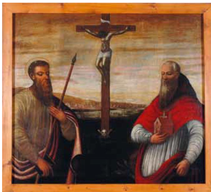
Slika 16. Sv. Gaudencije i sv. Longin, 17. stoljeće, župna crkva sv. Antuna Opata Pustinjaka, Veli Lošinj

Slika nepoznatog autora nastala je početkom 17. stoljeća. Danas je smještena desno od ulaza u župnoj crkvi sv. Antuna Opata u Velom Lošinj.