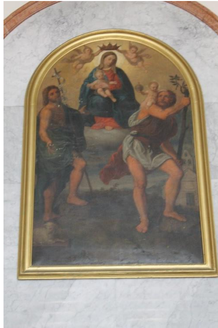
Slika 30. Bogorodica s Djetetom, sv. Kristoforom i sv. Ivanom Krstiteljem, župna crkva sv. Ivana Krstitelja, Lopar, Rab

Oltarna pala smještena je na glavnom oltaru u župnoj crkvi sv. Ivana Krstitelja u Loparu na Rabu. Na pali je prikazana Bogorodica s Djetetom, sv. Kristoforom i sv. Ivanom Krstiteljem.