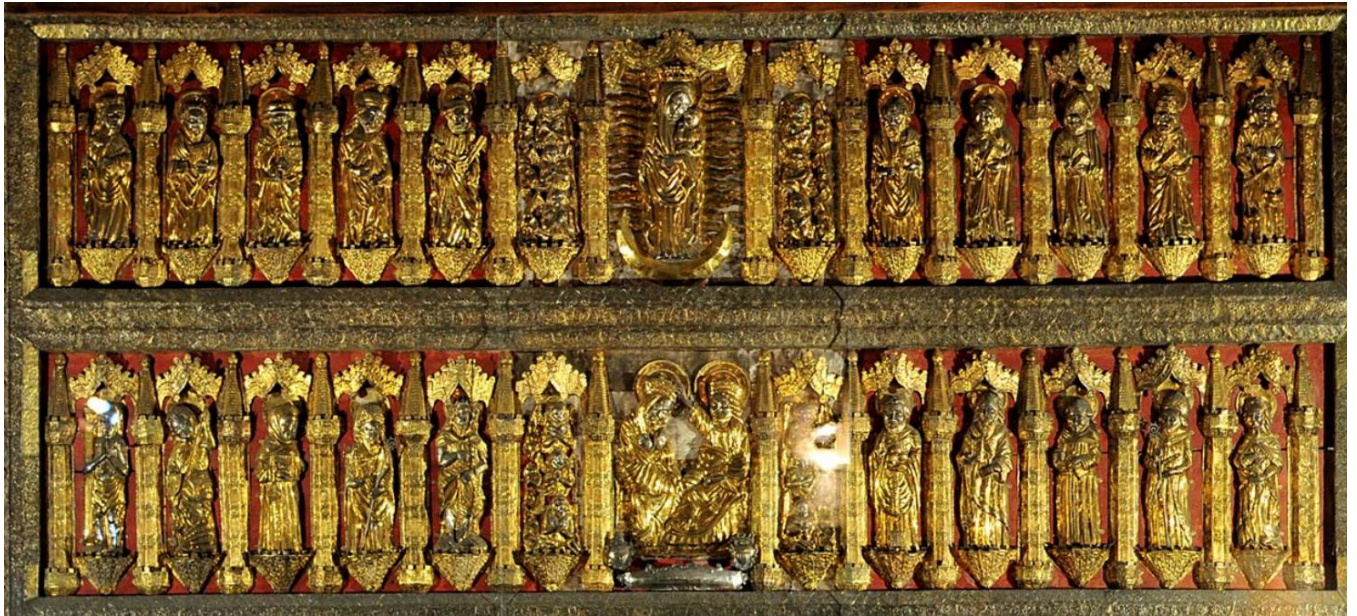
Slika 5. Frankopanska pala, 1477., riznica Katedrale Uznesenja Blažene Djevice Marije, Krk

Pala se danas čuva u sakralnoj zbirici u crkvi sv. Kvirina, a izvorno se nalazila na glavnom oltaru Krčke katedrale. Naručio ju je hrvatski knez Ivan VII. Frankopan, a izradio ju 1477. godine Paulus Koler. 56