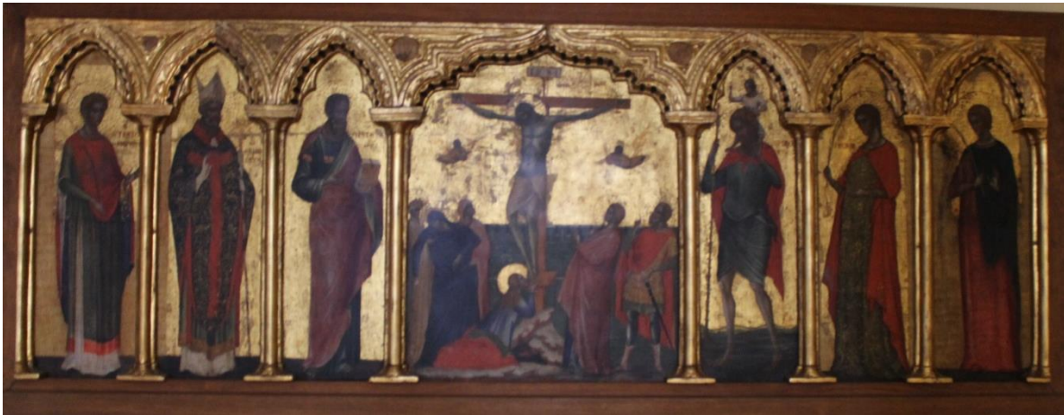
Slika 24. Dijelovi poliptiha, Paolo Veneziano, sredina 14. st., sakralna zbirka crkve sv. Justine, Rab

Poliptih je danas dio sakralne zbirke u crkvi sv. Justine u Rabu, a izvorno se nalazio u porušenoj crkvi sv. Ivana Evanđelista. Pripisuje se Paolu Venezianu i datira u sredinu 14. stoljeća.