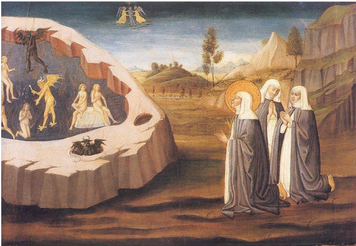
Majstor San Miniata, Sv. Katarina Sijenska zagovara za dušu svoje sestre Palmerine , oko 1570., ulje na platnu, Gradski muzej Amedeo Lia, La Spezia

Osnovnu ikonografiju sv. Katarine Sijenske čine brojne vizije koje je imala tijekom života, a putem kojih je shvatila svoj odnos s Bogom. U nju spadaju i zagovorničke molitve za njenu obitelj i prijatelje 132 , a jedan od takvih prikaza je i navedena slika na kojoj svetica zagovara za dušu svoje pokojne sestre. Radi se o slici nastaloj oko 1570. godine na kojoj je prikazan i pakao, stoga tu sliku možemo dovesti u vezu sa svetičinom vizijom pakla. Iako autor slike nije doslovno prenio viziju koju je svetica doživjela, ona nam je svakako značajna jer prikazuje osnovne elemente pakla.