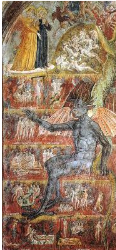
Antoniazzo Romano, Vizija pakla Franciske Rimske , 1468., freska, samostan Tor de' Specchi, Rim

Ova freska pronađena je u staroj kapeli samostana Tor de' Specchi u Rimu. Pripisuje se radionici Antoniazza Romana, a rad na njoj, kao i na ostalim freskama u ovoj kapeli, bio je završen 1468. godine. Radi se o ikonografskoj transkripciji vizije pakla sv. Franciske Rimske koja se, iako se radi o vjernom prikazu, u nekim dijelovima ipak razlikuje od same vizije. 130