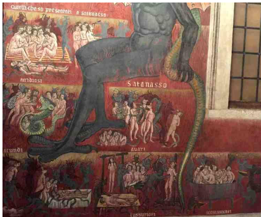
Antoniazzo Romano, Vizija pakla Franciske Rimske (detalj), 1468., freska, samostan Tor de' Specchi, Rim