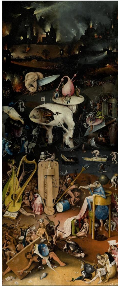
Hieronymus Bosch, Pakao (desni dio triptiha Vrt zemaljskih užitaka ), 1480.-1505., ulje na ploči, muzej Prado, Madrid

brojne predmete u neprirodnoj veličini koji također služe kao sredstva mučenja ljudi. 126 Ovakvim prikazima Bosch je zapravo htio izraziti svoje vjerovanje u postojanje pakla do kojega se dolazi ukoliko se slijede zemaljski užitci. On je vjerovao da je pakao materijalni svijet vječno odvojen od Boga pa je njegov cilj bio prikazati taj svijet u što strašnijem obliku kako bi se ljudi prestrašili takvog ishoda svoga života i počeli živjeti prema Božjoj riječi. Snažan utjecaj na promatrača njegovi prikazi pakla imaju i danas. 127