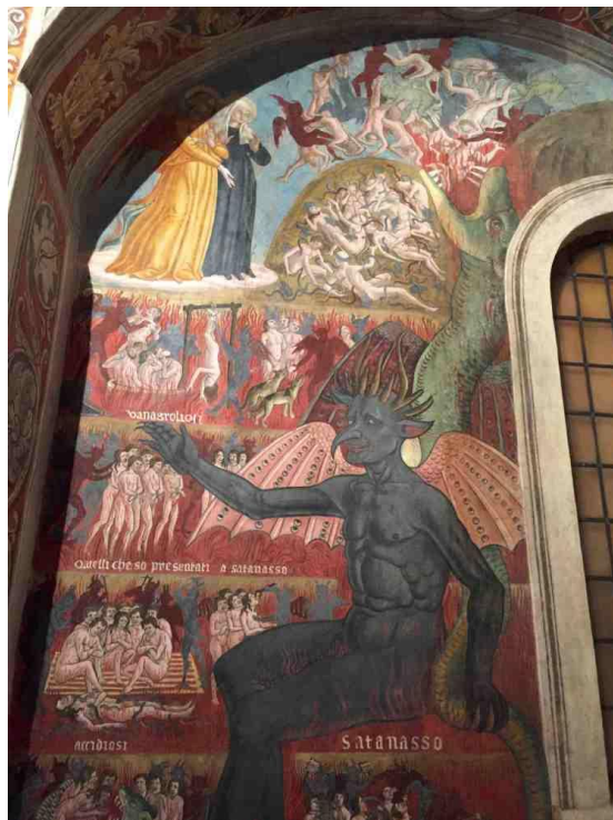
Antoniazzo Romano, Vizija pakla Franciske Rimske (detalj), 1468., freska, samostan Tor de' Specchi, Rim

ispunjenom tekućom smolom, sumporom, uljem i željezom 131 , a na njihovim licima vidi se iznimna bol i očaj zbog muka koje trpe na tome mjestu.