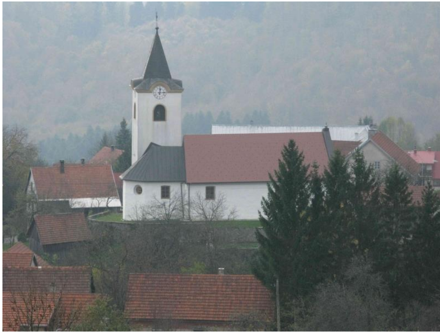
Slika 5. Crkva sv. Nikole, Brod Moravice