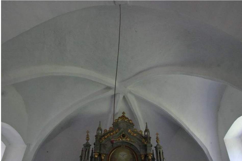
Slika 21. Svod u svetištu crkve sv. Duha