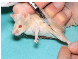
Fotografija 2. Pokusni miš

Kao prvo, činjenica da se pokusi provode upravo na ne-ljudskim životinjama, a ne na kamenju, pokazuje da između ljudi i ne-ljudskih životinja postoji ogromna sličnost zahvaljujući kojoj se pokusi i smatraju adekvatnima. Dakle, „oni ne mogu nijekati patnju životinja stoga što trebaju istaknuti sličnost između ljudi i drugih životinja kako bi mogli utvrditi da njihovi eksperimenti mogu imati nekakvo značenje za ljudske svrhe. Eksperimentator koji prisiljava štakore da biraju između smrti od gladi i električnih šokova da bi vidio da li se kod njih razvijaju čirevi (što se i događa), to čini zato što štakor ima veoma sličan živčani sustav onom koji imaju ljudska bića, te veoma vjerojatno osjeća električni šok na sličan način.“ 53 Osim toga, kao što Singer primjećuje, „mnogi eksperimenti nanose žestoku bol bez i najmanjih izgleda da će biti nekih značajnijih koristi za ljudska bića ili za bilo koje druge životinje.“ 54