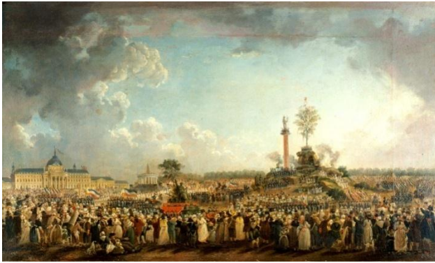
Festival kulta Najvišeg bića

Revolucionarni kultovi razvijali su se od početka revolucije. Prvi kult predstavljala je Federacija 14. srpnja 1798., koja je imala jednu od najsajnijih manifestacija. Građanskih svečanosti bilo je sve više i više, a jedna od najvećih je bila i svetkovina Jedinstva i nedjeljivosti zemlje koju je režirao slikar Jacques-Louis David. 70 U vrijeme pokreta dekristijanizacije, Kult razuma zamijenio je u crkvama, u jesen 1793. godine, katolički kult i ubrzo se pretvorio u dekadni kult čija je osnova bila građanska vrlina i republikanski moral. 71 Taj je kult najviše širio Jacques-Renne Herbert kojeg je Robespierre, dao uhititi i giljotinirati. Robespierre je htio ponuditi alternativni kult kojim bi privukao što više religiozno opredjeljenih revolucionara, bili oni po uvjerenjima katolici ili što drugo. 72