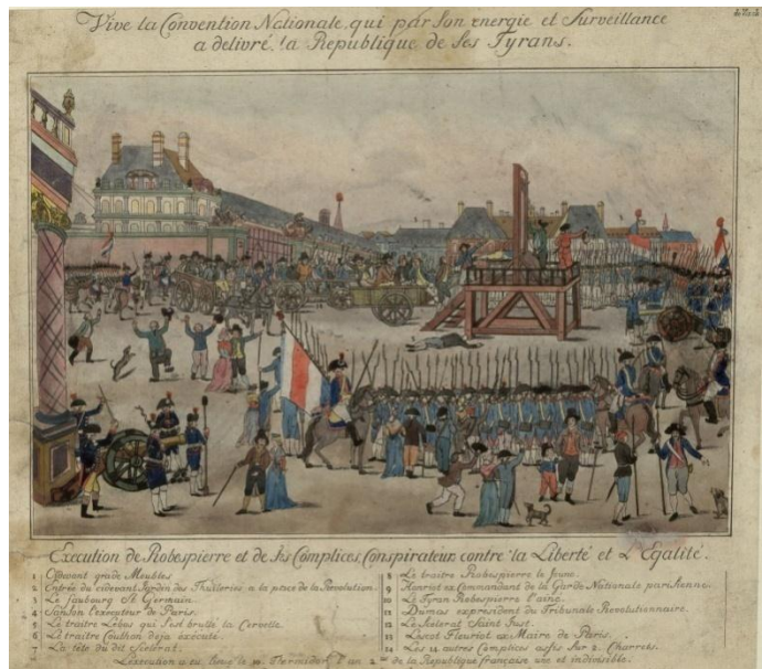
Smaknuće Maximiliena Robespiera

odmetnicima, po uhićenju morali su biti pogubljeni u roku od dvadeset i četiri sata bez prava na obranu. Robespierrov se brat, Augustin Robespierre, pokušavši izbjeći uhićenje, bacio kroz prozor slomivši obje noge, Couthon je također pokušao izvesti samoubojstvo, no Konventove trupe pronašle su ga na dnu stepenica paraliziranog od struka na dolje, dok se Phillipe-Francois-Joseph Le Bas upucao. Robespierre se također pokušao ubiti, htjevši zadržati dostojanstven kraj svoga života, no pri