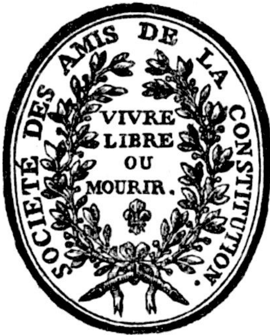
Značka Društva prijatelja ustava

Jedan od važnih čimbenika u napretku Robespierrove političke karijere, zasigurno je njegovo učlanjenje u Društvo prijatelja ustava, odnosno, Jakobinski klub. Geneza kluba dogodila se u kavani do Versaillesa, u vrijeme zasjedanja Generalnih staleža tijekom sredine 1789. godine. 32 U kavani su se sastajali zastupnici Generalnih staleža s područja Bretanje, odnosno, zastupnici trećega staleža jer su zastupnici klera, ali i plemstva bojkotirali zasjedanje