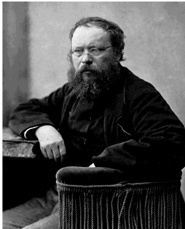
Slika 3: Pierre-Joseph Proudhon (1809.-1865.), francuski socijalist, ekonomist i začetnik mutualističke filozofije

Također se postavlja pitanje kako se takav sustav ponaša prema ljudima koji nisu sposobni zbog svoje fizičke i mentalne karakteristike sudjelovati u takvom sustavu. Do trenutka većeg širenja komunističke varijante, anarhizam ne postavlja takva pitanja kao prioritet. Mogući problemi su i određeni troškovi te rizici koji mogu uzurpirati takvu jednakost. Proudhon pokušava umanjiti taj nedostatak ovog pristupa distributivnoj pravednosti kroz kooperacijska društva uzajamnog osiguranja, pa čak uspostavu narodne banke koja bi nudila vrlo povoljne kredite kao dio rješenja problema.