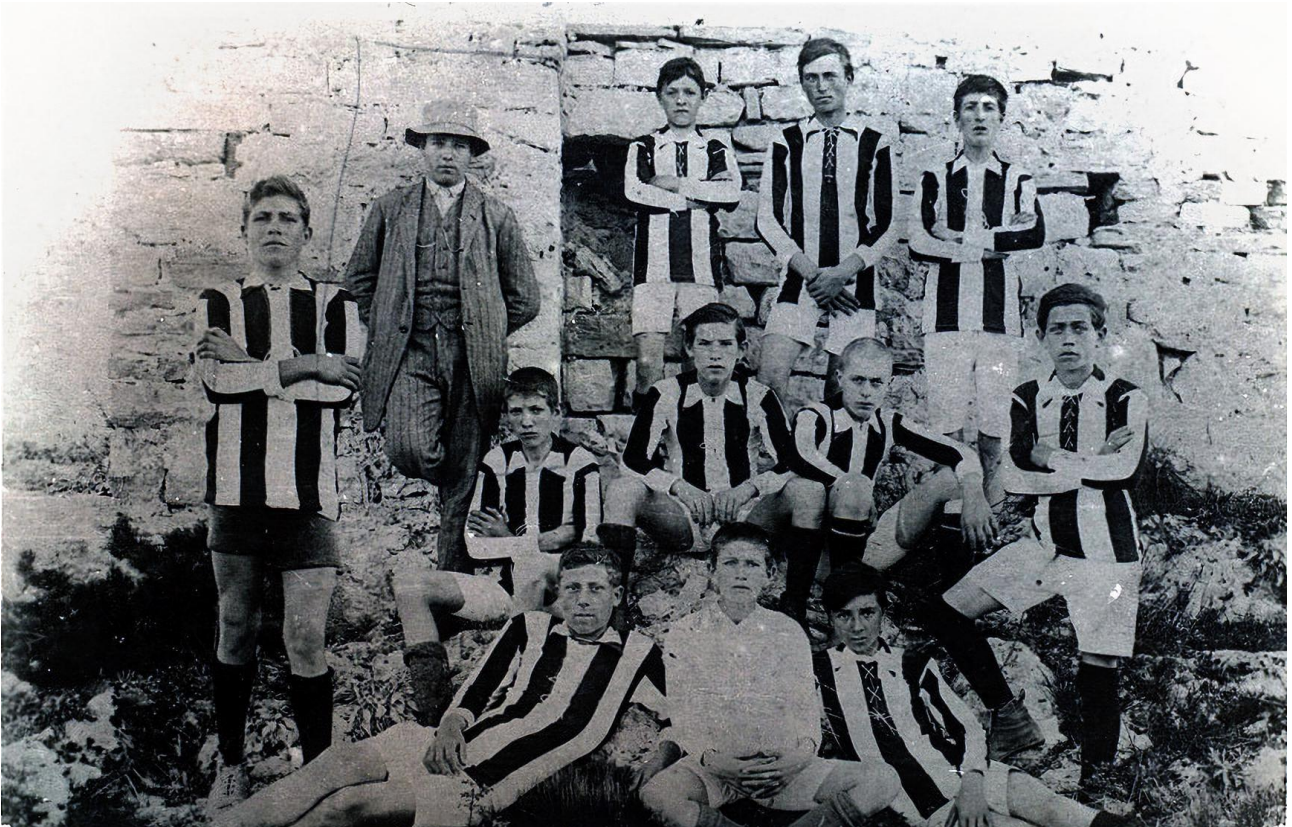
Slika 2: Nogometni klub 'Anarh' iz 1920.-ih

Anarhistički utjecaj je bio dalekosežniji od striktno političkih i društvenih pitanja. U umjetnosti o anarhizmu promišljaju i pronalaze inspiracije pisci poput Antuna Gustava Matoša (1873.-1914.), Janka Polića Kamova (1886.-1910.), Augusta Cesarca (1893.-1941.) i Miroslava Krleže (1893.-1981.). Što se sporta tiče, zanimljivo je da su učenici obrtničke škole 1912. u Splitu osnovali nogometni klub „Anarh”, godinu dana nakon osnivanja Hajduka u Pragu. 64 Danas je klub poznati kao Radnički nogometni klub „Split” 65 .