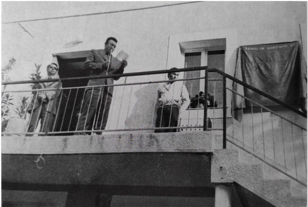
Spomen ploča postavljena na zgradi „Slavija“ 1976. godine u Senju, na mjestu gdje je Ćopić osnovao Mjesnu organizaciju SRPJ (k)