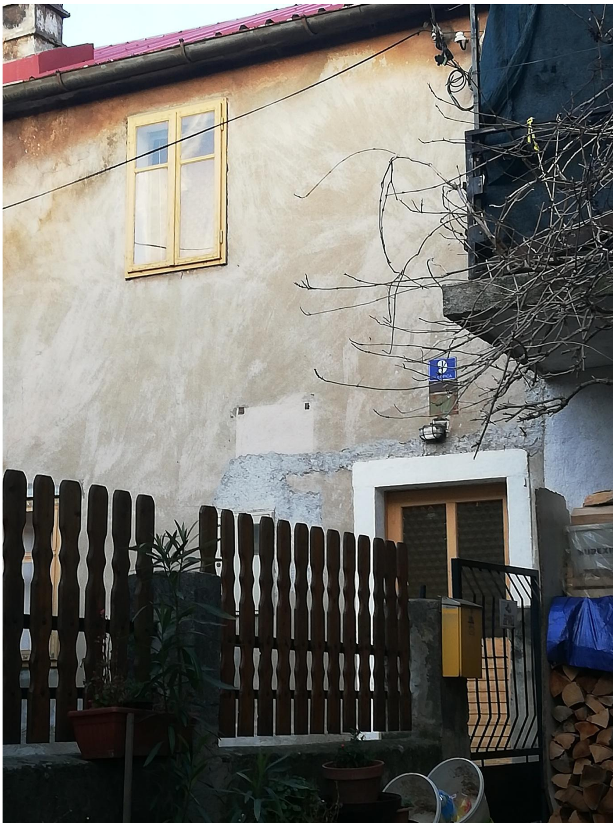
Fotografija Ćopićeve rodne kuće u Senju, naselju Varoš, snimljeno 16. siječnja 2020. godine