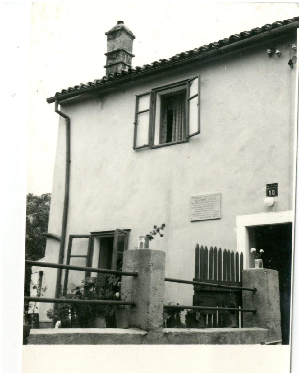
Spomen ploča na Čopićevoj rodnoj kući u Senju, naselje Varoš