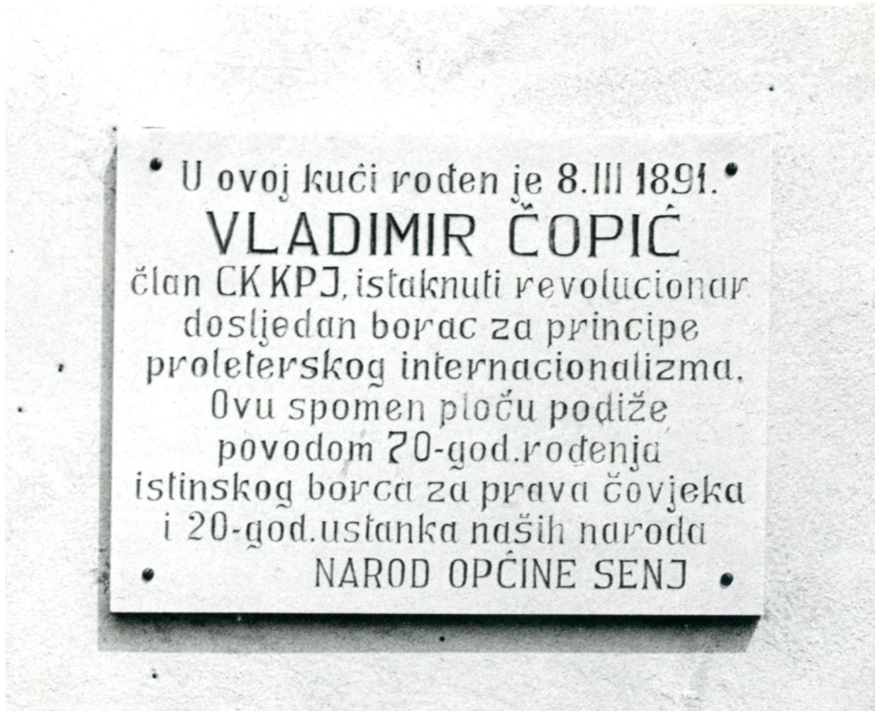
Izgled spomen ploče na Čopićevoj rodnoj kući u Senju, Arhiv Gradskog muzeja Senj