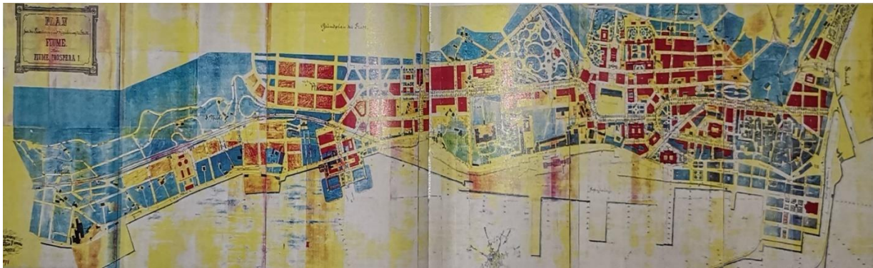
Slika 1. Natječajni plan Fiume Prospera iz 1874. Slika 1. Daina Glavočić...et al., Arhitektura historicizma u Rijeci , Rijeka, Moderna galerija Rijeka – muzej moderne i suvremene umjetnosti, 2002., str. 78.

Pored infrastrukturnih projekata, planirana je izgradnja nove Guvernerove palače (predviđeno je rušenje stare palače), gradske vijećnice, bolnice, skloništa, sirotišta, zatvorene gradske tržnice, gradskih parkova, burze, muzeja, vjerskih objekata i škola. Nisu svi planirani objekti izgrađeni, međutim, istaknuti objekti čija je izgradnja realizirana su: nova zgrada gradskog kazališta, dva paviljona gradske tržnice i ribarnice i nova Guvernerova palača. 10