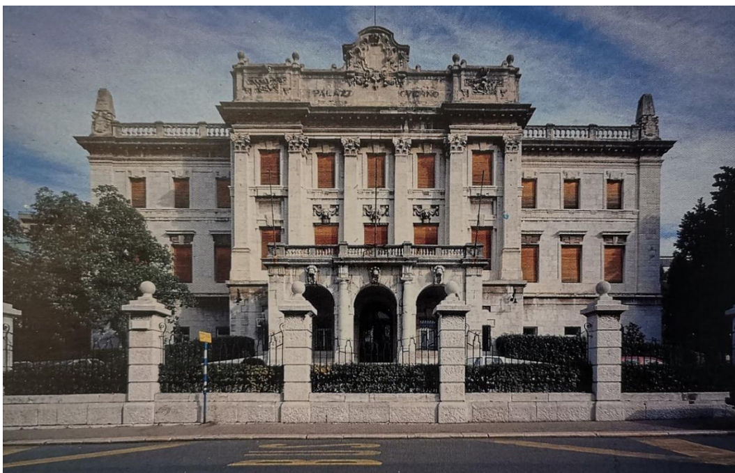
Slika 10. Guvernerova palača (Daina Glavočić...et al., Arhitektura historicizma u Rijeci , Rijeka, Moderna galerija Rijeka – muzej moderne i suvremene umjetnosti, 2002., str. 220.)