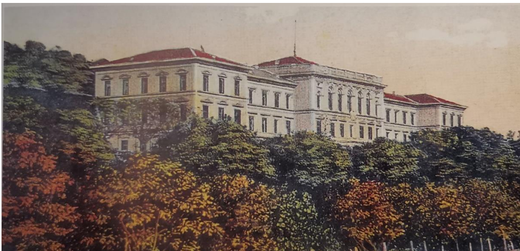
Slika 11. Hrvatska gimnazija u Sušaku (Daina Glavočić...et al., Arhitektura historicizma u Rijeci , Rijeka, Moderna galerija Rijeka – muzej moderne i suvremene umjetnosti, 2002., str. 489.)

će moći pohađati veliki broj hrvatskih učenika. Mađari su bili protiv gradnje nove hrvatske škole u Rijeci. Naprotiv, stvarali su pritisak da se ona ukine, argumentirajući da u Rijeci postoji već previše gimnazija. Međutim, sumnje u potrebu izgradnje nove zgrade gimnazije odagnao je Izidor Kršnjavi, ministar u vladi Khuena Hedervaryja u Zagrebu. Nalazeći se na čelu Odjela za bogoštovlje i nastavu , Kršnjavi je pronašao kompromisno rješenje za problem nove gimnazije. Dogovorom je ona prebačena na Sušak, ali je ban Khuen Hedervary pristao na podmirenje troškova izgradnje nove zgrade iz dijela prihoda Banske Hrvatske kojima se prema Nagodbi iz 1868. upravljalo zajednički. Projekt za novu gimnaziju predviđao je gradnju velike, raskošne palače. Tome se protivio riječki guverner Ljudevit Batthyany, vidjevši veliku hrvatsku školu kao prijetnju ideji približavanja Rijeke Mađarskoj. Unatoč Batthyanyjevim prosvjedima, Izidor Kršnjavi uspio se izboriti da se nova gimnazija financira i sagradi pod uvjetima koje je isposlovao, time nadoknađujući vlastiti neuspjeh u očuvanju hrvatske gimnazije u gradu Rijeci. 50