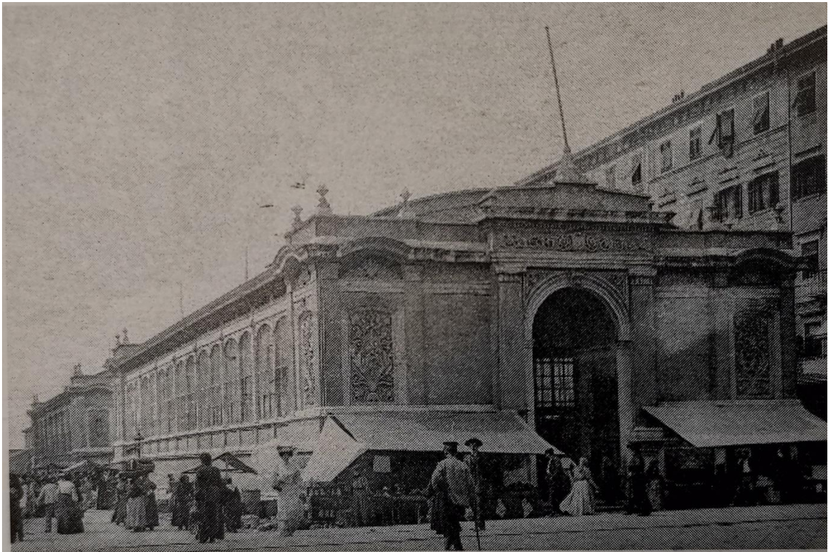
Slika 4. Interijer i pročelje nove tržnice (Daina Glavočić...et al., Arhitektura historicizma u Rijeci , Rijeka, Moderna galerija Rijeka – muzej moderne i suvremene umjetnosti str. 101.)

susreta tj. svojevrsnog foruma u Rijeci. Bile su najsuvremenije građevine za tu funkciju u to vrijeme. Grad se od početka 18.st. širio prema moru nasipavanjem – novi dio grada naziva se Novi grad ( Civitas nova ). Rast stanovništva primorao je gradsku upravu da razmišlja o smještanju nove tržnice izvan gradskih zidina. Stanovništvo se povećava razvojem industrije i pomorstva. Današnji trg pred Kazalištem i čitav prostor do sadašnje obale nasuti su postupno od 1825. do kraja 19. st. Prvo je nasut prostor do linije Verdijeve ulice gdje je bio Trg Urmeny, prvenstveno nasut kako bi služio kao vojno vježbalište. Na mjestu gdje su sada pokrivene tržnice i ribarnica zasađena su 1861. dva reda platana, a na dnu te aleje započeta je 1865. po projektu Antonija Deseppija gradnja ribarnice uz samu obalu mora. Stara je ribarnica pročeljem bila okrenuta prema obali gdje su ribari iskrcavali ribu na malom, drvenom molu. 29