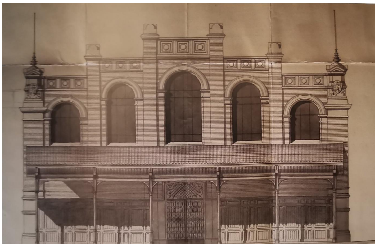
Slika 5. Plan gradnje tržnice Brajda (Radmila Matejčić, Kako čitati grad: Rijeka jučer, danas , Rijeka, 2007., str. 217.)

čtvrtni na zapadu Rijeke. Velika tržnica u središtu grada bila je predaleko za stanovnike zapadnog dijela grada. Projekt izgradnje tržnice na Brajdi u sklopu nove gradske četvrti trebao je osigurati dovoljno prostora za rješenje stambenog pitanja i tržnice na zapadu Rijeke. Projekt su inicirali i financirali Komunalna banka i Robert Whitehead, a arhitektonski projekt izradio je Giacomo Zammatio. Gradnja tržnice na Brajdi odraz je podizanja životnog standarda Riječana, porasta populacije u gradu i njegovog fizičkog širenja, jer više nije bio ograničen samo na prostor od Rive do ruba nekadašnjih srednjovjekovnih gradskih zidina, već se počeo širiti i na tadašnja prigradska naselja. 30 Gradnja gradske četvrti na Brajdi trajala je od 1890., a izgradnja paviljona tržnice započela je 1895. i poput paviljona velike tržnice u centru grada, bila je dovršena za godinu dana. 31