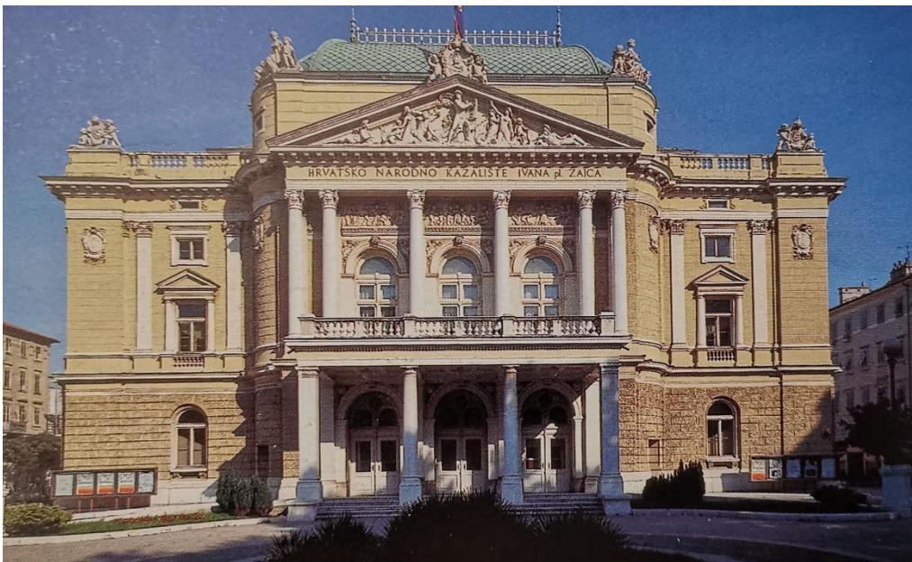
Slika 7. Općinsko kazalište (Daina Glavočić...et al., Arhitektura historicizma u Rijeci , Rijeka, Moderna galerija Rijeka – muzej moderne i suvremene umjetnosti, 2002., str.248.)

je koštalo 313 tisuća fiorina. Grad se zadužio u Riječkoj banci i štedionici. Planirano je provođenje električne rasvjete kroz novu zgradu. Odlučeno je da će na otvorenju biti izvedena Verdijeve opere Aida i Ponchiellieve La Gioconde, za koje je izdvojena pozamašna svota novca. No, radi potpunog dojma nastojalo se napraviti nešto što u Rijeci do tada nije viđeno na ovako visokoj razini. Kazalište je trebalo biti simbol riječke budućnosti koju će obilježiti gospodarski i društveni napredak. Najbolji način na koji se takav dojam mogao postići u to je vrijeme bilo postavljanje električne rasvjete u kazalište. Električne instalacije i osvjetljenje nisu bile uobičajena pojava budući da se radilo o relativno novoj tehnologiji i planovi za elektrifikaciju čitavih gradova tek će početkom 20. stoljeća postati normalna potreba u razvoju. Paljenje električne rasvjete u kazalištu bila je senzacija zato što su to bile prve električne instalacije u gradu i k tome u tako raskošnom izdanju. Postavljanje rasvjete iščekivalo se i pratilo u lokalnim novinama. 35 Grad Rijeka u većoj je mjeri elektrificiran tek nakon 1885. 36