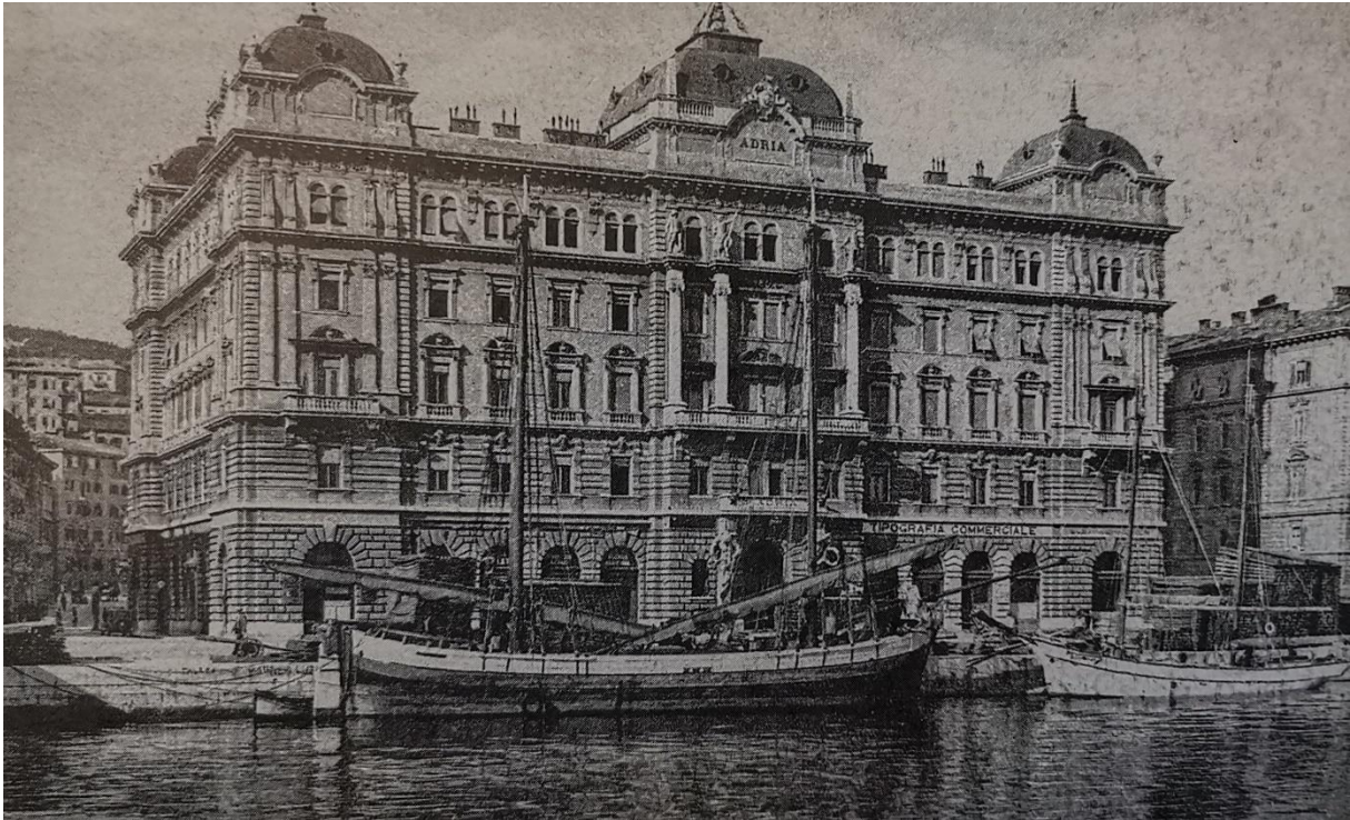
Slika 3. Palazzo Adria (Daina Glavočić...et al., Arhitektura historicizma u Rijeci , Rijeka, Moderna galerija Rijeka – muzej moderne i suvremene umjetnosti, 2002., str. 227.)

konkurencija austrijskom Lloydu na Jadranu Udruženje Adria dominiralo je riječkom trgovinom na tržištima Zapadne Europe i Amerike. 26 Izgradnju palače vodio je arhitekt Giacomo Zammatio. Već 1895. podignut je krov, a 1897. gradnja je završena. U prizemlju i na prva dva kata predviđen je smještaj poslovnih prostora, a zadnja dva služila su kao stambeni prostori za više činovnike. 27