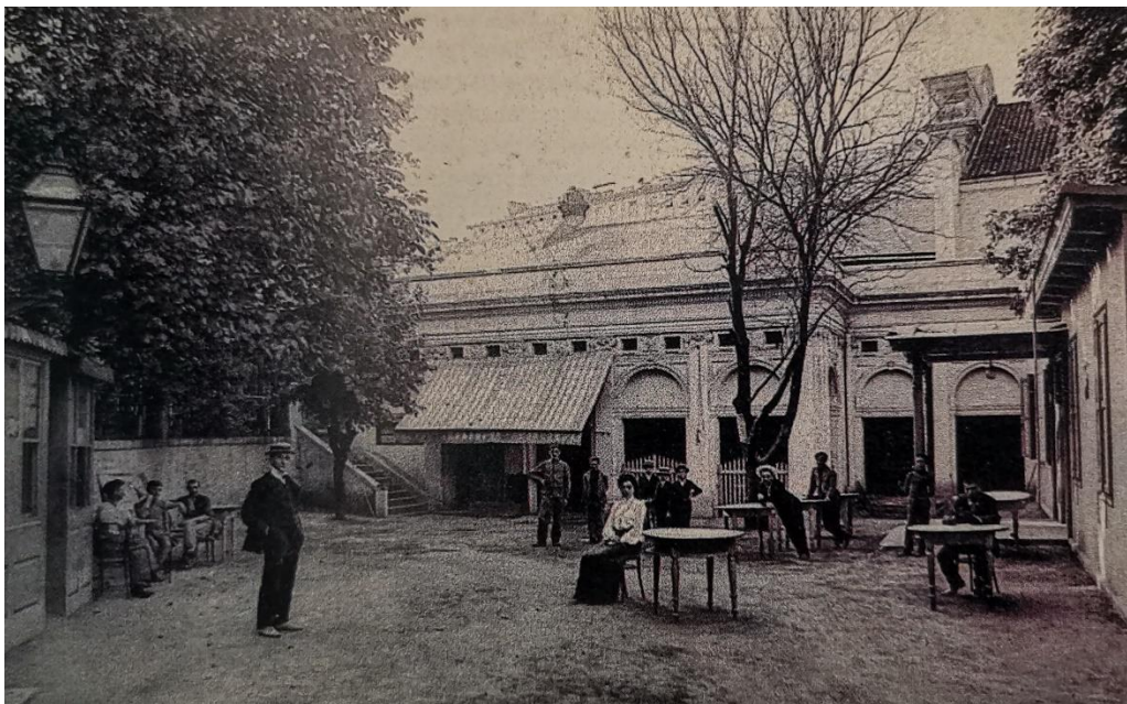
Slika 8. Teatro Ricotti – Fenice (Daina Glavočić...et al., Arhitektura historicizma u Rijeci , Rijeka, Moderna galerija Rijeka – muzej moderne i suvremene umjetnosti, 2002., str.255.)