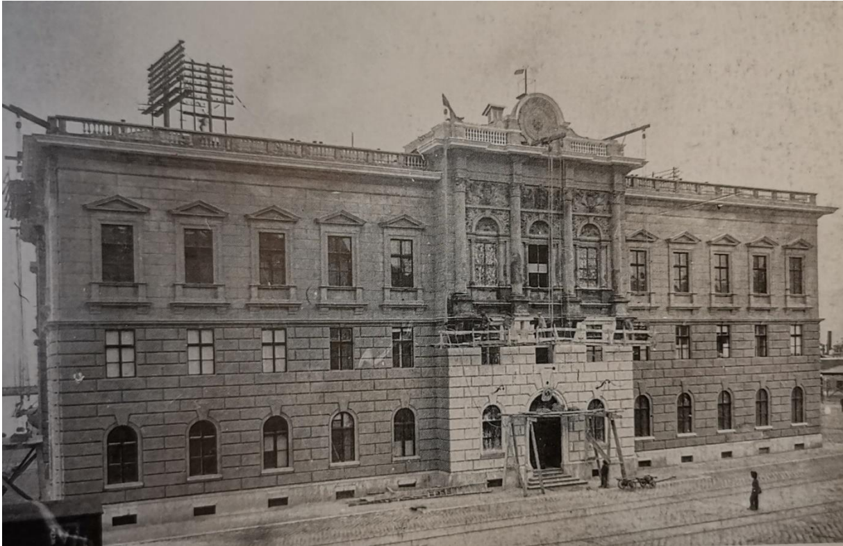
Slika 2. Zgrada bivšeg pomorskog Gubernija (Daina Glavočić...et al., Arhitektura historicizma u Rijeci , Rijeka, Moderna galerija Rijeka – muzej moderne i suvremene umjetnosti, 2002., str.203.)

Kraljevskog pomorskog Gubernija našla u neposrednoj blizini mora. Izgradnja je bila skupa, ali se mogla brzo dovršiti zbog poreznih olakšica koje su mađarski zakoni pružali investitorima prilikom gradnje u Rijeci. 24