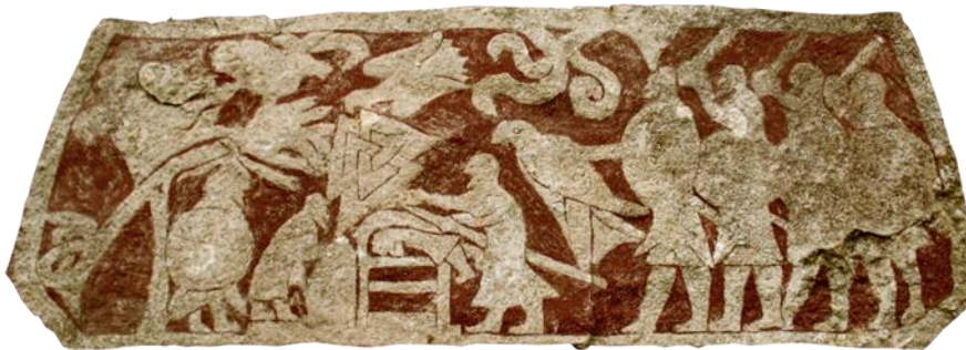
Slika 2: Stora Hammar I. https://www.medievalists.net/2011/01/notes-and-documents-viking-atrocity-and-skaldic-verse-the-rite-of-the-blood-eagle/ (Pristupljeno: 11.08.2021.)

Vjerodostojnim izvorom smatra se jedan od četiri kamena iz Švedske datiranih oko 7. stoljeća poznatijih kao kamenje iz Stora Hammara. Naime, ovaj primjer gotlandskog slikanog kamenja ukazuje na to da su pripadnici elite sudjelovali u javnim kultovima i izvodili ritualne radnje. Čini se da je vladajuća obitelj koristila vjerske obrede pri očitovanju njihove moći i suvereniteta. Na tzv. Kamenu Stora Hammar I. postoji prikaz muškarca kako leži na trbuhu dok drugi muškarac iznad njega stoji sa oružjem na njegovim leđima.