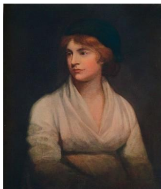
Slika 4. Mary Wollstonecraft