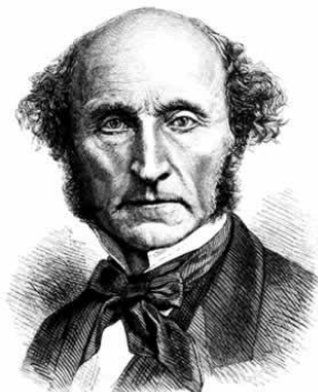
Slika 3. John Stuart Mill

je to da su stvari koje su ženama zabrane upravo one za koje su posebno kvalificirane (...)“ (Stuart Mill 2000:65).