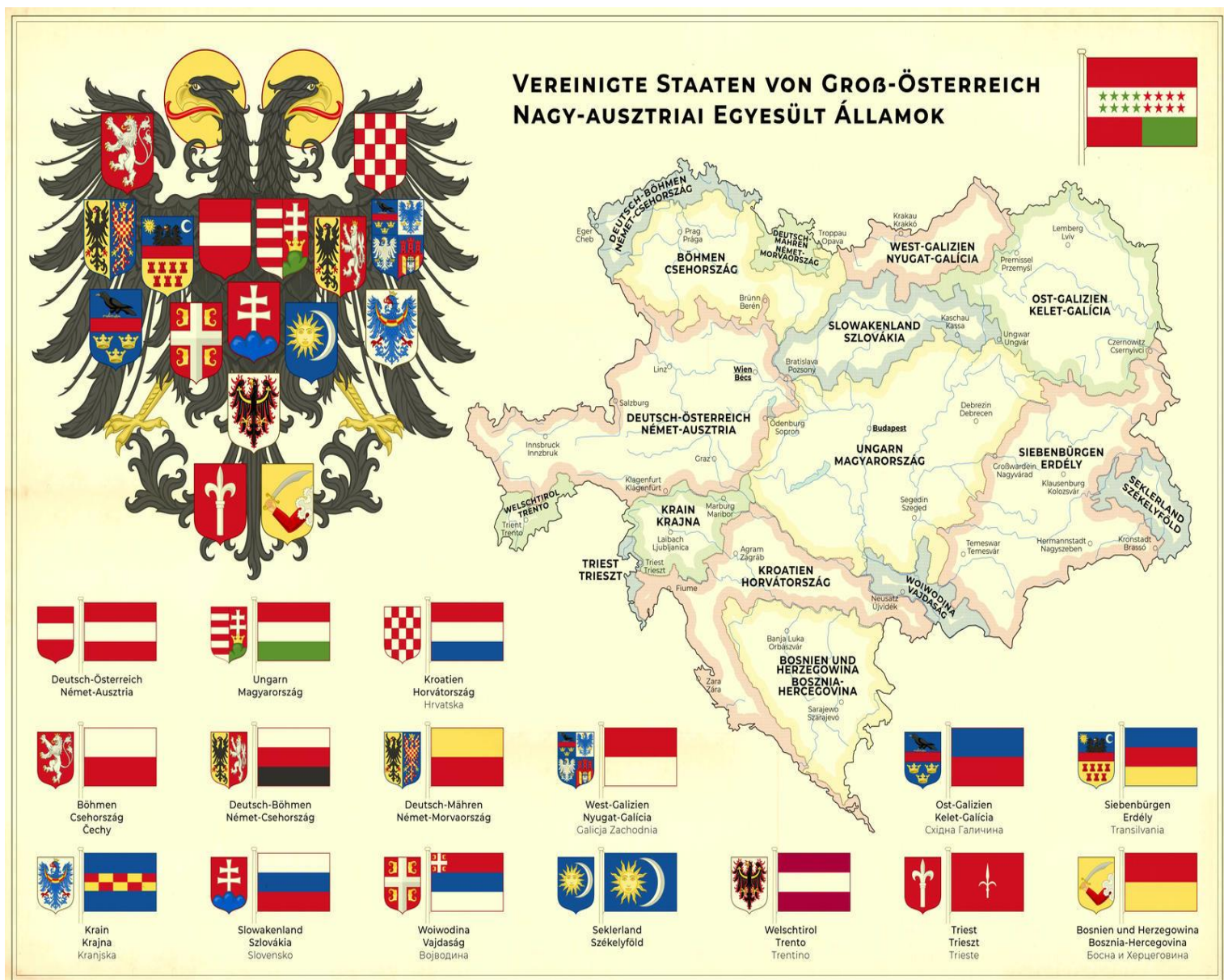
Slika 6. Umjetnička predodžba Ujedinjenih Država Velike Austrije