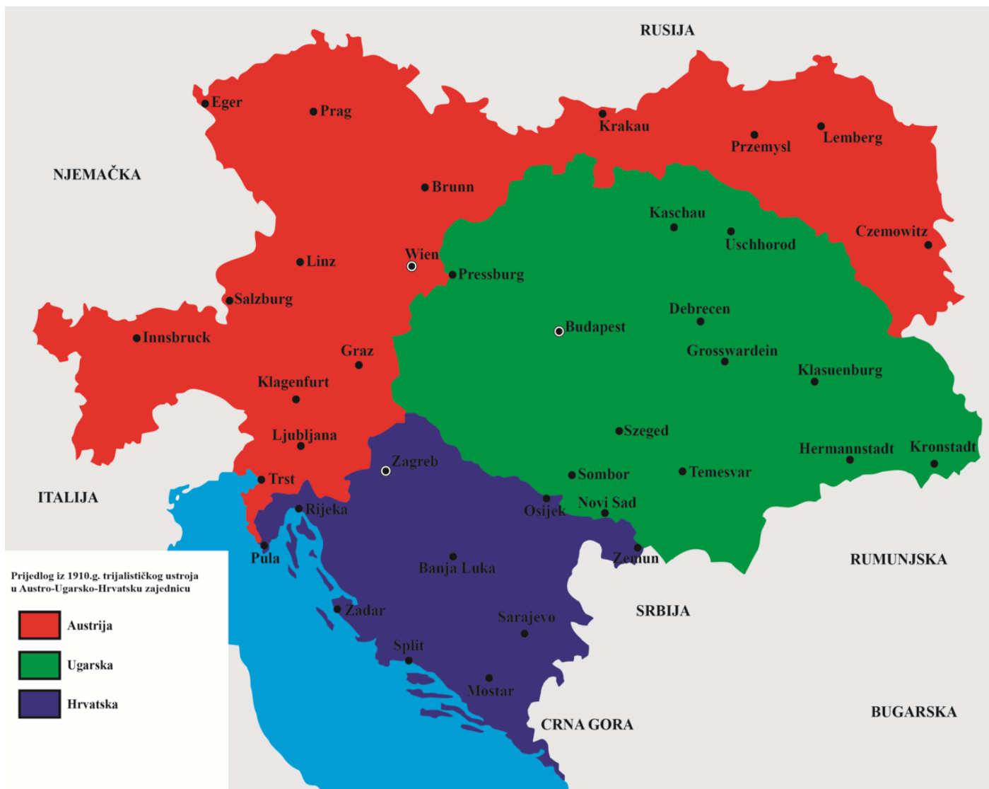
Slika 4. Kartografski prikaz trijalističkog ustroja bez Slovenije prema Ivi Pilaru 1910. godine