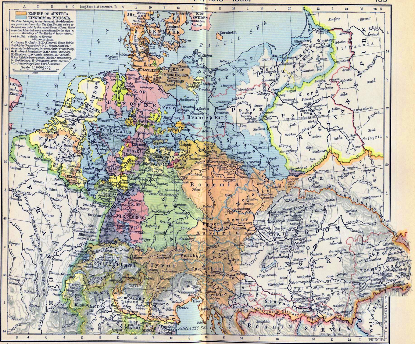
Slika 2. Kartografski prikaz Srednje Europe nakon Bečkog kongresa 1815. godine