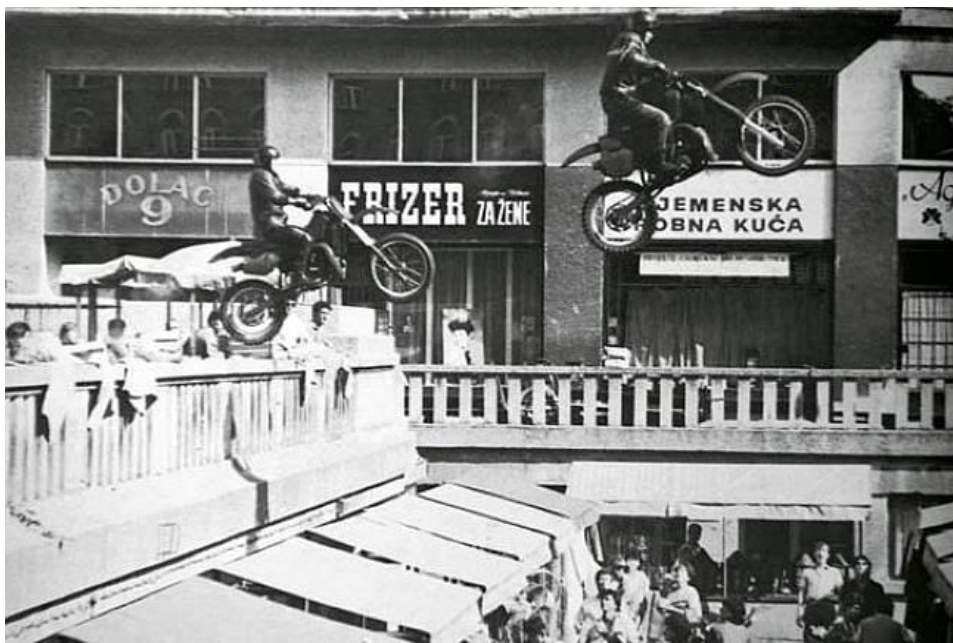
Slika 10 Prikaz kulisa Jadran filma

U Jadran film su dolazile filmske ekipe iz Italije, Češke, Rusije, Njemačke, Švedske, Austrije i SAD-a, a na vrhuncu njegova uspona paralelno se snimalo i po nekoliko filmova na različitim lokacijama. Lokacije su bile sagrađene u studijima Jadran filma i njegovih kooperanata, a samo neke od njih su Rim, Jeruzalem i Divlji zapad.