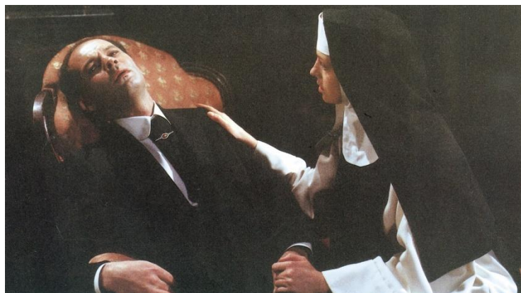
Slika 6 Scena iz filma Glembajevi Antuna Vrdoljaka

Kada govorimo o filmskim stilovima 60-ih godina su se pojavili brojni autorski i lokalni filmski stilovi koji su omogućili barem djelomično razlikovanje republičkih kinematografija- „crni talas“ kao karakteristika srpske kinematografije, umjereni modernizam kao obilježje hrvatske kinematografije i ekspresionistička „crna serija“ kao obilježje slovenske kinematografije. Unatoč raslojavanju, jugoslavenska kinematografija, promatrajući je kroz sistematizaciju modernističkih stilova, djelovala je kao cjelovit estetski sustav. Stilska heterogenost ipak je postojala i to unutar lokalnih filmskih sredina i autora pa se tako u hrvatskoj kinematografiji 60-ih godina razlikuje poetski modernizam naturalističkog stila Antuna Vrdoljaka u filmovima Kad čuješ zvona (1969) i U gori raste zelen bor (1971) i klasični stil njegovih Glembajeva (1988). Stilska heterogenost prisutna je i u filmovima Vatroslava Mimice koji se najprije temelje na prustovskoj tehnici prisjećanja (film Prometej s otoka Viševice , 1964), kasnije na radikalnoj struji svijesti (film Ponedjeljak ili utorak , 1966), visokom eksperimentalnom modernizmu ( Kaja, ubit ću te , 1967) i poetskom naturalizmu ( Događaj , 1969) sve do kasnomodernističkopolitizma ( Seljačka buna , 1975, Posljednji podvig diverzanta Oblaka , 1979) (Šakić, 2014).