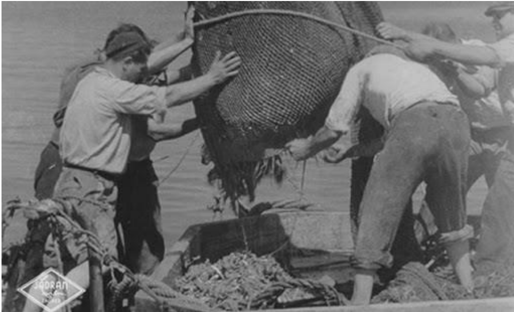
Slika 4 Scena iz filma Tunolovci Branka Belana

Bolji produkcijski uvjeti i drugačija estetika državne kinematografije najviše su došli do izražaja u filmovima poput Živjeće ovaj narod (1947) Nikole Popovića koji tematizira partizanski pokret u Bosni i koji se i danas smatra svjedočanstvom vremena i poratnog unitarizma, zatim u filmu Zastava (1949) Branka Marjanovića u kojem se partizanski pokret lokalizira i tumači lokalno (Šakić, 2014).