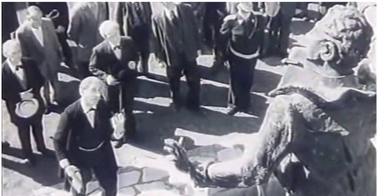
Slika 11 Scena iz filma CiguliMiguli

i Ivanovićeve fanatičnost da reformira kulturni život u gradu što kod stanovnika izaziva porugu, ali i revolt zbog zadiranja uhodanih i duboko ukorijenjenih oblika njihovog kulturnog djelovanja (Škrabalo, 1998). Ivanovićeve fanatičnost ne prestaje ni nakon masovne pobune i međusobne tuče glazbenika čija je malograđanština istaknuta scenom u kojoj omladina glazbenike tjera vatrogasnim šmrkom, već se odlučuje na uklanjanje kipa CigulijaMigulija s glavnog trga kao središnjeg motiva cijelog filma. Tijekom cijelog filma Marjanović se učestalo vraća na kip koji je u krupnom kadru bez pretjeranog objašnjavanja takvog stilskog pomaka (Zečević, 2009). Upravo jer scena prekrivanja kipa CigulijaMigulija daskama kod kritike izazvala burne reakcije jer ih je podsjetila na uklanjanje spomenika bana Josipa Jelačića s Trga Republike (Polimac, 2005). Taj čin izazvao je ovoga puta otpor svih stanovnika, a ipak ga predvode omladinci koji grade novi Dom kulture na čijem otvorenju pjevaju ponovno ujedinjena glazbena društva izvodeći svečanu skladbu „Naš grad je slobodan“.