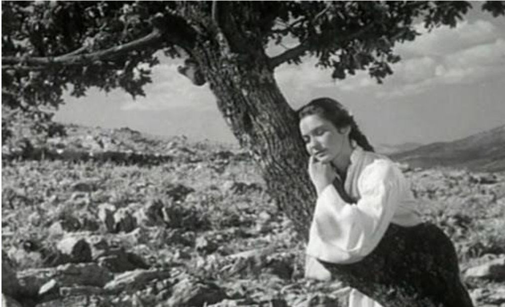
Slika 5 Scena iz filma Djevojka i hrast Kreše Golika