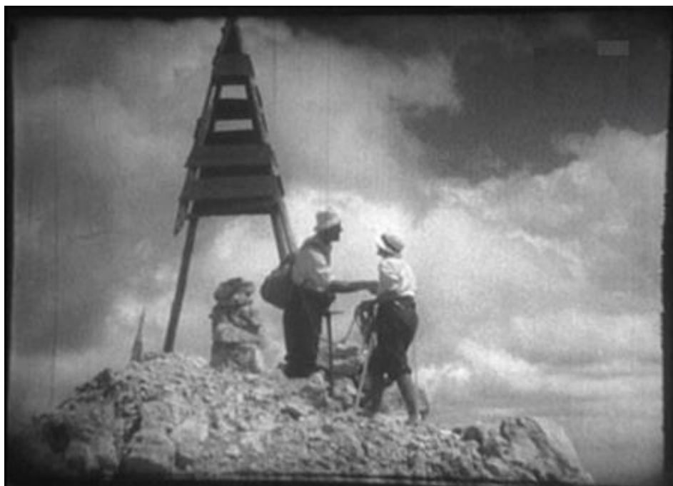
Slika 2 Scena iz prvog hrvatskog dugometražnog filma Durmitor