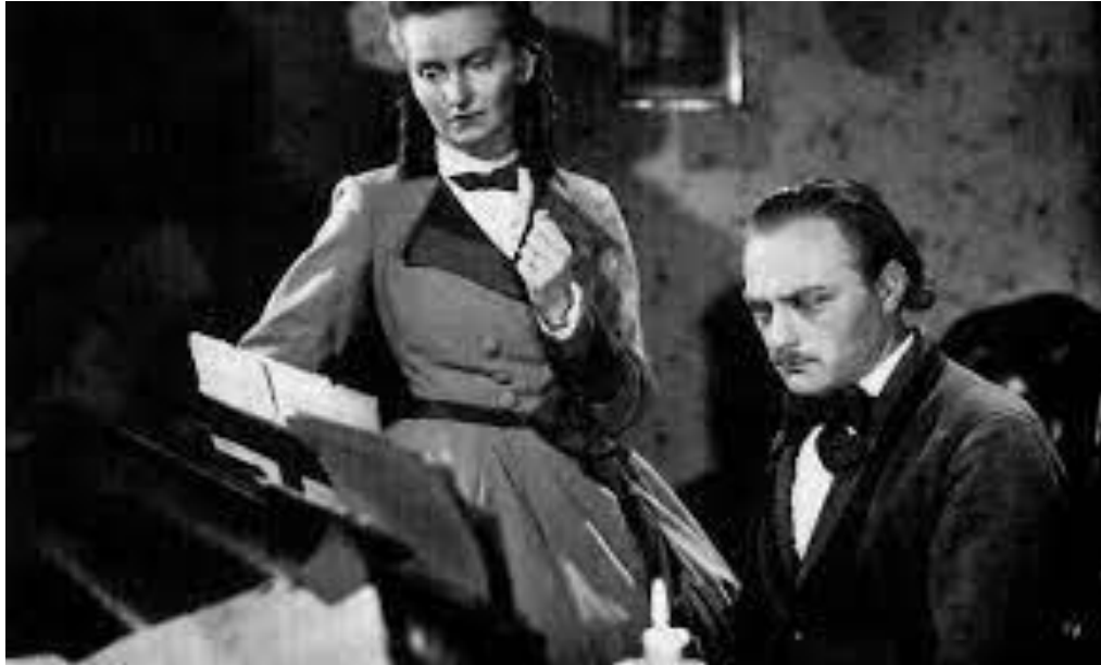
Slika 3 Scena iz dugometražnog igranog filma Lisinski Oktavijana Miletića