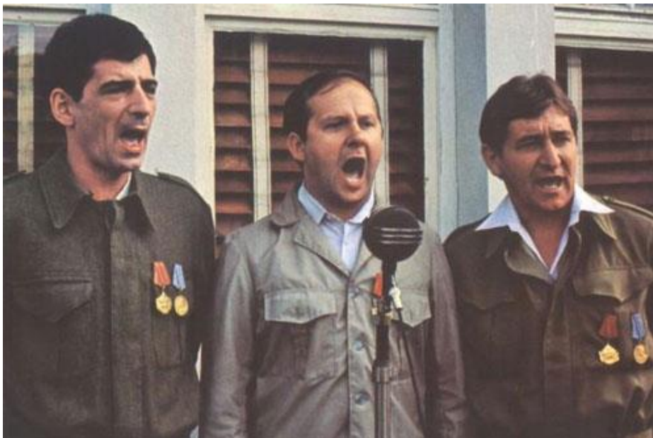
Slika 8 Scena iz filma Samo jednom se ljubi Rajka Grlića

Hrvatski filmovi 70-ih godina kategoriziraju se kao politički filmovi, ali ne samo u smislu političke struje, odnosno feljtonsko-kritičkog socijalnog filma nastalog u sjeni gušenja Hrvatskog proljeća kakvi su filmovi Kuća (1975) i Novinar Bogdana Žižića , već i politički partizanski filmovi crvenog vala kakvi su filmovi Krste Papića Izbavitelj , Radićev film Timona te Mimičina Seljačka buna (1573). Osim kao politički filmovi, oni se mogu smatrati i filmovima tzv. praške škole u kojima se tematizira političko razočaranje u postrevolucionarno društvo kakve pronalazimo u Belanovom Koncertu , Papićevim Lisici i mai Grlićevom Samo jednom seljubi (Kurelec, 2004).