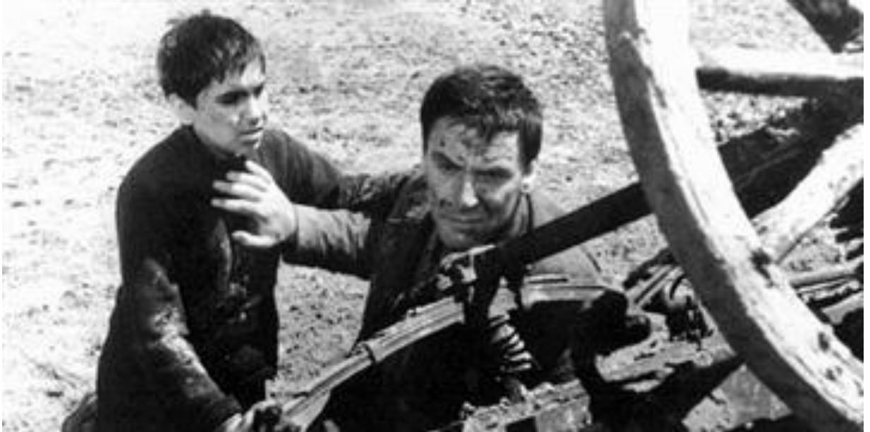
Slika 12 Scena iz filma ne okreći se sine

sine Bauera učinio i profesionalnim i filmsko-političkim autoritetom postajući tako „(...) reprezentom ideološki uzorne upotrebe klasičnog stila.“ (Turković, 2002: 17).