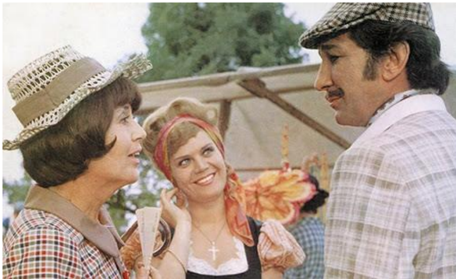
Slika 7 Scena iz filma Tko pjeva zlo ne misli Kreše Golika

Osim Vrdoljaka i Mimice stilski su varirali i Tomislav Radić koji je kreirao dva visokomodernistička politička filma Živa istina (1972) i Timon (1973), a nakon 1991. se vratio klasičnoj naraciji, zatim Krešo Golik koji je većinom ostao dosljedan klasičnom narativnom filmu ( Imam 2 mame i 2 tate , 1968; Tko pjeva zlo ne misli , 1970), no imao je i jedan naturalistički film, a to je Razmeđa (1973). Fadil Hadžić u svom opusu ima klasične trilere ( Abeceda straha , 1961), partizanske spektakle ( Desant na Drvar , 1963, Konjuh planinom , 1966), ali i novovalne filmove nalik na zagrebačke hičkokovce ( Tri ljubavi za sat , 1968., Divlji , 1969), modernističke kritičke filmove ( Protest , 1967, Lov na jelene , 1972), modernističke eksperimentalne filmove ( Idu dani , 1970) i kanonske filmove kasnog proljećarskog modernizma ( Novinar , 1979). Od klasičnog autorskog filma krenuo je Zvonimir Berković ( Rondo , 1966), preko modernističkog filma ( Putovanje na mjesto nesreće , 1971) do autorskih art filmova ( Ljubavna pisma s predumišljajem , 1985., Kontesa Dora , 1993). Poznati Ante Babaja krenuo je s visokomodernističko-naturalističkom folklornom Brezom (1967), nastavio s egzistencijalističkim modernizmom ( Mirisi, zlato i tamjan , 1971, Izgubljeni zavičaj , 1980), a završio s egzistencijalističkim art filmom kasnog modernizma ( Kamenita vrata , 1992) (Šakić, 2014).