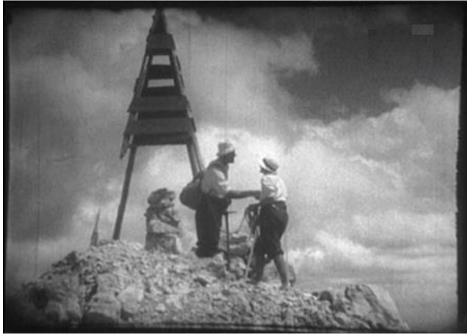
Slika 2 Scena iz prvog hrvatskog dugometražnog filma Durmitor