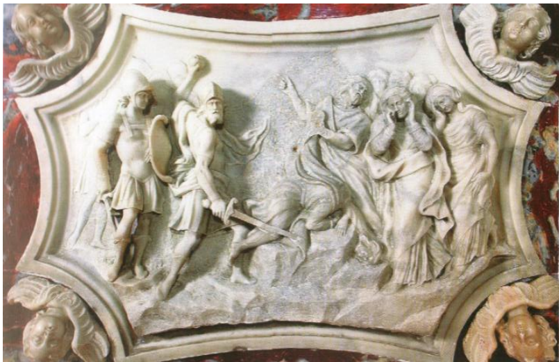
Slika 9. Francesco Cabianca, Otkidanje glave sv. Tripuna, mramorni reljef