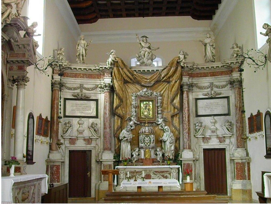
Slika 12. Francesco Cabianca, Glavni oltar u crkvi sv. Klare