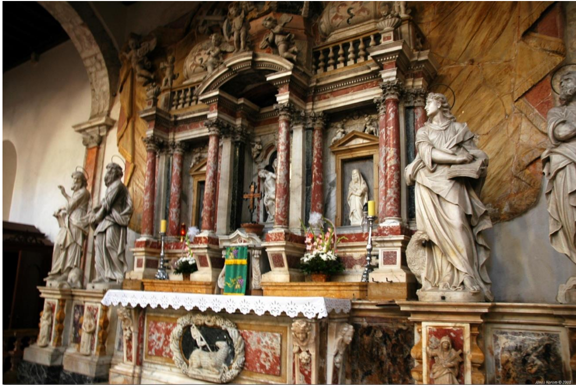
Slika 1. Oltar Presvetog Sakramenta, katedrala sv. Anastazije (Stošije), Zadar, 1719.