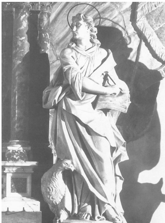
Slika 4. Francesco Cabianca, Sv. Ivan, Oltar Presvetog Sakramenta, katedrala sv. Anastazije (Stošije), Zadar, 1719.