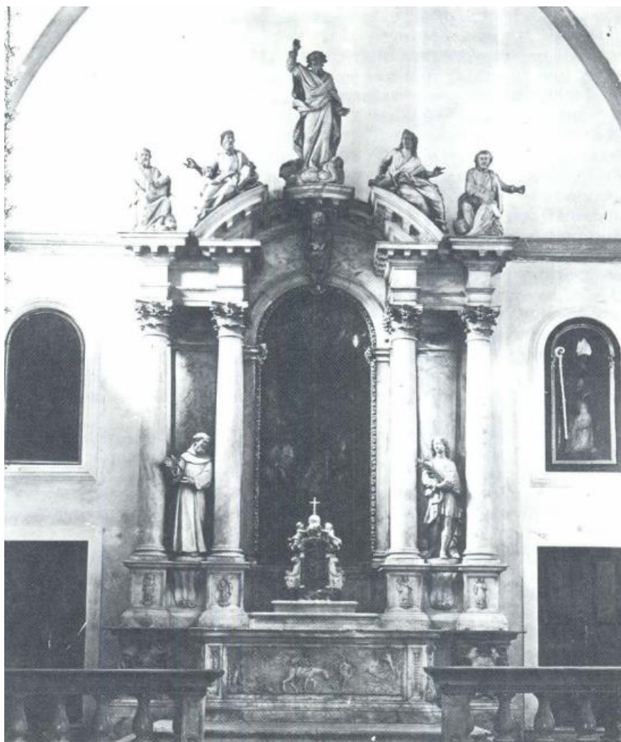
Slika 13. Francesco Cabianca, Glavni oltar u crkvi sv. Josipa