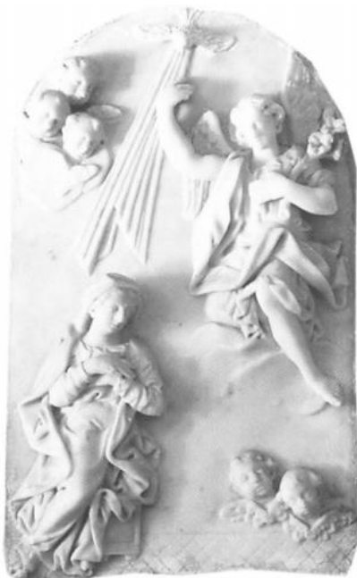
Slika 18. Bortolo Modolo, Reljef Navještenja u svetištu Gospe od Škrpjela