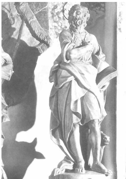
Slika 5. Francesco Cabianca, Sv. Luka, Oltar Presvetog Sakramenta, katedrala sv. Anastazije (Stošije), Zadar, 1719.