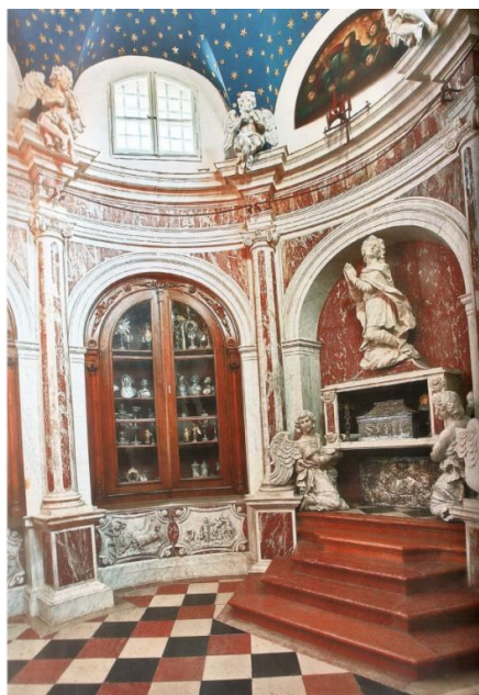
Slika 8. Francesco Cabianca, Mramorni relikvijarij katedrale sv. Tripun