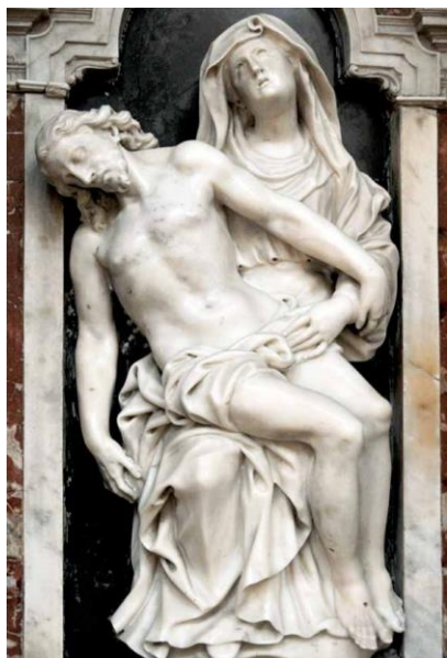
Slika 6. Paolo Callallo, Pietà, središnja niša oltara Presvetog Sakramenta, katedrala Svete Stošije, Zadar