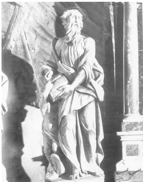
Slika 3. Francesco Cabianca, Sv. Matej, Oltar Presvetog Sakramenta, katedrala sv. Anastazije (Stošije), Zadar, 1719.