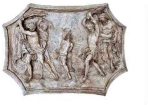
Slika 14. Francesco Cabianca, Terakotni model s prikazom bičevanja svetog Tripuna