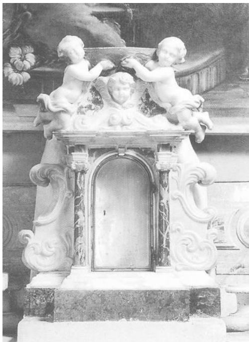
Slika 17. Francesco Cabianca, Svetohranište u franjevačkoj crkvi sv. Antuna u Perastu