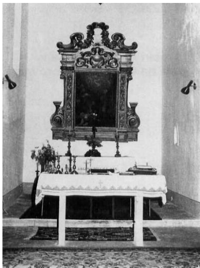
Slika 7. Oltar benediktinske crkve sv. Jakova na Višnjici