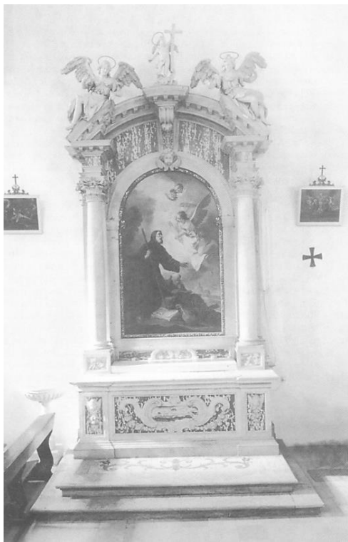
Slika 16. Francesco Cabianca, Oltar sv. Frane Paulskog u crkvi sv. Klare