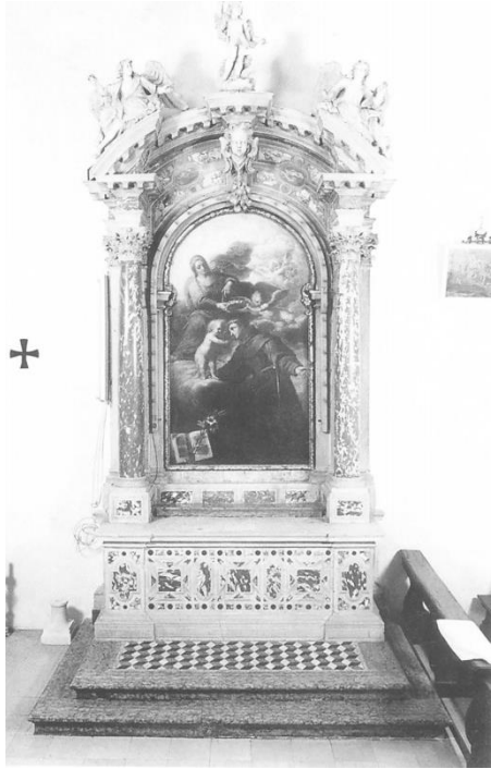
Slika 15. Francesco Cabianca, Oltar sv. Ante Padovanskog u crkvi sv. Klare