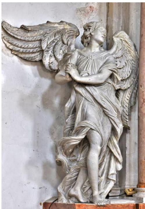
Slika 20. Francesco Cabianca, Anđeo, Sveti Šime, Zadar