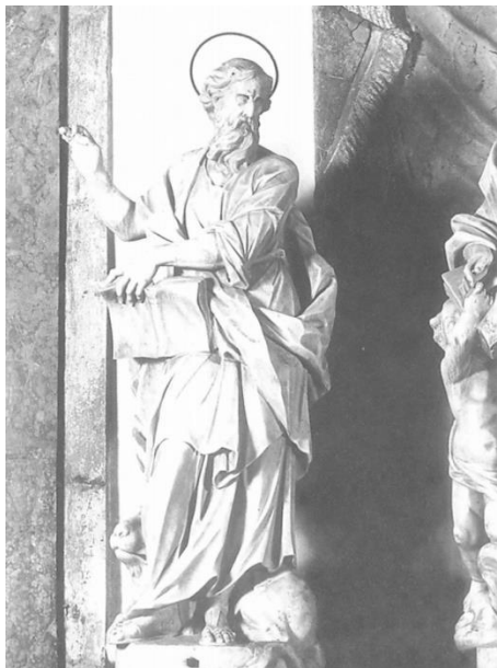
Slika 2. Francesco Cabianca, Sv. Marko, Oltar Presvetog Sakramenta, katedrala sv. Anastazije (Stošije), Zadar, 1719.