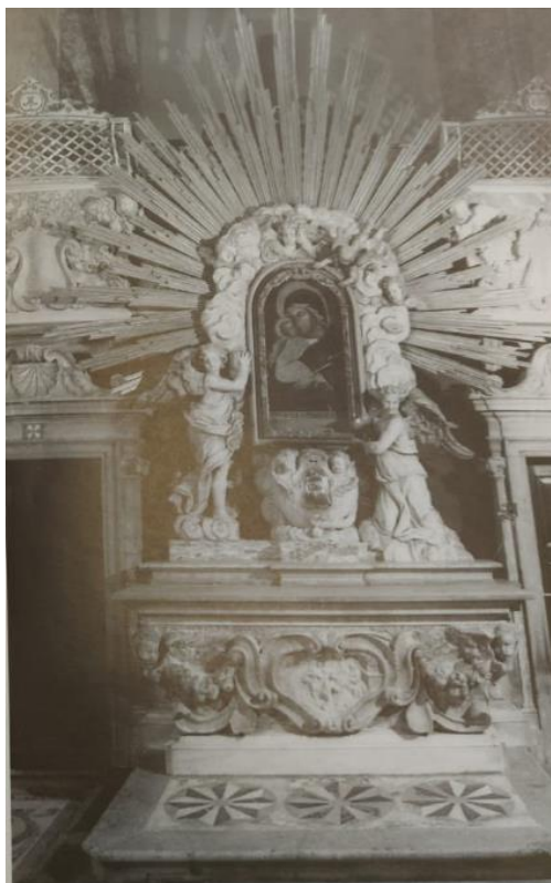
Slika 19. Francesco Cabianca?, Glavni oltar crkve Gospe od Zdravlja