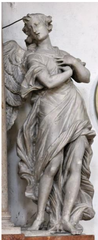
Slika 21. Francesco Cabianca, Anđeo, Sveti Šime, Zadar