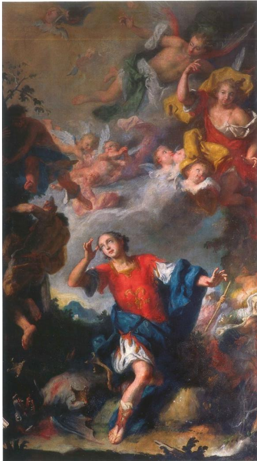
10. Giuseppe Camerata Čudo sv. Servula oko 1737. godine ulje na platnu, 210 x 120 cm zid trijumfalnog luka lijevo, župna crkva sv. Servula, Buje