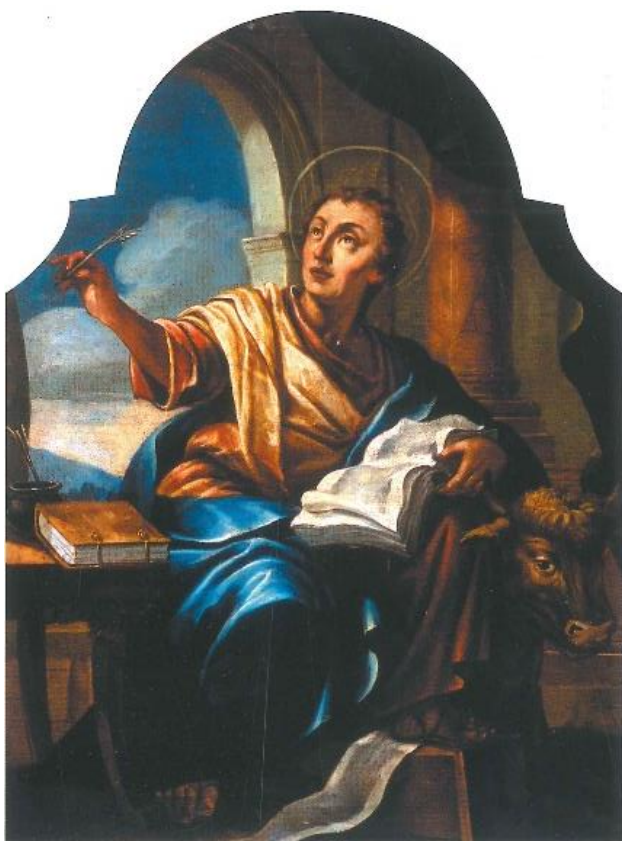
40. Nepoznati slikar Sv. Luka Evandelist oko 1779. godine ulje na platnu, 77 x 57 cm zid bočnog broda župne crkve sv. Jurja i Eufemije, Rovinj