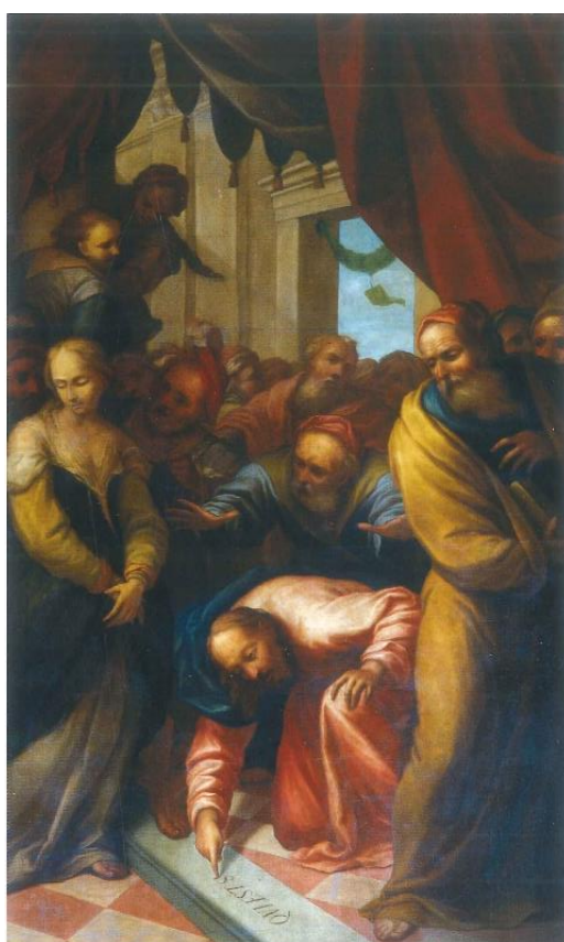
6. Gaspare della Vecchia Krist i preljubnica 1711. godina ulje na platnu, 300 x 200 cm južni zid broda crkve Marije od Milosrđa, Buje