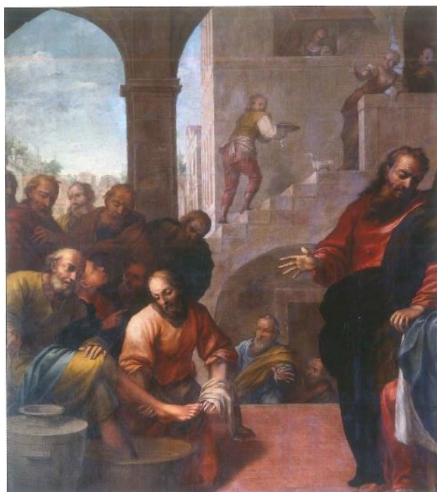
4. Gaspare della Vecchia Pranje nogu 1711. godina ulje na platnu, 300 x 240 cm južni zid broda crkve Marije od Milosrđa, Buje