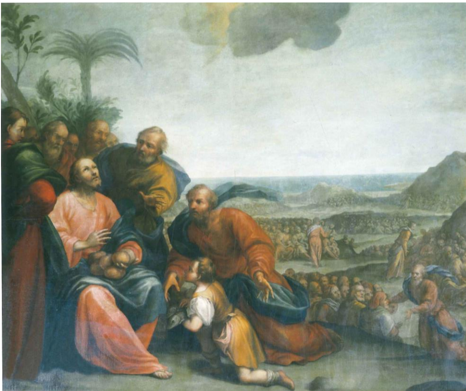
8. Gaspare della Vecchia Čudo umnažanja kruha i riba 1711. godina ulje na platnu, 300 x 340 cm južni zid broda crkve Marije od Milosrđa, Buje