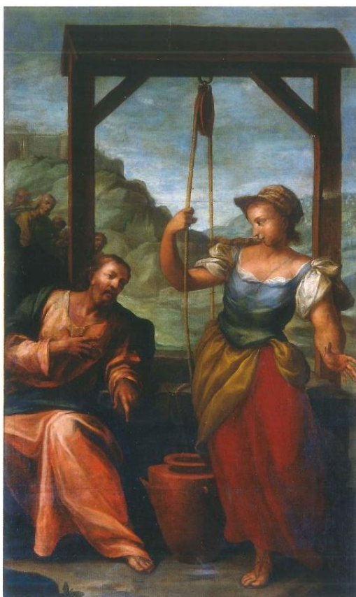
5. Gaspare della Vecchia Krist i Samarijanka 1711. godina ulje na platnu, 300 x 200 cm sjeverni zid broda crkve Marije od Milosrđa, Buje