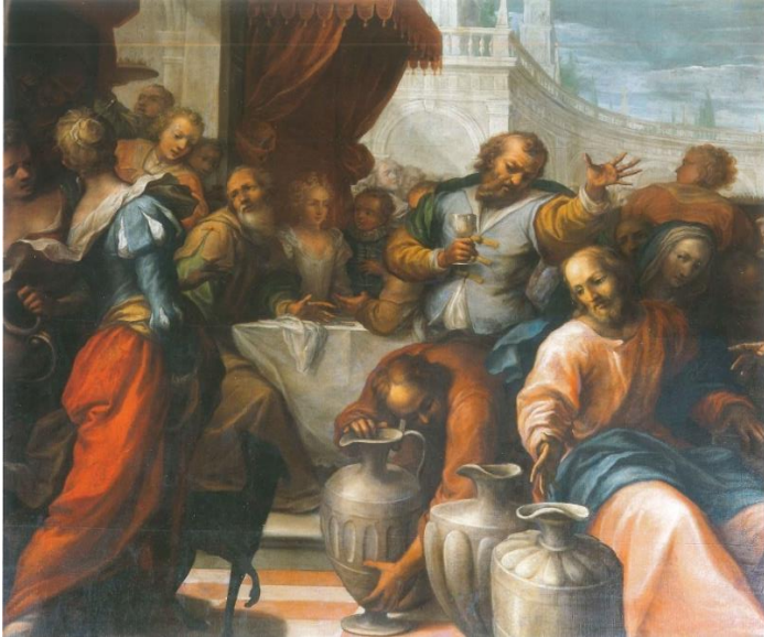
7. Gaspare della Vecchia Svadba u Kani 1711. godina ulje na platnu, 300 x 340 cm sjeverni zid broda crkve Marije od Milosrđa, Buje