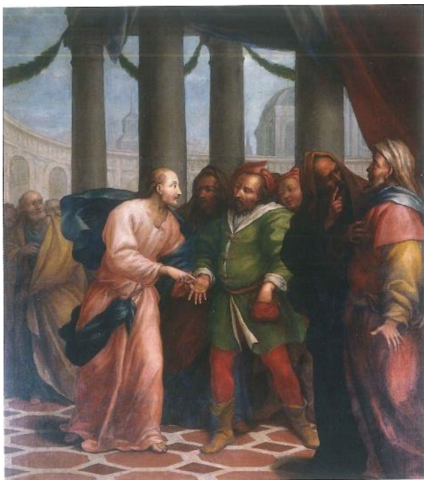
3. Gaspare della Vecchia Porezni novčić 1711. godina ulje na platnu, 300 x 240 cm sjeverni zid broda crkve Marije od Milosrđa, Buje