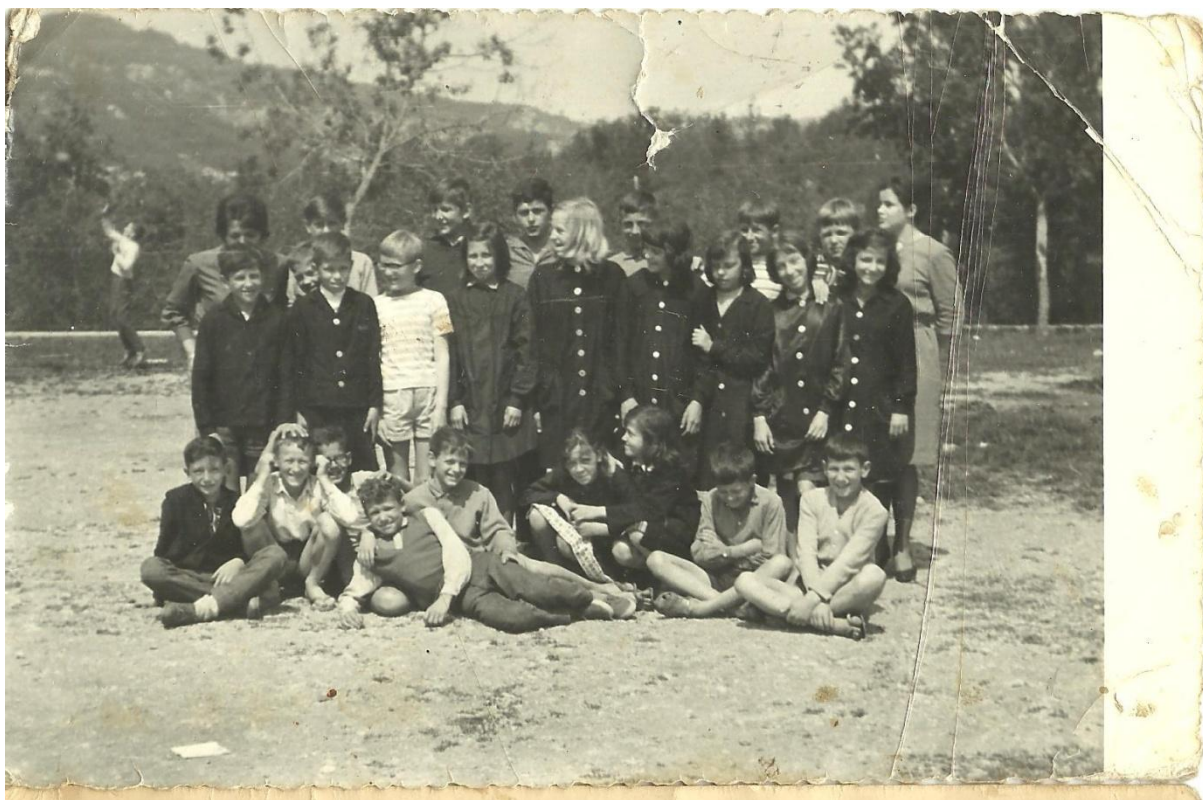
Slika 5. Kute 2/2.

U školama učenici nisu bili u svakodnevnoj odjeći, već su oblačili kute : Crne kute. Ko stare nonice. I bijela kragnica, štikana (...) (B.P.,72 - Baričevići, Vranja) / Mi ženske smo imale... Bile su lijepa, ovde su bile ovako odrezane ispod prsa nekako, i onda malo dole na šire, sa velikim dugmadima. A muški su imali kao neke jaketice. (N.K.,65 - Mavrovija, Vranja). Djevojčice su imale uniforme do ispod koljena, dok su dječaci imali samo gornji dio, odnosno jaknice (Slika 5. i Slika 6.). Najčešće su ih šivale majke, kao i školske torbe, koje su se rjeđe kupovale: (...) najprije smo imeli školsku boršu ča su nan doma zašili od robe, i tako da ovaj, na tregere. Ne, na rame. A poslije smo... (...) kasnije kad smo išli sedmi, osmi razred su nam kupili torbe da imamo već modernije malo. (F.F.,65 - Račice). / (...) jednu torbu školsku si imao, ako se dobilo kakovi komad cerade pa ti je to... je ona to sašila, i preko ramena, i nutra par knjiga. (R.R.,74 - Gambarija, Lesišćina). Sudionici se prisjećaju kako im torbe gotovo pa i nisu trebale, jer je knjiga bilo vrlo malo. Kako kažu, imali su tek čitanku te udžbenike iz matematike i prirode i društva, kao i bilježnicu za svaki nastavni predmet. Do školskog pribora nije bilo jednostavno doći što zbog izoliranosti sela, što zbog siromaštva, stoga su se djeca morala snalaziti s onime što su imali na raspolaganju: Nismo ni gumicu imali, znaš, za brisat. Nego komad, ono znaš, sredinu kruha, malo vode i to, to smo... i posle s