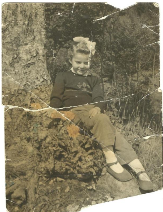
Slika 3. Žoki ili natikače.

(R.R.,74 - Gambarija, Lesišćina ). / Bijele kalcete, 'nači, ovaj, dokoljenke, sandale u ljeti, kakve smo imali, no, nisu bili moderni neki, ali... i cipele, svakakvih je bilo. (F.F.,65 - Račice ). Osim čiste odjeće obvezne su bile i rezervne cipele. Naime, ceste u to vrijeme nisu bile asfaltirane, pa su se pri hodanju prašile, ili pak bile blatnjave uslijed kiše. Stoga su ljudi prljave cipele ostavljali u grmlju ili uz put, a u crkvu odlazili u čistim: Onda tamo zgora ceste smo si ostavili ovi... Cipele neke lošije, onda smo si obukli malo one bolje. (M.S.,65 - Brest pod Učkom ). Seoski su dječaci svoja prva odijela dobivali uglavnom za prvu pričest ili krizmu: I tamo su mi prvi put šivali odijelo, kad sam trebao se pričestit. (F.F.,65 - Račice ), dok su djevojčice u tim prilikama nosile dugačke bijele haljine i veo: (...) to smo imali duge haljine... I vel, to smo imali. (M.R.,73 - Vranja ).