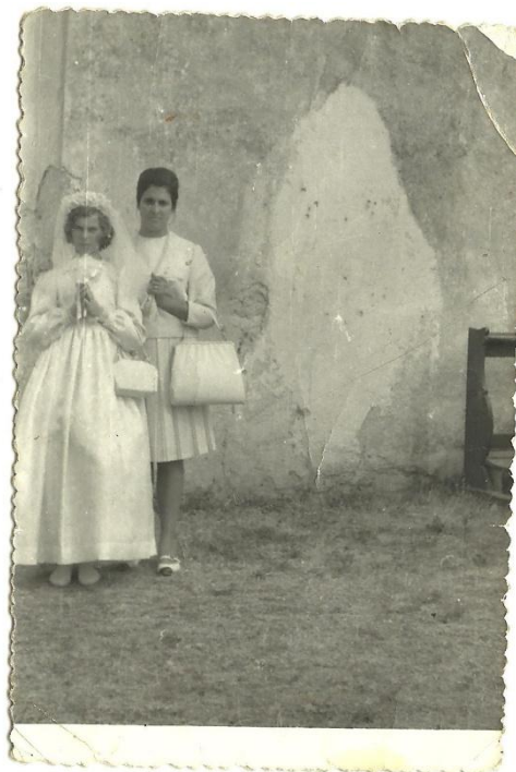
Slika 8. Djevojčica na prvoj pričesti