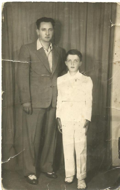
Slika 6. Prva pričest - prvo odijelo

djevojčice taj dan bile odjevene u duge bijele haljine, a na glavi su imale vjenčić ili veo (Slika 7. i Slika 8.). Kupovina je predstavljala priličan izdatak za roditelje, pa se odjeća često nasljeđivala, ili čak posuđivala.