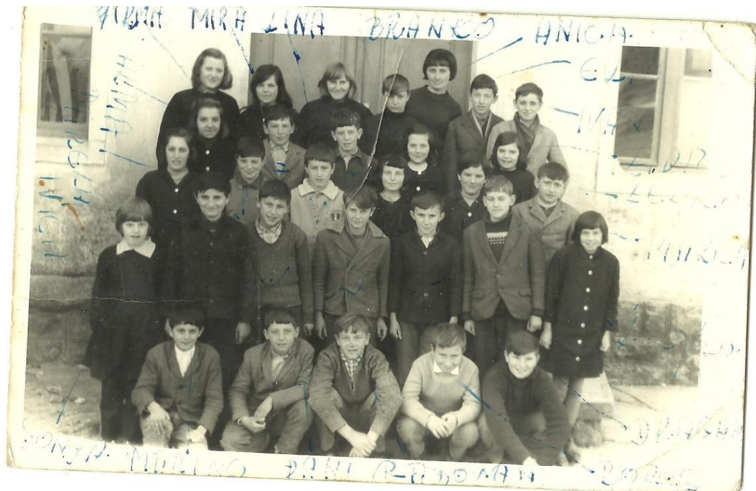
Slika 4. Kute 1/2 (Izvor: iz osobne kolekcije sudionika).

promjena na obrazovanje. Učenike se poučavalo likovnoj i glazbenoj kulturi, dok se tjelesni održavao na igralištu ili u školskom dvorištu. U višim razredima osnovne škole djeca su učila i strane jezike, primjerice francuski ili engleski, a kao posebnost onog vremena ističe se i nastavni predmet Domaćinstvo: Svi smo imali svoj nožić, nismo imali pilicu, nego nož, neku britvu ili koserić, i onda taj dan kad je rekla učiteljica da donesemo nešto za rezbarit, onda doneseš nešto, šta ja znam... I onda smo radili svašta. Onda smo učili radit ove... plesti košarice od bevke, znaš ono, žukva. To smo radili, i onda smo radili neke... neke ko vile ili one spone, znaš, za krave i to. (I.B.,69 - Kras). / I učili su nas kako se šiva, i kako se... Curice. A dečki su više radili drugo nešto. Kako se sa čekićima, sa ovo, sa ono... (M.S.,65 - Brest pod Učkom). Iako su učionice bile opremljene klupama, stolicama i školskom pločom, nije svaka škola imala osigurana i pomoćna sredstva kao što je primjerice zemljopisna karta, stoga je bio običaj posuđivati od obližnjih škola: (...) sjećan se da smo po pruge nosili po dvije... po dvoje nas da smo išli i nosili zemljopisnu kartu. (M.R.,73 - Vranja).