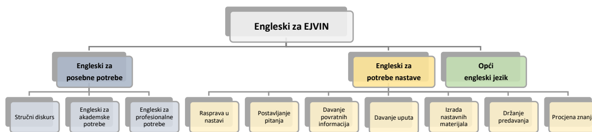
Slika 1: Jezično umijeće u engleskome za EJVIN

potencijalno izazovni operacionalizacija jezičnih vještina za EJVIN u različitim disciplinama i svojevrsno razgraničenje jezičnoga umijeća potrebnoga za izvođenje nastave od općega jezičnog umijeća (Wang 2021). Usto nema dovoljno empirijskih dokaza minimalne jezične razine za učinkovito poučavanje na engleskome (Lasagabaster 2022; Martinez i Fernandes 2020). Stoga je teško postaviti minimalne kriterije koje bi nastavnici trebali zadovoljiti kako bi mogli sudjelovati u EJVIN-u. Osim toga čak i nastavnici koji imaju dobre vještine čitanja, slušanja, pisanja i govorenja možda nisu dovoljno dobri u usmenoj interakciji, akademskome i stručnome diskursu, što je ključno za poučavanje na engleskome. Već je navedeno da opće jezično umijeće nije nužno dovoljno za nastavu (Freeman i sur. 2015). Uzimajući u obzir činjenicu da kompetencije nastavnika u različitim područjima engleskoga jezika (vidi sliku 1) izravno utječu na kvalitetu nastave, poučavanje složenoga akademskog sadržaja na engleskome predstavlja znatan izazov za nastavnike i studente kojima je engleski strani jezik (Drljača Margić i Vodopija-Krstanović 2017).