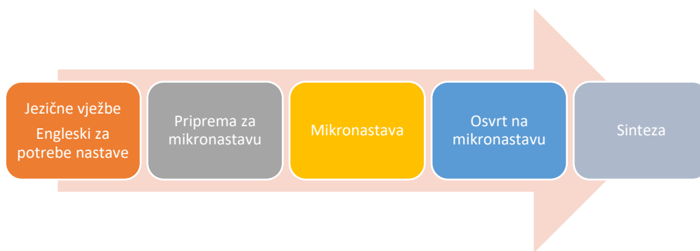
Slika 4: Mikronastava u PCO-u za EJVIN

mikronastave voditelji programa i kolege ispunjavaju opservacijski obrazac, čime se usmjerava opservacija i podiže svijest o pojedinačnim aspektima nastave. Preciznije, osvrt na mikronastavu sastoji se od dvaju dijelova. U prvome dijelu nastavnici daju usmeni osvrt i komentare na svoju nastavu te dobivaju povratne informacije od voditelja i kolega. U drugome dijelu nastavnici gledaju videozapis mikronastave te daju vođeni pisani osvrt na svoje postupke. Voditelji na kraju sažimaju sve stečene uvide, ističu jake strane i upozoravaju na izazove te daju prijedloge za poboljšanje.