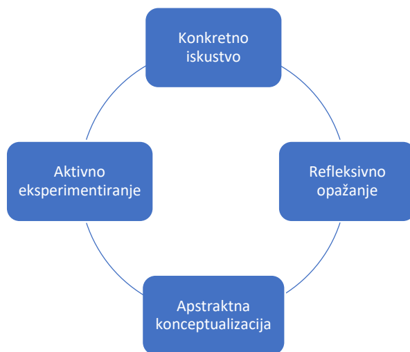
Slika 3: Ciklični model iskustvenoga učenja (Kolb 1984: 21)

Jedna je od glavnih prednosti PCO-a za EJVIN to što omogućuje nastavnicima da kroz različite uloge, nastavnika u EJVIN-u, učenika jezika i studenta koji pohađa nastavu na engleskome, uče i kritički se osvrću na vlastiti proces učenja i poučavanja, kao i onaj svojih kolega.